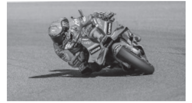
El italiano abrió la temporada ganando.