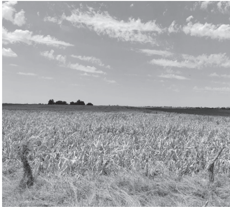
Esperanza. Algo de agua trajo cierto alivio a los campos.