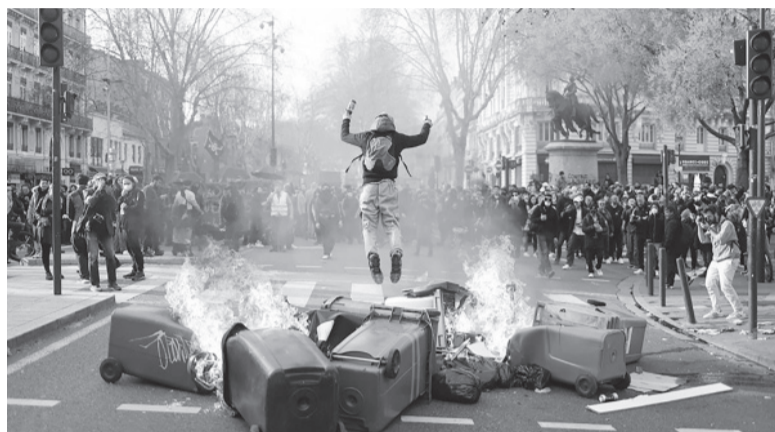
Semanas tormentosas. Las protestas ganaron las calles francesas.

"El prefecto de Policía habló y dijo que condenaba estos comentarios inaceptables y que se había abierto una investigación, que en las próximas horas, esperemos, se darán las conclusiones. Evidentemente, habrá sanciones", declaró el ministro de Interior francés,