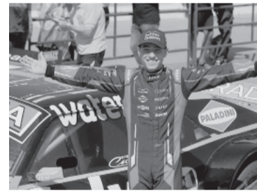
Quando ganas por primera vez en el TC.