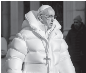
El Papa con un "camperón".