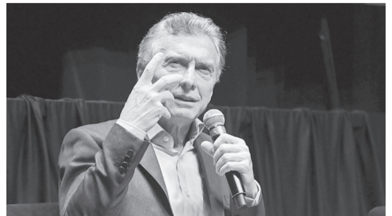
Sin segundo tiempo. Macri declinó sus aspiraciones.

"Ahora tenemos que estar muy atentos, porque en situaciones difíciles enseguida salimos a buscar una personalidad mesiánica que nos dé seguridad, y JxC ha logrado superar esa falsa ilusión del individuo salva-