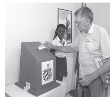
Votó Cuba.

Entre los candidatos había históricos de la revolución, como el expresidente Raúl Castro, de 91 años, ministros, altos cargos del PCC, burócratas, músicos, científicos, intelectuales y responsables de empresas estatales. No había, eso sí, ningún opositor.