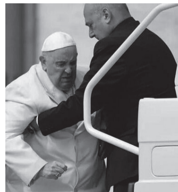
Jorge Bergoglio.

Hace una semana circuló en el Vaticano la versión no confirmada de que el Papa había comentado que los problemas intestinales "habían vuelto". Los divertículos son pequeñas bolsitas que se forman en el colon y que se infectan con facilidad. Son comunes en los ancianos. El diagnóstico de los cirujanos fue que padecía "una