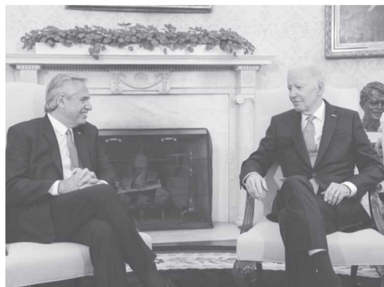
Apoyo. A regular la venta de armas, entre otros temas. - DIB -

“Vemos el grave problema que la invasión rusa ha ocasionado a Ucrania y ha generado un daño inconmensurable a la economía mundial”, expresó Fernández desde el Salón Oval. Además, sostuvo que con Biden tienen una “preocupación común” por el cambio climático y señaló que Argentina “está padeciendo la peor sequía desde 1929”. El mandatario planteó