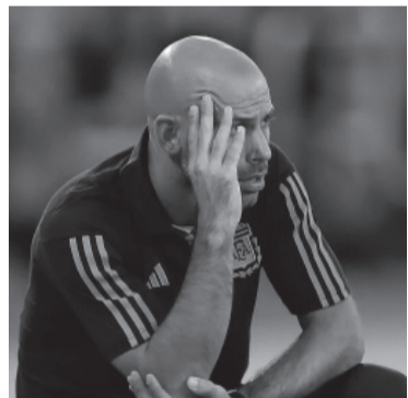
Mascherano podría seguir en el cargo.

La FIFA confirmó ayer que Indonesia no organizará el Mundial Sub 20, programado para fines de mayo, y crecen las chances de la Argentina que se postuló para ser sede.