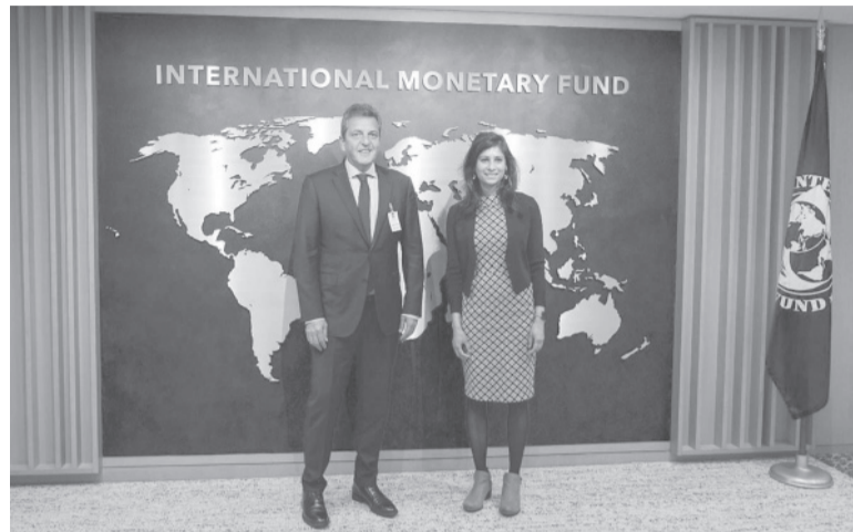
Encuentro. Con Gita Gopinath en Washington.

“Se discutió la cuarta revisión del programa, el severo impacto de la sequía y la importancia de las acciones para aumentar las reservas y continuar movilizando