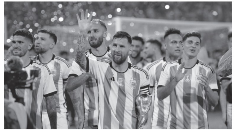
Semana intensa. Los protagonistas vivieron una Fecha FIFA alejada de la exigencia que suele tener jugar en la Selección. - Argentina -

Pero antes, en junio, la dirigencia de AFA tendrá la misión de cerrar los últimos dos amistosos del año con el mayor grado de exigencia posible y las dificultades que eso conlleva desde que Europa se encerró en su propia competencia interna.