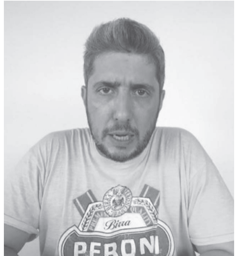
Descargo. El presentador y cantante Jay Mammon. - Captura -

Moral en diálogo con el periodista Jorge Rial por C5N. “Cuando Mammon dice que está pasando el peor momento de su vida, tengamos presente que eso es lo que le pasó a Lucas con todos los abusos que sufrió y que una cosa es ser sindicado abusador y otra ser abusado”, aseguró el letrado. “Al salir a defenderse -agregó Moral-, Mammon reconoce la relación, solo argumenta que sucedió a los 16 años y no a los 14, pero no se percata de que se sigue tratando de un menor y que por lo tanto se trató de una relación asimétrica”, subrayó. - DIB -