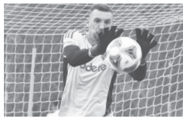
Armani viajó y entrenó. - CARP -