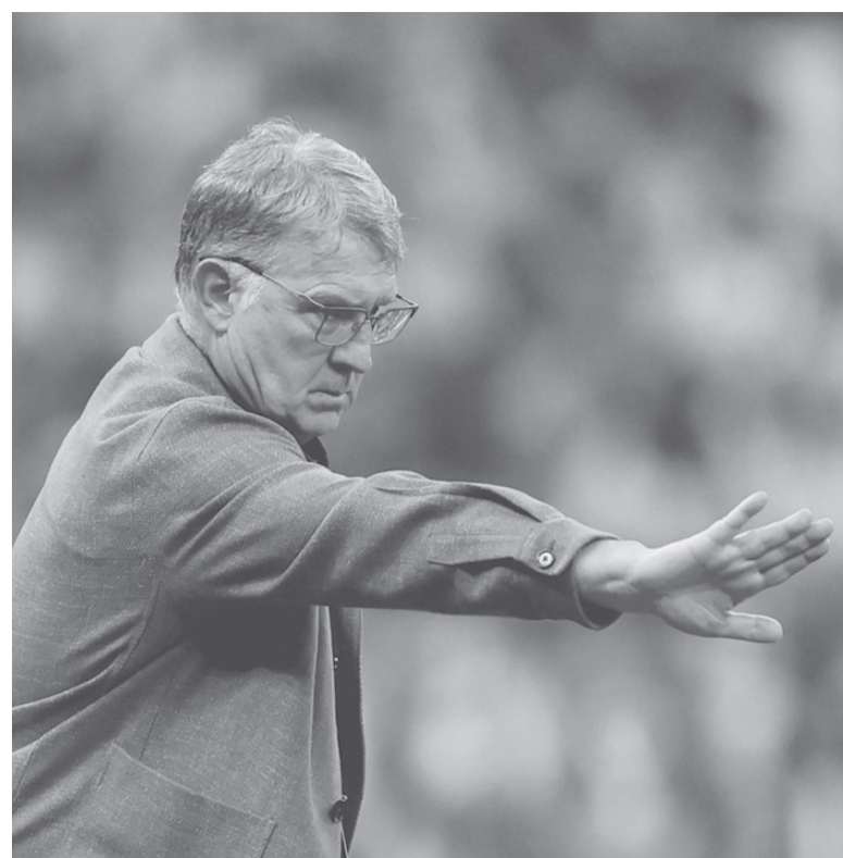
Elegido. La cúpula "xeneize" quiere un entrenador experimentado y no del "riñón" del club, por lo que el "Tata" es el elegido.

que se mencionaron como posibles entrenadores de Boca, el elegido por Riquelme es el "Tata" y hasta se mencionó que hubo un contacto entre allegados de ambos la semana pasada en los que el rosarino adelantó que tenía ganas de dirigir al "xeneize" pero que no iba a dialogar mientras estuviera Ibarra en funciones, algo que quedó resuelto ayer con el despido del formoseño.