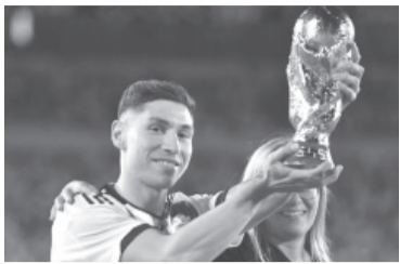
Gonzalo Montiel, jugador de la Selección.