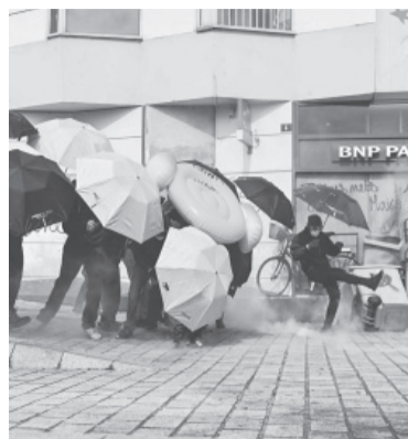
Días de disturbio en París.