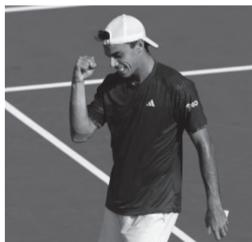
Gran momento del argentino.

El máximo favorito del cuadro masculino es el español Carlos Alcaraz (1), quien venció sucesivamente al argentino Facundo Bagnis (100)