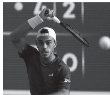
"Fran" no pudo repetir las semis de 2022. - ATP -

En caso de avanzar a semifinales, el español de 19 años se encontrará con el italiano Jannik