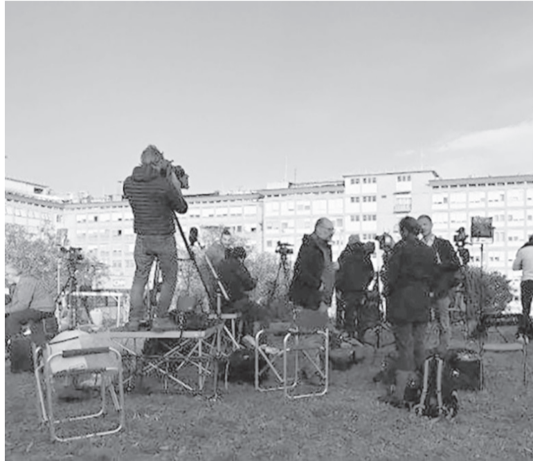
Preocupación. Guardia periodística en el hospital Gemelli de la capital italiana.