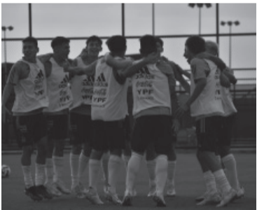
Los chicos albicelestes, felices.

El seleccionado argentino sub 17 debutará hoy contra Venezuela en el torneo Sud-