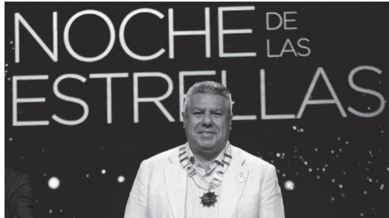
Jugada maestra. La "albiceleste" no logró clasificarse pero gracias a la gestión de Tapia participaría como organizadora. - AFA -

potenciales candidatos son Perú y Qatar, que viene de organizar el Mundial de mayores en el 2022, ya que ambos países, al igual que Argentina, cuentan con la infraestructura para organizarlo.