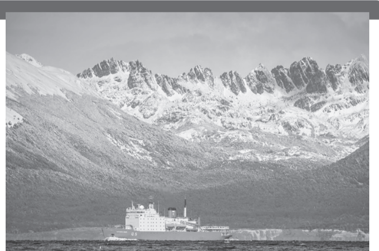
El rompehielos "Almirante Irizar" cruzó el temido Pasaje de Drake en cuyas turbulentas aguas se encuentran el Atlántico y el Pacífico, para adentrarse en aguas antárticas con destino a la base Esperanza, en la que tuvo ayer la primera escala de la última etapa de la Campaña Antártica de Verano 2022-2023.