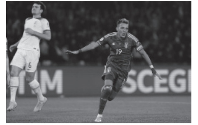
El delantero marcó dos goles para la "Azzurro". - Italia -