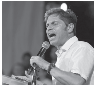
El Gobernador apuntó contra la Corte Suprema. - DIB -