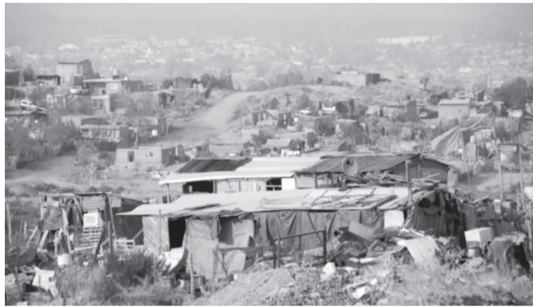
Indec. Presentó los índices de pobreza e indigencia del segundo semestre de 2022.

Desde septiembre del año pasado, las canastas Básica Total (CBT) y Alimentaria (CBA) –los pisos de la pobreza e indigencia, respectivamente– crecen por encima del índice de precios al consumidor (IPC), lo que –explican los analistas en la materia– empuja el índice de pobreza hacia arriba. De hecho, tanto la CBT como la CBA llegaron un mes antes que el IPC