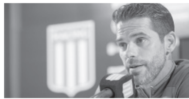
El DT "Académico".