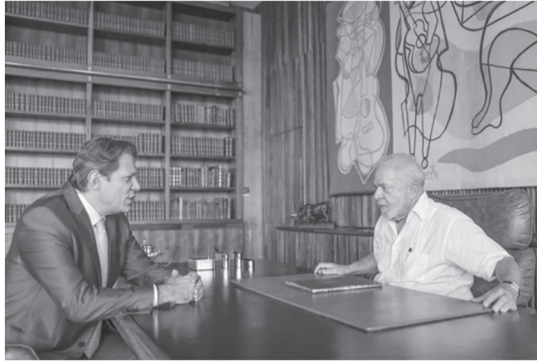
Lula. Su gobierno busca "no afectar salud y educación", aseguraron.

"Esta reforma no es una bala de plata que resuelve todo, es el comienzo de un camino, un plan de vuelo para saber cómo enfrentar los problemas de la economía