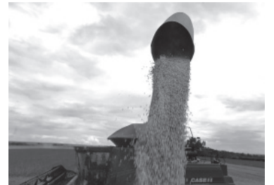
La medida fue anunciada por el sindicato Urgara. - DIB -