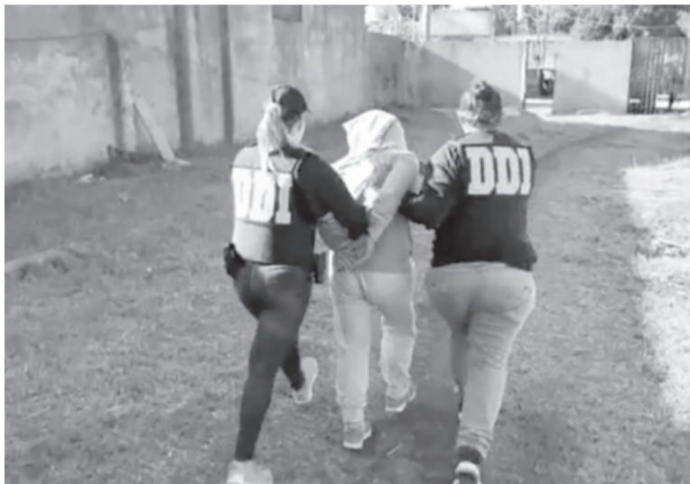
Sospechosos. Fueron detenidos una mujer de 37 años y su propio hijo de 23. - La Capital -

La autopsia confirmó que el anciano presentaba lesiones internas producidas por fuertes traumatismos, incluidas las fracturas de seis costillas, y por eso se dispuso que se investigara un posible asesinato. Así fue cómo se le entregó la pesquisa al Gabinete de Homicidios de la DDI que realizó un relevamiento vecinal para conocer algo más de