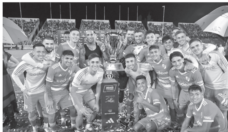
Los de Núñez jugaron un amistoso el sábado.