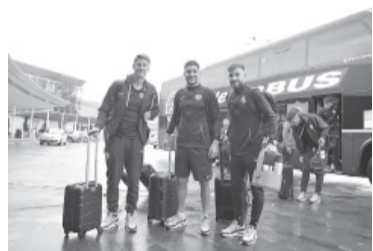
El "Ciclón" se presenta en Mérida. - San Lorenzo -

River comenzará hoy su camino en la Copa Libertadores en la altura de La Paz contra The Strongest, en el marco del Grupo D del máximo torneo del fútbol sudamericano.