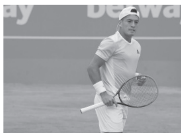
El tenista bonaerense es el campeón defensor.