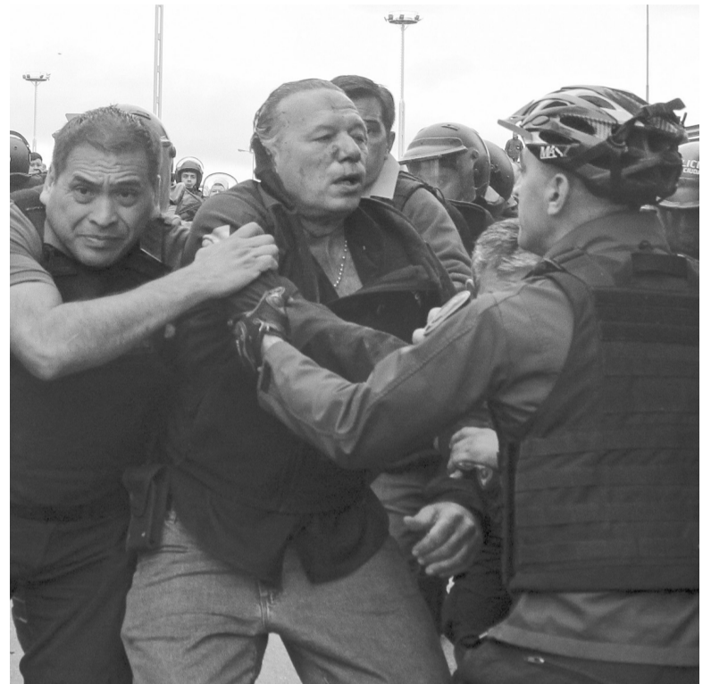
Desalojado. Policía de la Ciudad sacó al ministro de la zona de los hechos.