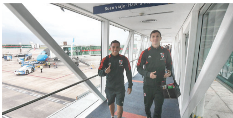
- River -