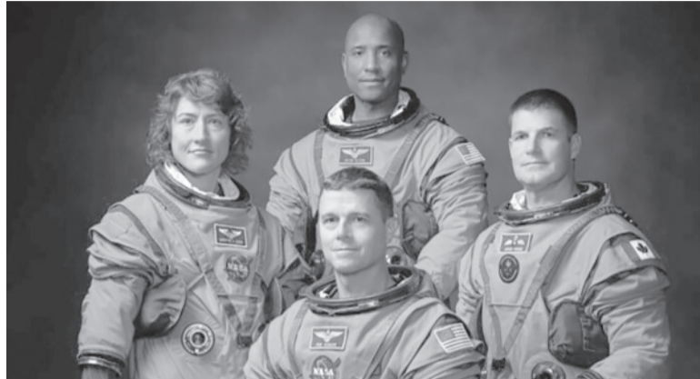
Elegidos. Los 4 que despegarán en noviembre del 2024.

Wiseman, de 47 años, piloto de combate de la Marina de los Estados Unidos que anteriormente se desempeñó como astronauta jefe de la NASA, fue nombrado comandante de la misión Artemis