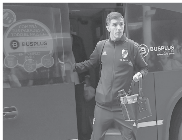
Viaje. El equipo partió ayer rumbo a Santa Cruz de la Sierra. - River -

Árbitro: Gustavo Tejera (Uruguay). Cancha: El Teniente (Rancagua). Hora: 19.00 (DirecTV).