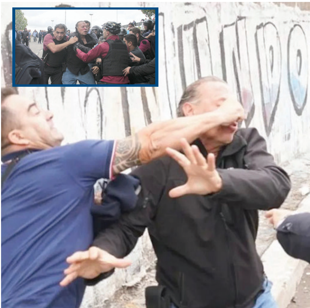
De sorpresa. El ministro de Seguridad bonaerense recibió golpes de puño y de elementos contundentes.

Colectiveros que se manifestaban en Lomas del Mirador por el asesinato del trabajador de la línea 620 agredieron al ministro de Seguridad. Por el homicidio hay un detenido. Provincia anunció un centro de monitoreo para trabajar con las cámaras de seguridad que deben funcionar en las unidades. - Pág. 3 -