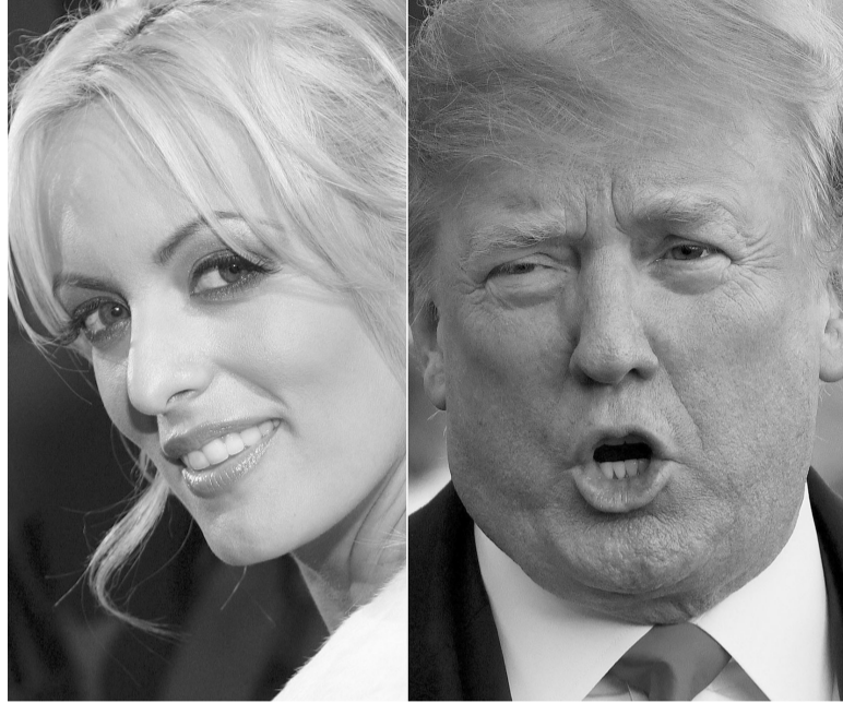
Polémica. La actriz Stormy Daniels y Donald Trump.

El líder republicano afronta este panorama luego de que un gran jurado de Nueva York resolviera acusarlo formalmente