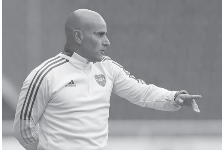
Apuntado. El hecho habría ocurrido dentro de la institución.

Esa norma "contempla todos los hechos de violencia en razón de género que se produzcan dentro