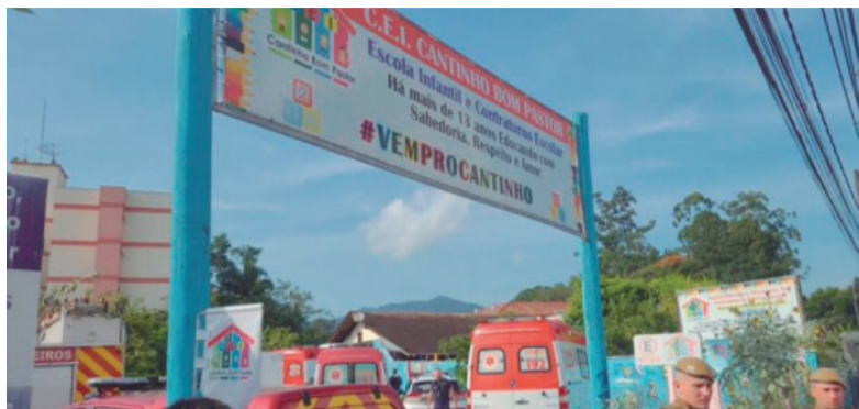
- Télam -