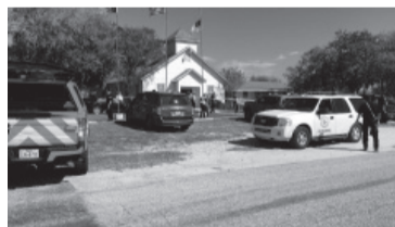
Para la Justicia, el Estado fue negligente.

La ley federal estadounidense prohíbe que las personas condenadas por violencia doméstica