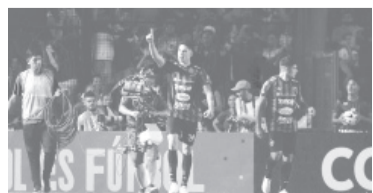
El "Patrón" estuvo cerca.

Árbitro: Franklin Congo (Ecuador). Cancha: R. "Tahuichi" Aguilera Costas.