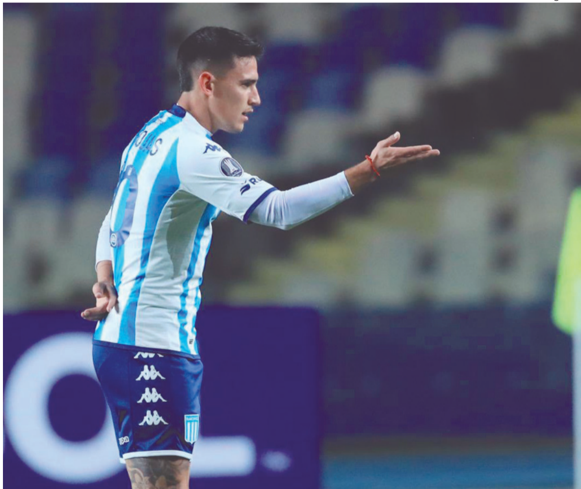
- Racing Club -

El ministro dio a conocer tres medidas para "fortalecer" al sector agroexportador y a las reservas. El tipo de cambio fijo especial regirá entre el 8 de abril y el 31 de mayo. Se sumarán las economías regionales hasta el 30 de agosto. - Pág. 2 -