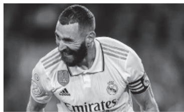
Triplete del "Gato". - RMFC -

Por su lado, los "culés" se quedaron afuera de manera temprana