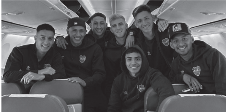
Buen ánimo. La salida de Ibarra y el posterior triunfo descomprimieron el clima enrarecido en el plantel. - CABI -

El Grupo F comenzaba anoche -al cierre de esta edición- en Colombia con el partido que animaban el local Deportivo Pereira y Colo