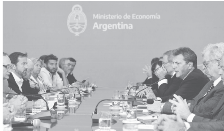
En el centro. El ministro Sergio Massa, a la cabeza del anuncio.

Massa explicó que las economías regionales "son uno de los mayores empleadores de la eco-