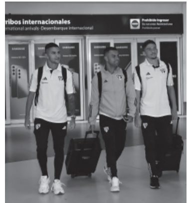
La llegada visitante a Ezeiza.