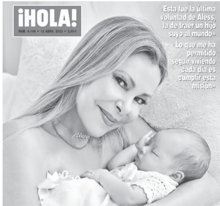
La revelación. La portada de la revista “Hola”.

Las otras dos misiones que le dejó su hijo fueron crear una fundación para la investigación contra el cáncer y publicar un libro, “El chico de las musarañas”, que saldrá a la venta en pocos días. El anuncio,