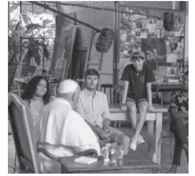
Imagen del documental transmitido por Star+. - Captura -