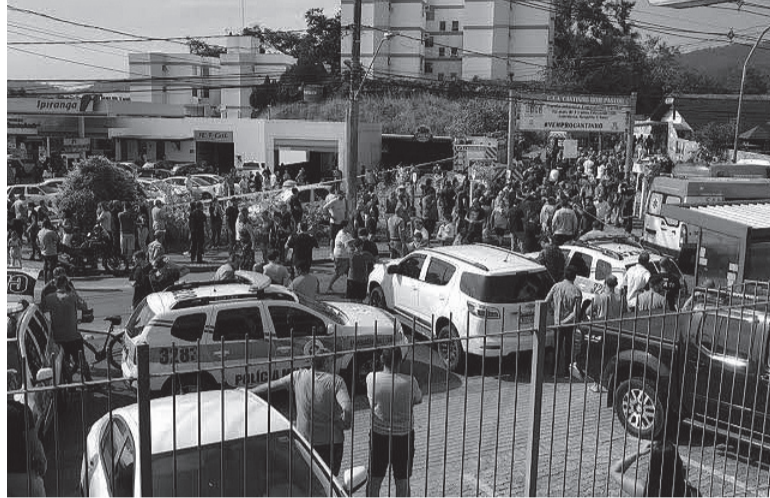
Desastre. La cruenta matanza dejó además otros cinco chicos heridos en la localidad sureña de Blumenau.

El caso pone a Brasil en el mapa mundial de las masacres en escuelas. Especialistas alertaron sobre el efecto repetición que se produce entre los homicidas con estos casos.