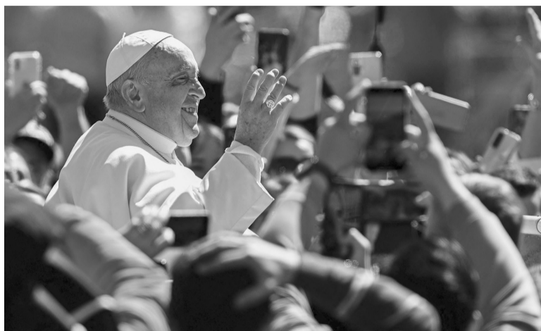
Saludable. El Papa brindó ayer la bendición Urbi et Orbi.

El pedido del pontífice se da luego de que la policía israelí irrumpiera el miércoles en una mezquita para desalojar violentamente a los fieles musulmanes e iniciara una nueva espiral de violencia en la región, por la que el sábado se registraron ataques en Tel Aviv y Cisjordania que dejaron al menos tres muertos