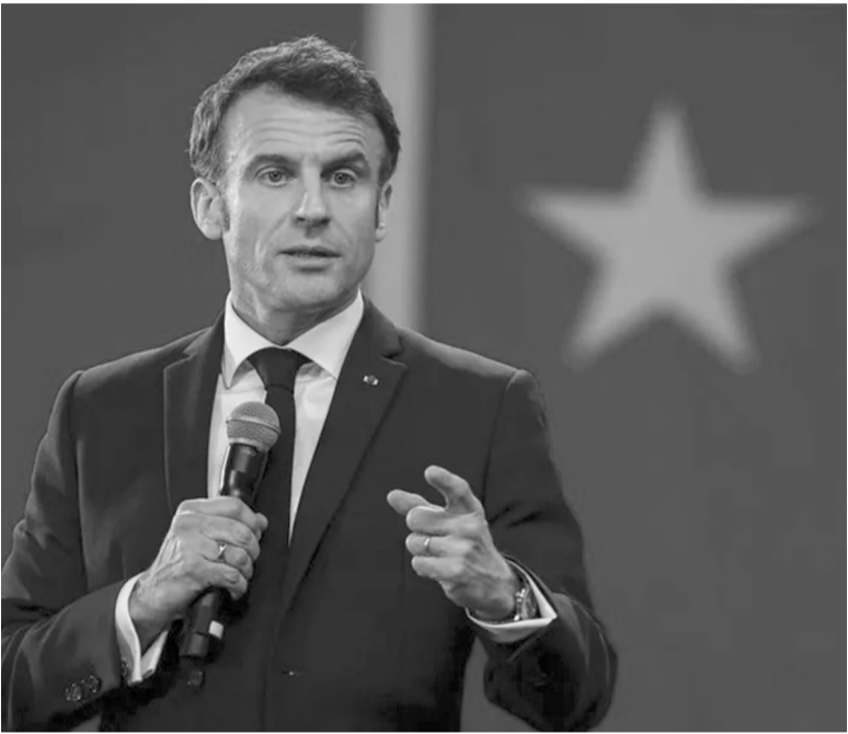
De gira. El presidente de Francia, Emmanuel Macron. - Les Echos -

Con respecto a lo conversado con el mandatario chino, Macron señaló que Xi Jinping habló sobre “la arquitectura de seguridad europea” pero que esta no puede existir “mientras en Europa haya países invadidos o conflictos congelados”. Según el presidente, “el conflicto ucraniano aumenta la