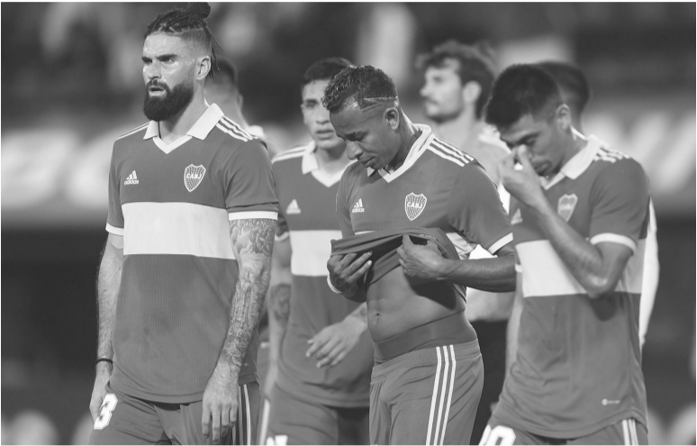
Preocupante. El conjunto de la Ribera quedó a 10 de River.

Apenas una definición pifiada de Merentiel y un remate de Medina a las manos del arquero Chicco fueron