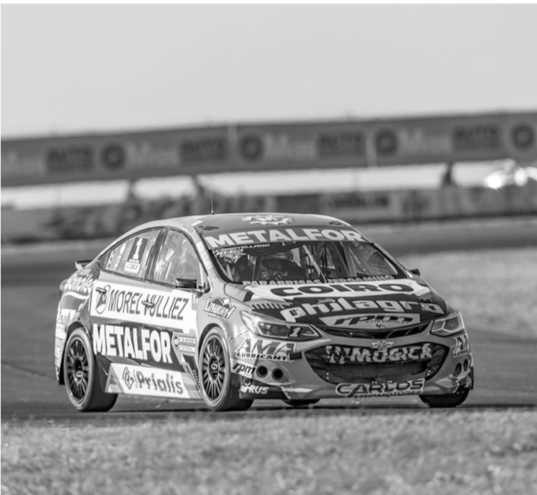
Sólido. El piloto de Lobería ganó con una cómoda ventaja.

El oriundo de Del Viso, que obtuvo su decimoquinto triunfo en la divisional, aprovechó un incidente en la largada en el que se retrasaron tres vehículos en busca del liderazgo y ganó en forma contundente.