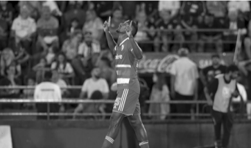
Salomón Rondón.