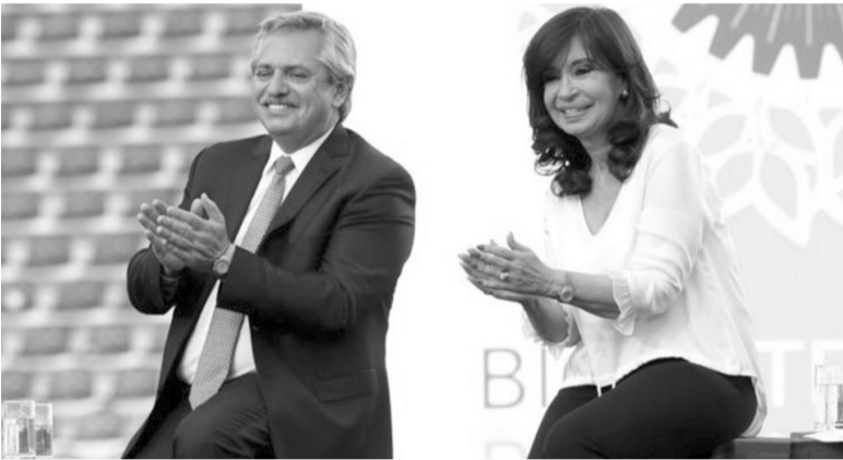
En defensa. El Presidente contra los “discursos llenos de odio y las palabras que maltratan”.

El presidente Alberto Fernández salió en defensa de la vicepresidenta Cristina Fernández y su hija Florencia ante los “discursos llenos de odio y las palabras que maltratan” y “lastiman” a ambas, y pidió que “no se abran las puertas a quienes propagan odio predicando infamias para desalentar y dañar los espíritus”. El Presidente se refirió así en un mensaje de Pascua en Twitter a las expresiones de las periodistas Viviana Canosa y Laura Di Marco, en el canal LN+, quienes hablaron de una supuesta enfermedad de Florencia Kirchner y una presunta responsabilidad al respecto de su madre. “Hoy es un día de reflexión para la humanidad. La Pascua es oportuna para repensar lo vivido y animarnos a construir un futuro distinto. Unidos en el amor por el prójimo y respetándonos en la diversidad”, sostuvo Fernández. El mandatario advirtió: “Digo esto cuando se oyen discursos llenos de odio que descalifican a una mujer en su condición de madre solo por diferencias políticas”, aludiendo a la vicepresidenta. “Palabras que maltratan a una joven a la que una y otra vez suben al escenario público solo para estigmatizarla y lastimar