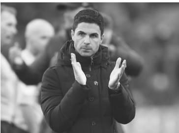
El equipo de Arteta no logró sostener un 2-0. - Arsenal -

jugar para ponerse al día, el conjunto “ciudadano” aún tiene que recibir en su estadio al Arsenal.