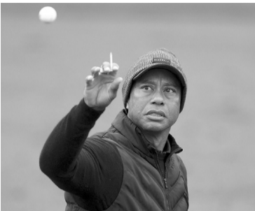
El golfista estadounidense abandonó la competencia por una lesión.