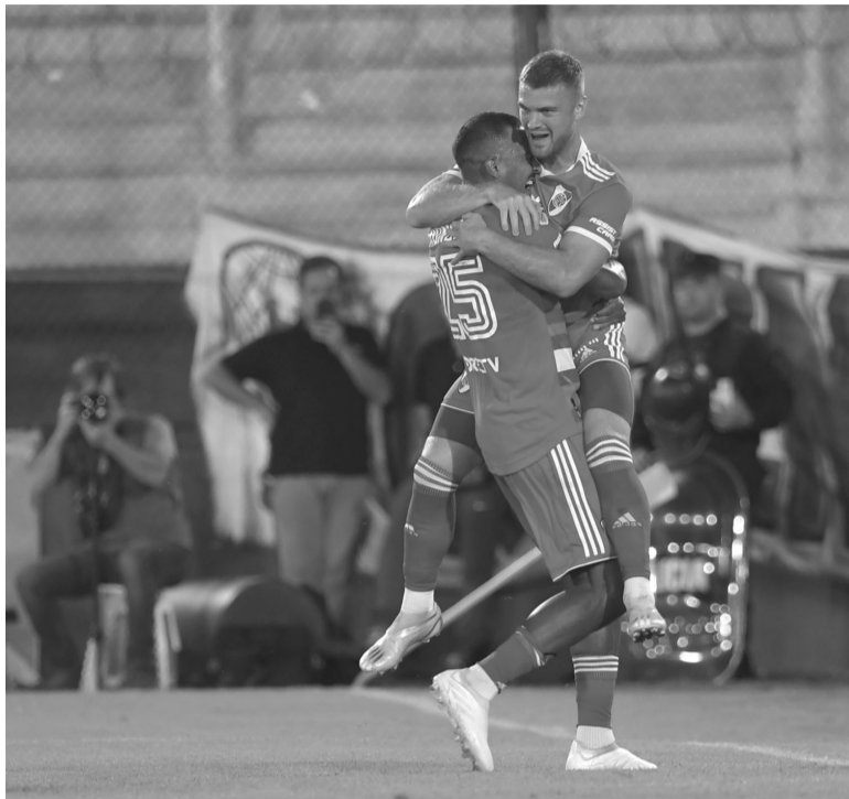
Afilado. Quinta victoria seguida para el líder de la Liga Profesional.

Si Huracán tenía alguna esperanza de revertir la historia, le