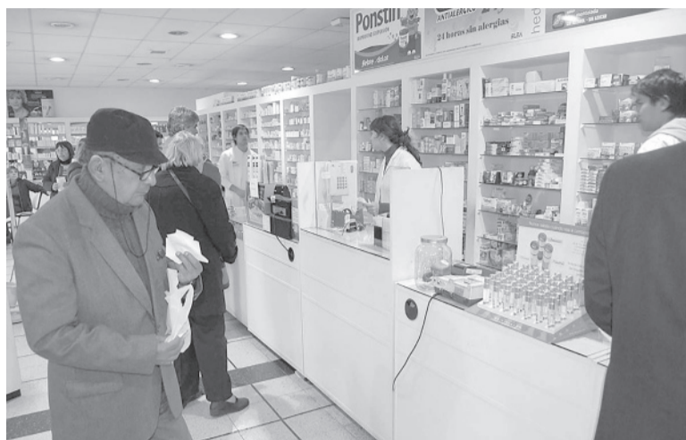
Farmacias. La medida es respaldada por las facultades de Ciencias Veterinarias nacionales.

El decreto, emitido el pasado 4 de abril de este año, sustituye el