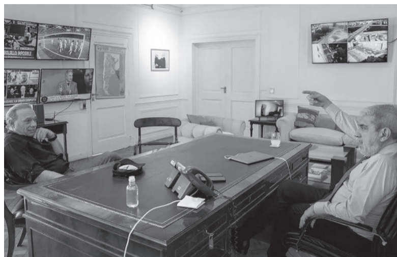
El crimen del colectivo modificó la agenda. - DIB -

“Hay una fuerte decisión de apoyar con recursos”, dijo ministro bonaerense.