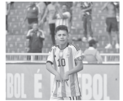
Echeverri y otro golazo.