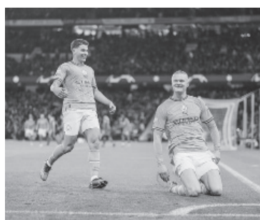
Álvarez y Halaand, los mimados de Guardiola. - City -

Los encuentros de ida de la Champions se completarán hoy con