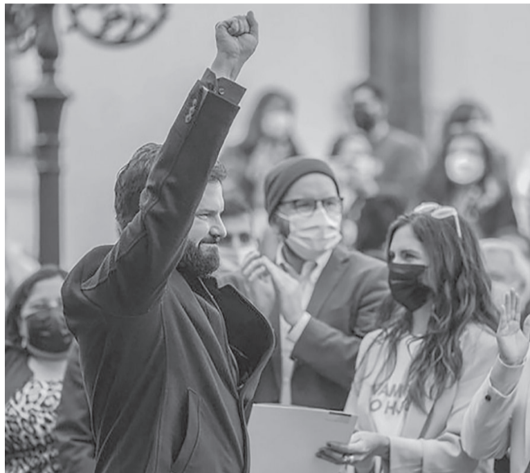
Celebración. El proyecto es considerado uno de los más emblemáticos del gobierno de Boric. - Twitter: @GabrielBoric -

rante el paso por esa Cámara se incorporaron algunas enmiendas, entre las que destaca su aplicación gradual (1-2-2), como también la jornada laboral de cuatro días, también conocido como 4x3, donde los trabajadores tienen la posibilidad de establecer una distribución de jornada de cuatro días trabajados por tres de descanso. - Télam -