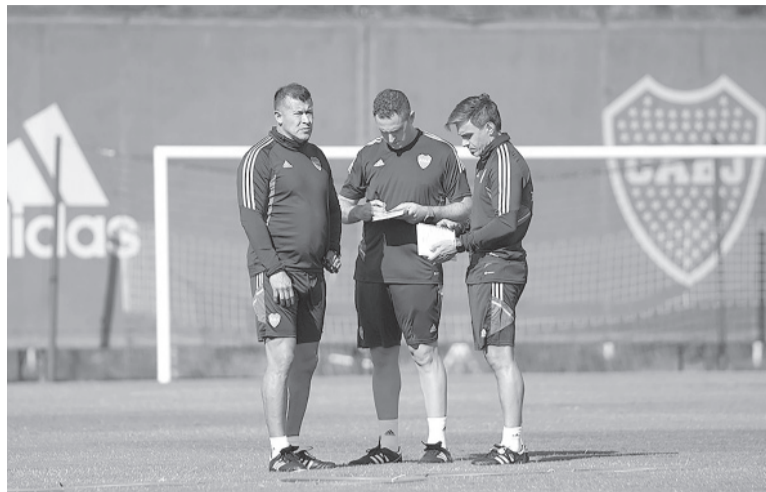
Estreno. Campeón con Lanús, Almirón tuvo un paso poco exitoso por San Lorenzo e Independiente.

Árbitro: Fernando Espinoza. Cancha: Presidente Perón. Hora: 19.30 [ESPN Premium].