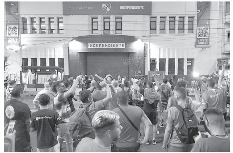
Reclamo. Un grupo de hinchas se apersonó en la sede del club para pedir la salida de toda la CD.

“La profundidad (de la crisis) es tan grande que no alcanza con un solo espacio político o un grupo de voluntades. En estos seis meses de gestión hemos logrado muchos aciertos, pero también cometido errores, en el plano económico y en el deportivo. Logramos el objetivo que parecía imposible: sacar a Hugo Moyano y a Yoyo Maldonado del club”, dice Doman en su carta. “En el plano deportivo siem-