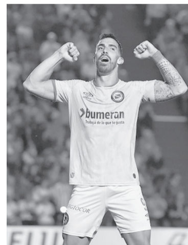
El paraguayo marcó tres tantos.