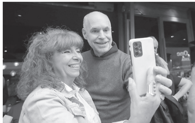
Campaña. Junto a una vecina en el Conurbano.

Asimismo, remarcó que la única decisión que tomó en las últimas horas fue “cumplir con la ley”, y en ese sentido agregó que “es la forma más transparente de votar”. También, garantizó la unidad del partido. “No participo de discusiones internas, puede haber diferencias, pero la unidad del PRO y de Juntos por el Cambio está más garantizada que