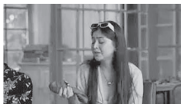
El pañuelo verde es símbolo de la lucha por la legalización del aborto. - Captura -

La joven viajó para encontrarse con Francisco y con quienes, sin conocerse previamente, llegaron a Roma para el encuentro con el Sumo Pontífice.