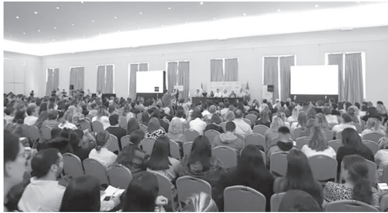
En reunión. Apertura del Congreso Provincial de Salud en el NH Gran Hotel Provincial. - Ministerio de Salud de Buenos Aires -

“El Estado provincial entiende que la salud es responsabilidad de nuestro Ministerio, y más allá de que si las personas tienen obra social, prepaga, o se atienden en un hospital