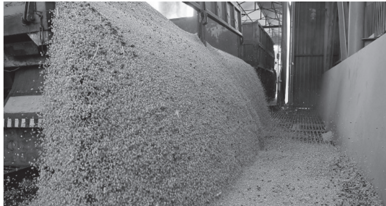
Alivio. Tras el Programa de Incremento Exportador.

Los agroexportadores realizaron ayer las primeras liquidaciones de divisas en el marco del Programa de Incremento Exportador (PIE), que comenzó el lunes, e ingresó durante la jornada casi US$ 94 millones. En base a los números registrado en el Mercado Abierto Electrónico (MAE), ayer se liquidaron US$ 93.968.026 bajo el esquema de cambio diferencial de $300 por dólar que establece el PIE hasta el 31 de mayo para el complejo sojero. El plazo se extiende hasta el 31 de agosto para algunas producciones de las economías regionales, aunque en este caso todavía no están definidas cuáles podrán acceder a dicho beneficio. El ingreso de estos dólares el Mercado Único y Libre de Cambios (MULC) permitió por segunda jornada consecutiva al Banco Central finalizar la sesión con saldo positivo. Así, ayer la autoridad monetaria pudo sumar US$ 2 millones durante la operatoria, tras otros US$ 2 millones adquiridos ayer, tras 23 jornadas consecutivas finalizando con saldo negativo. No obstante las primeras liquidaciones registradas, el mercado de granos continúa con poca actividad, en especial, si se lo compara con ediciones anteriores del PIE. Según el monitor SIO-Granos, plataforma que registra el volumen comercializado en el mercado granario, pasada las 18 sólo se