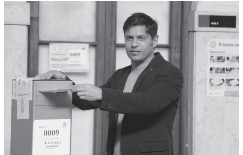
Funcionario. Votación en La Plata en las elecciones pasadas.

ir a una segunda vuelta con esta expresión más liberal, más rupturista, más de enojo", dijo hoy Macri al participar en la Rural de un almuerzo organizado por el Consejo Interamericano del Comercio y la Producción (Cicyp). Macri sostuvo que "va a ser un desafío para el candidato nuestro que gane la interna" demostrar la "experiencia" y el "valor del conocimiento" contra la propuesta "rupturista y de cambio que tiene Javier Milei". "El coraje tiene que estar puesto en enfrentar el statu quo", sostuvo. El expresidente dijo