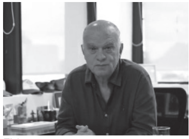
El funcionario se tomó un mes.