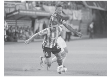
Sin goles en UNO.