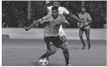
Triunfo "pirata" en Alberdi, 2-0.