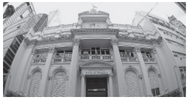
La sede de la entidad.