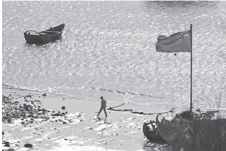
Conflicto. Hace más de 60 años entre China y Taiwán.

Como respuesta, el ejército chino organizó sus ejercicios militares, que incluyeron el despliegue de buques de guerra y de aviones cazas. Los comentarios de Xi Jinping fueron los primeros hechos en público tras esas maniobras. El acercamiento de los últimos años entre Taiwán