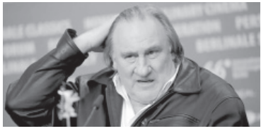
El actor francés Gerard Depardieu.