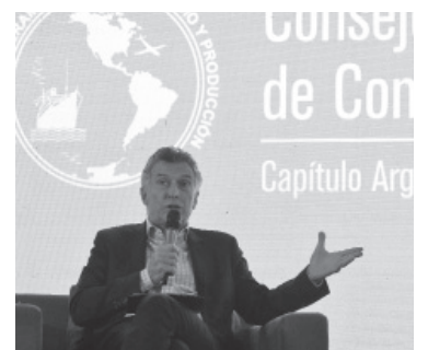
Macri ayer en exposición.

en su partido dirigentes de larga data, nada nuevo, como "una ministra de (Antonio) De la Rúa que bajó los salarios 13% (por Patricia Bullrich) y un interventor del PAMI de De la Rúa (Horacio Rodríguez Larreta)".