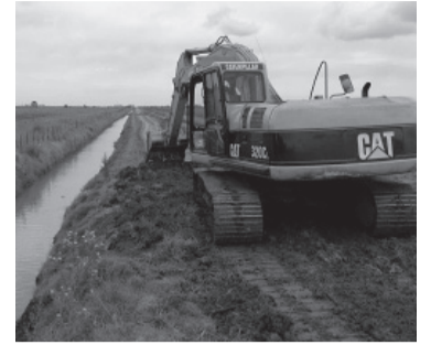
Mejoras en distintos puntos de la Provincia.