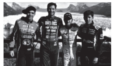
Primera vez en el paraíso patagónico. - ACTC -

ron a la Patagonia para hacer rugir los motores: 47 competirán por el TC y otros 35 por la división telonera, el TC Pista. Las entradas para la histórica competencia tendrán un costo de 3.000 pesos (populares) y 10.000 (plateas preferenciales).