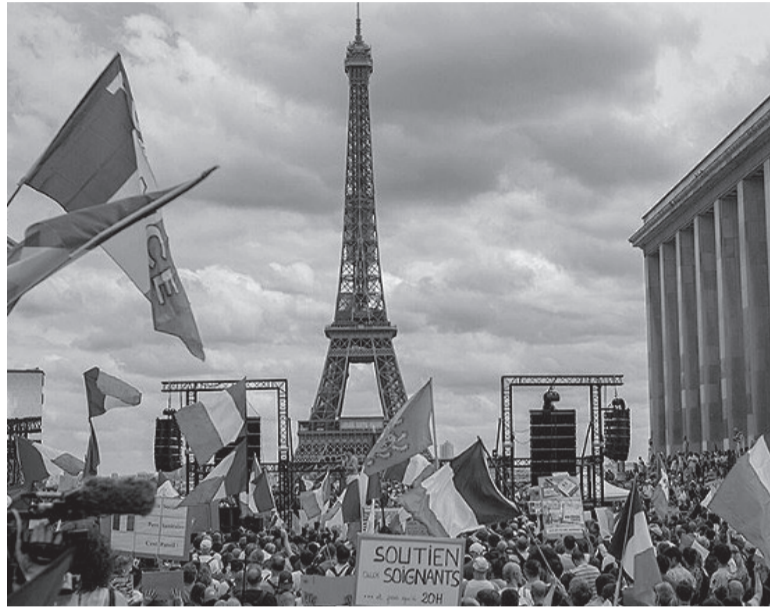
Reclamo. Se espera gran protesta para el 1 de mayo.

Del lado de los sindicatos, sus líderes convocaron a una "movilización excepcional" para el 1º de mayo, Día Internacional de los Trabajadores, y advirtieron que no se reunirán ni con Macron ni con el gobierno antes de esa fecha. Unas horas antes de conocerse la decisión, el mandatario propuso a los gremios una reunión el próximo martes, como "el inicio de un ciclo (...) que continuará las próximas semanas". Las centrales son la punta de lanza desde el inicio de las protestas en enero: el 7 de marzo lograron movilizar entre 1,2 y 3,5 millones de personas, según las autoridades y la Confederación General del Trabajo (CGT), respectivamente, pero las marchas