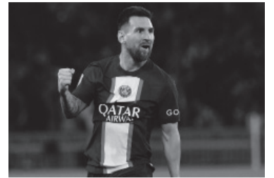
Pese a las críticas, el astro fue vital en los últimos triunfos. - Télam -

En primer turno, Rennes recibirá a Reims desde las 12, hora argentina.