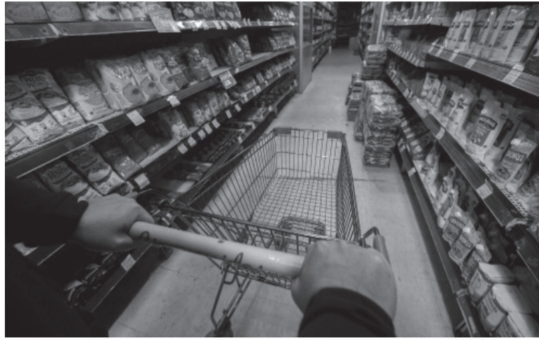
Aumento. Los precios siguen para arriba.

En la primera semana de abril, en el cálculo de C&T, los alimentos y bebidas subieron 4,4%, con fuerte aumento de verduras, pero también carnes y panificados. El IPC total de la primera semana contra la primera de marzo les dio 7,4%.