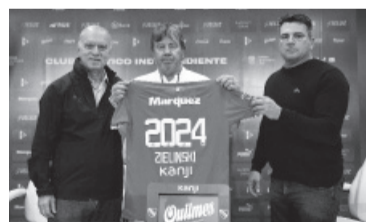
Grindetti y Cavallero junto al nuevo DT.

Independiente ganó solo un partido en el campeonato, suma nueve puntos después de 11 juegos en la Liga Profesional y está cerca del descenso por la tabla general.