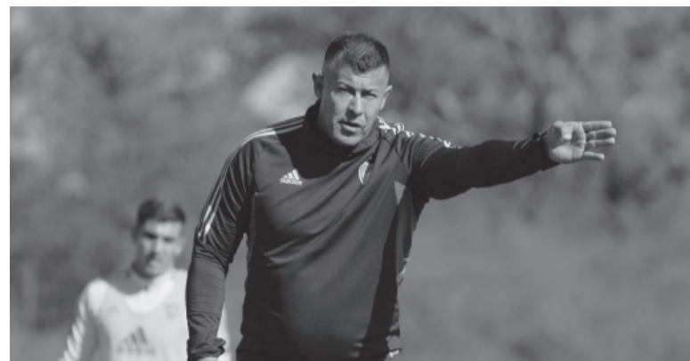
Obligado. La derrota ante San Lorenzo le metió presión al local frente a un "Pincha" que solo ganó 9 veces en La Boca. - CABI -

Árbitro: Nicolás Ramírez. Cancha: Juan Carmelo Zerillo. Hora: 21.30 (ESPN Premium, ESPN 2 y TV Pública).