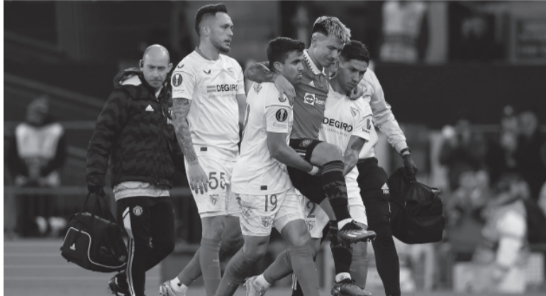
Lesión. El “Licha” escoltado por sus compañeros el jueves. No estará en la próxima fecha FIFA.

Martínez se lesionó sobre el final del partido que el United em-