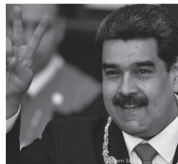
El Presidente reconoció la década pese al bloqueo inglés.

largo de los años le han impuesto a Venezuela, entre ellas el bloqueo en el Banco de Inglaterra de US$ 31 millones en lingotes de oro que Londres se negó a liberar incluso en pandemia, cuando Caracas necesitaba fondos para combatir la propagación del coronavirus. Tanto el Reino Unido, como EEUU y medio centenar de países apoyaron durante tres años al opositor Juan Guaidó, quien en 2019 se autoproclamó presidente encargado en una plaza pública tras ganar unas elecciones legislativas en las que quedó al frente de la Asamblea Nacional (Parlamento). El Ministerio de Relaciones Exteriores también se refirió en un comunicado a las "duras batallas" que ha enfrentado Venezuela, de las que Maduro "ha salido victorioso junto al pueblo