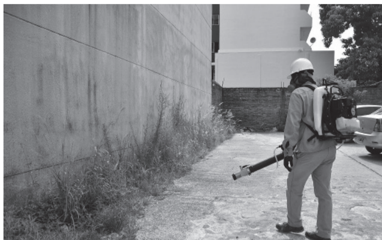
Dengue. Se notificaron 2.510 casos autóctonos en 24 municipios. - DIB -

Por otro lado, mencionó que toda la yerba mate que se produce y se descarta una vez consumida permitiría obtener excelentes "carbonos activados", para lo cual se la debe someter a un proceso de carbonización a elevadas temperaturas y "activarla" posteriormente con un agente químico. - Télam -