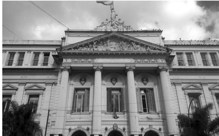
A cargo. La Facultad de Ciencias Económicas de la UBA.

La Facultad de Ciencias Económicas de la Universidad de Buenos Aires (UBA) concluyó que la operación de venta de los títulos en dólares del Fondo de Garantía de Sustentabilidad de la Anses, del PAMI y de más de 100 organismos alcanzados por el decreto de canje y su posterior suscripción del Bono Dual 2036 no implica una pérdida sino una revalorización patrimonial. En concreto, la Facultad le dio el visto bueno a la operación, más que nada porque solo fue consultada por los efectos en la valorización en pesos de las carteras de los organismos y no por algunas de las críticas