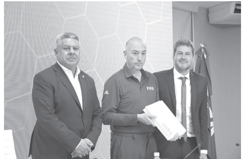
Oficial. La confirmación llegó en horas de la tarde y el representante de FIFA fue distinguido en Ezeiza.

firmadas como subseces Mendoza con su estadio Malvinas Argentinas, San Juan con el Estadio del Bicentenario, La Plata con el Diego Maradona y Santiago del Estero con el Único Madre de Ciudades. Estos dos últimos se repartirían el partido inaugural y la final.