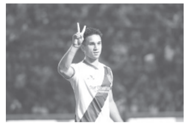
Desahogo banfileño.