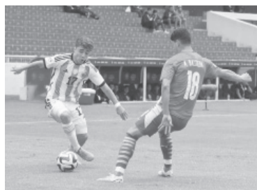
Empate sin goles.

Con el empate, Argentina quedó primera con 7 puntos, por encima de Ecuador y Brasil (6), que se enfrentarán hoy a las 21, hora de nuestro país.