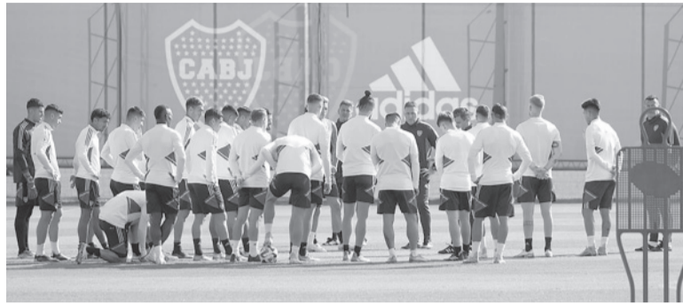
Golpe anímico. El conjunto azul y oro debe ganar para no poner en suspenso su clasificación. - CABI -

Árbitro: Andrés Matonte (Uruguay) Cancha: Alberto J. Armando. Hora: 21 (Fox Sports y Star+).