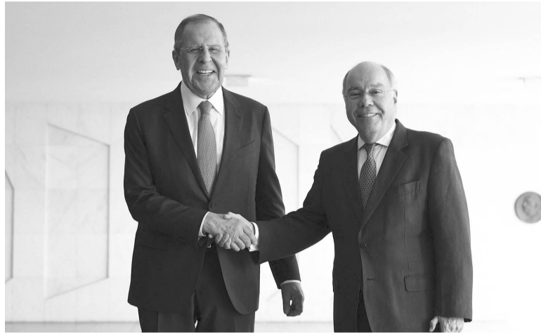
De visita. El canciller ruso Serguei Lavrov y su par brasileño Mauro Vieira. - AFP -

que Estados Unidos y Europa "necesitan comenzar a hablar sobre la paz". Durante una visita a Emiratos Árabes Unidos tras su paso por China, el fin de semana, también reiteró su opinión de que Ucrania comparte con Rusia la culpa de la guerra, algo que el país invadido rechaza con vehemencia. Rusia sostiene liderar una lucha contra el dominio de Estados Unidos en el escenario mundial, y argumenta que la ofensiva de Ucrania es parte de eso. - Télam -