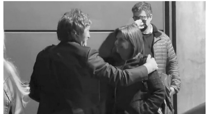
En carrera. Javier Milei y Patricia Bullrich, precandidatos.