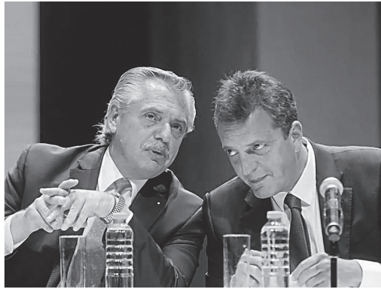
Espalda con espalda. El Presidente apoyó a Massa ante Aracre.

obligó al ente monetario que conduce Miguel Pesce a mantener una tasa de devaluación oficial del peso elevada (lo dejó trepar $0,54 en la jornada, contra los $0,44 promedio por día de la semana previa) y cercana al 98% anual -de mantenerse- sino principalmente porque lo obligó a vender US$197 millones de sus escasas reservas, aquellas que esperaba recuperar mediante el "dólar agro".