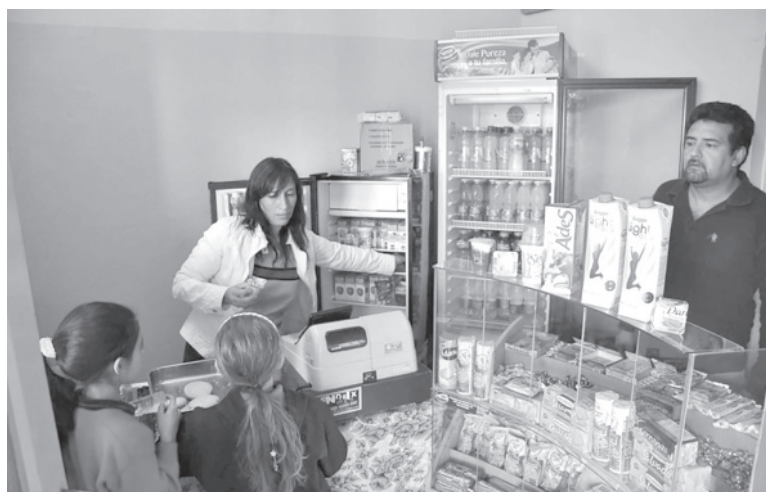
Informe. Un 88,3% de la mercadería comercializada presentaba al menos un nutriente crítico en exceso, edulcorantes o cafeína. - DIB -

El 41,2% de los kioscos presentaba además publicidad de