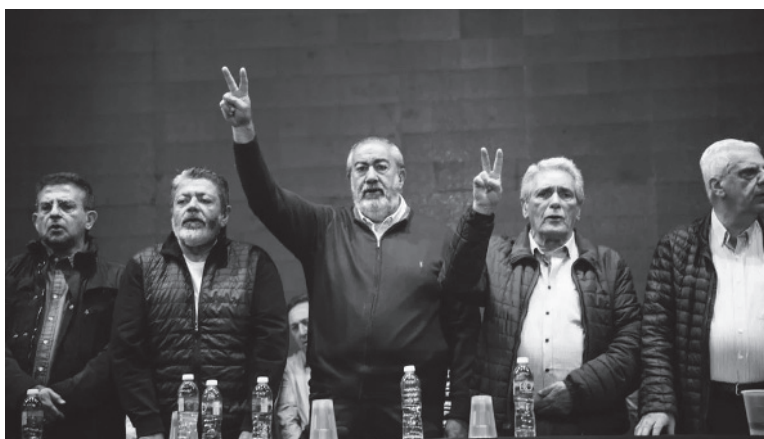
Plana mayor. La CGT, con los "gordos" a la cabeza, se endurece.

"La sociedad argentina atraviesa una compleja crisis económica y social, heredada y agravada por un escenario de inestabilidad macroeconómica que se manifiesta a través de una escalada inflacionaria creciente que pulveriza el poder adquisitivo de los salarios; escasez de divisas, informalidad laboral y un proceso de aumento en su pobreza