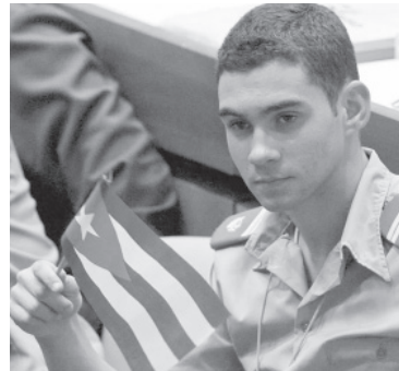
Elián González, ahora, con 29 años.

Así comenzó la mediática disputa legal por su custodia que enfrentó a sus familiares en Miami y a su padre, Juan Miguel González, en La Habana, además de tensar la relación entre Cuba y Estados Unidos. Finalmente, ambos países acordaron su devolución a Cuba, pero parientes de Elián, apoyados por militantes anticas-tristas, se negaron a cumplir la orden. La Policía ingresó a la casa de Miami donde estaba en abril de 2000, lo sacó por la fuerza y se lo entregó a su padre, que estaba en Estados Unidos y volvió con él a Cuba. Actual director comercial de una empresa pública, Elián fue elegido