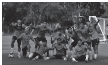
La alegría de los chicos argentinos. - Argentina -

Manchester United no quiere ceder al delantero argentino Alejandro Garnacho para el Mundial Sub 20, que se desarrollará desde el 20 de mayo al 11 de junio en el país tras