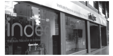
El Indec publicó el informe.