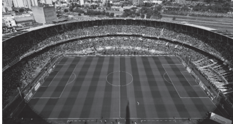
Noche copera. Se espera un buen marco en el Cilindro.

Árbitro: Christian Ferreyra (Uruguay). Cancha: Presidente Perón. Hora: 19 (Fox Sports).