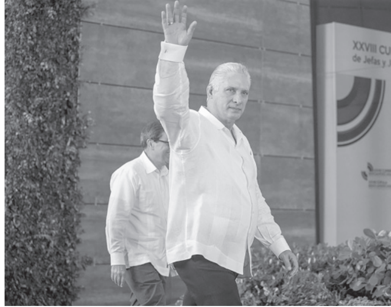
Desde 2018. Miguel Díaz Canel, elegido para un segundo mandato.