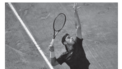
El porteño le ganó a Pessaro. - AAT -

El argentino, de 24 años, jugará su próximo partido ante el “top ten” noruego Casper