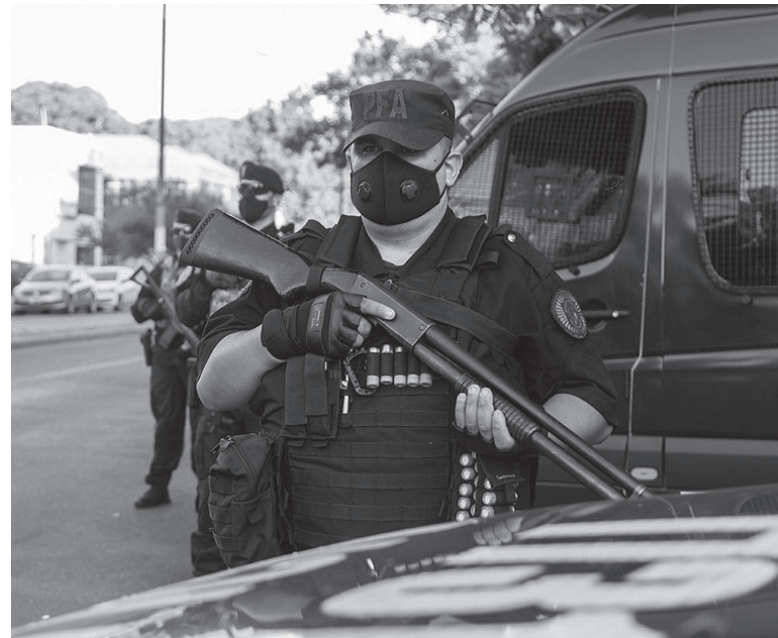
Datos. Conurbano, La Plata y Mar del Plata registraron el 86% del total de IPP iniciadas. - DIB -

Cabe mencionar también que de las 716 IPP relevadas de homicidios dolosos consumados, el 60,2% tuvo lugar en la vía pública seguido por un 29,3% de los casos ocurridos en viviendas. Asimismo, el 56,3% de los hechos fue cometido con arma de fuego. - DIB -