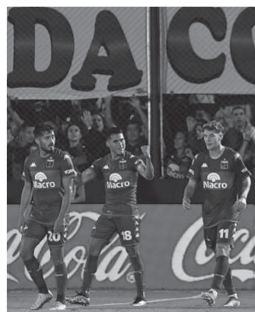
Armoa marc  el gol de los de Mart nez. - T lam -

■ Tigre le gan  anoche a Hurac n por 1-0, como local, en el cierre de la fecha 13 del torneo