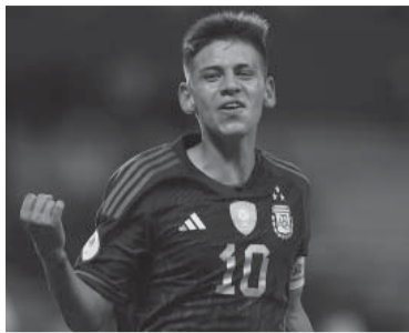
El "Diablito" recib  el llamado de Demichelis. - T lam -

Echeverri ya se entren  con el plantel de Primera en un par de ocasiones, pero luego de la gran actuaci n en el juvenil -donde fue