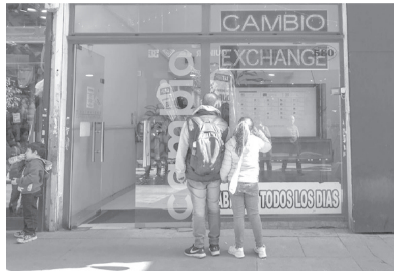
Cotizada. La divisa estadounidense, a la caza.

En el marco de la declaración conjunta que brindó en la Casa Rosada con su par de Rumania, Klaus Iohannis, Fernández ratificó a Miguel Pesce en el Banco Central y calificó como “una mentira” que funcionarios del Fondo Monetario Internacional (FMI) hayan informado que ese organismo no adelantará el desembolso previsto para el país en el segundo semestre. Ante una consulta en la conferencia de prensa conjunta, el Presidente afirmó: “Estamos viviendo una crisis global de magnitud que en la Argentina se potencia por el problema de la sequía que nos ha hecho mucho daño en la economía”.