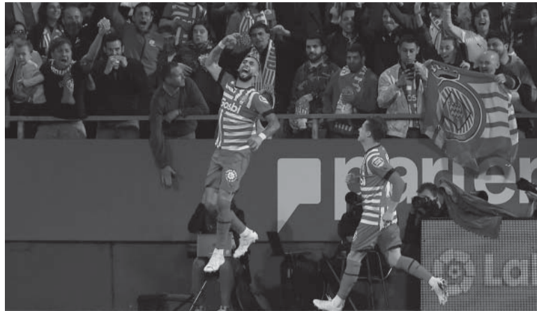
Revancha. El atacante venía de cerrar sus redes sociales tras ser criticado por un mal partido ante Barcelona.

Con el correr de los minutos y el resultado establecido, el entrenador de Girona, el español Miguel Ángel Sánchez, decidió sacarlo al