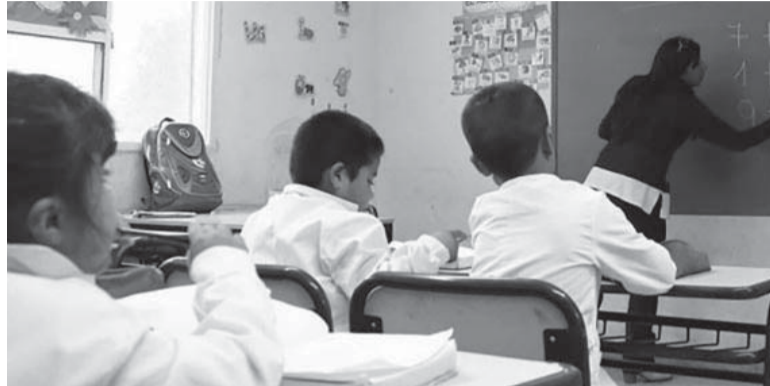
Programa. Unas 2.475 escuelas bonaerenses entraron al "Una Hora Más". - DIB -

En total, más de 10 mil escuelas de todo el país tendrán una hora más de clase por día o serán de jornada extendida o completa a partir de los convenios que la cartera educativa firmó con 21 provincias y la Ciudad de Buenos Aires. "En el Consejo Federal logramos construir un