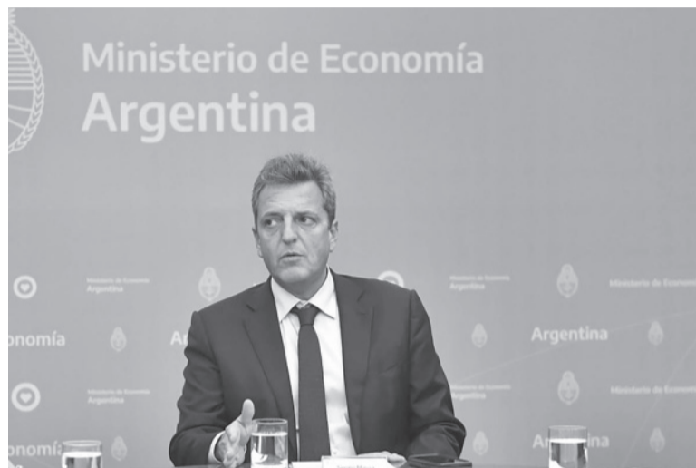
La cartera. La actualización fue anunciada por Economía.

A partir del nuevo esquema, anunciado ayer al mediodía por el Palacio de Hacienda, "no corresponderá retención alguna del tributo cuando la remuneración