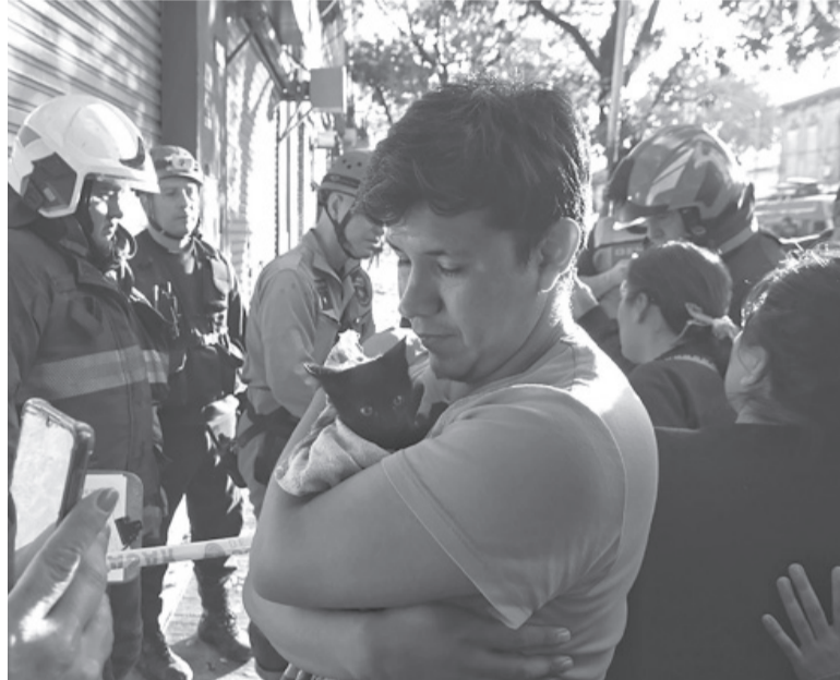
Derrumbe. Bomberos de la Policía Federal buscaban entre los escombros a al menos una persona desaparecida.

"Se realizó un rastreo con el equipo de perros especializado en búsqueda de personas vivas, y