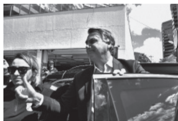
Jair Bolsonaro ante la Justicia.

El ultraderechista declaró en la Superintendencia de la Policía Federal de Brasilia por orden del juez Alexandre de Moraes, del Supremo Tribunal Federal, que encabeza la megacausa por los actos del 8 de enero, cuando miles de bolsonaristas que pedían al Ejército intervenir para derrocar a Lula invadieron el Palacio del Planalto, el Congreso y la sede de la Corte. Bolsonaro fue incluido en la investigación como supuesto autor intelectual, luego de haber publicado en Facebook, tras la intentona, un video en el cual se denunciaba como