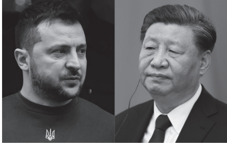
Comunicados. Volodimir Zelenski y su par chino Xi Jinping.

Zelenski dijo que la conversación con Xi había sido "larga y significativa", y su vocero señaló que duró casi una hora. Estados Unidos, que duda de la imparcialidad de China y la ve como favorable a Rusia, dijo que la llamada era po-