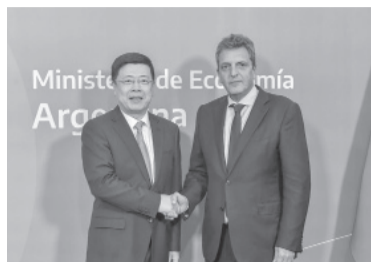
Massa con el embajador chino.

Massa, junto a su gabinete económico, recibió en Hacienda al em-