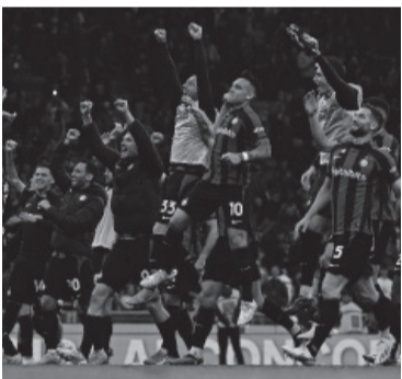
Lautaro fue titular y Correa ingresó al final. - Inter -

Inter, con los argentinos Lautaro Martínez y Joaquín Correa, le ganó como local a Juventus, donde actuaron sus compatriotas Ángel Di María