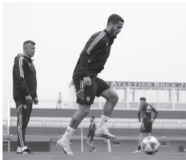
El DT duda en arriesgar a los que tienen 4 amarillas. - CABI -

El técnico estuvo siempre cerca de los jugadores y supervisó en