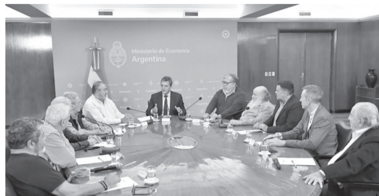
Mesa servida. Massa, con los gremios y las organizaciones sociales. - MEcon -

“inexplicable” que “haya intentos de aumentos de precios sobre la base de lo que fue el aumento del dólar blue desde la semana pasada, porque todos los que importan lo hacen con el dólar oficial”.