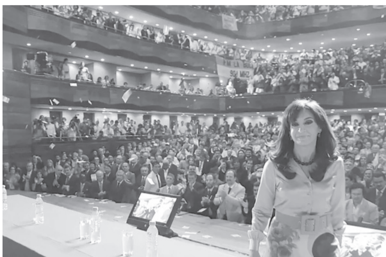
Antecedente. Cristina cuando lanzó su candidatura en 2017 en el TA.

Más allá de que la presentación de la ex presidenta tendrá lugar en momentos críticos de la renegociación de las metas del programa de refinanciación de la deuda que lleva adelante el ministro de Economía, Sergio Massa, se tratará de