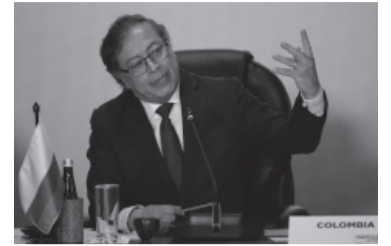
El presidente colombiano Gustavo Petro.