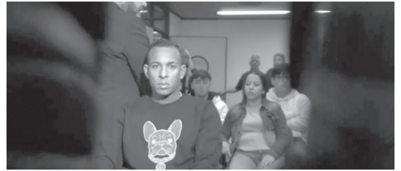
La Justicia autorizó al colombiano.

El colombiano recibió el visto bueno de la Justicia para cruzar la cordillera. También estará mañana ante Racing.