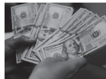
El dólar, en baja.

Las intervenciones oficiales que se vienen efectuando en el mercado de bonos no impactan directamente en el blue. Pero, aunque tiene su dinámica propia en la informalidad de las cuevas, con el pasar de los días la cotización