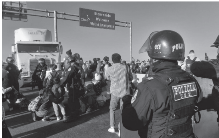
Alcance. La medida incluye restricción de derechos como el de libertad de tránsito y de reunión en los cruces limítrofes.

"Declarar por el término de 60 días calendario el Estado de Emergencia (...) para el restablecimiento del orden interno", señala la norma publicada en la gaceta oficial. Las Fuerzas Armadas apoyarán las tareas de la policía en el control interno, de acuerdo con la disposición. Según Boluarte, el estado de emergencia está encaminado a combatir la inseguridad. Apoyándose en informes de prensa, el miércoles sostuvo que "quienes cometen a diario asaltos, robos y demás actos delincuenciales son extranjeros". "Por eso tenemos (que) hablar casi al unísono de migraciones con inseguridad ciudadana", expresó.