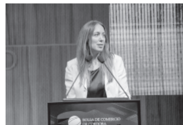
María Vidal.

A menos de dos meses del cierre de listas, los principales referentes del PRO se reunirán para dar señales de unidad en pleno armado de Juntos por el Cambio. El expresidente Mauricio Macri; el jefe de Gobierno porteño, Horacio Rodríguez Larreta; la titular en uso de licencia del espacio, Patricia Bullrich y la exgobernadora María Eugenia Vidal protagonizarán una cumbre que apunta a dar un mensaje de unidad y avanzar en la coordinación de las principales definiciones del espacio. Asistirán también los diputados Cristian Ritondo y Diego Santilli, aspirantes a la gobernación, y el titular del espacio, sucesor de Bullrich. - DIB -