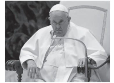
El papa Francisco.