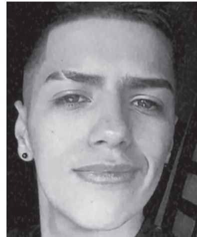
Investigación. Muerte de Lautaro Morello y desaparición de Lucas Escalante.

A su vez, fuentes del Ministerio de Seguridad bonaerense indicaron que el exjefe policial ahora imputado en este expediente ya fue "desafectado" de sus funciones.