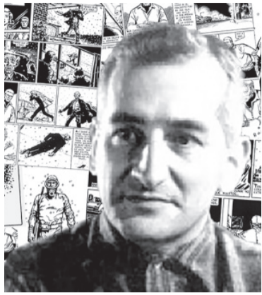
Héctor Germán Oesterheld.