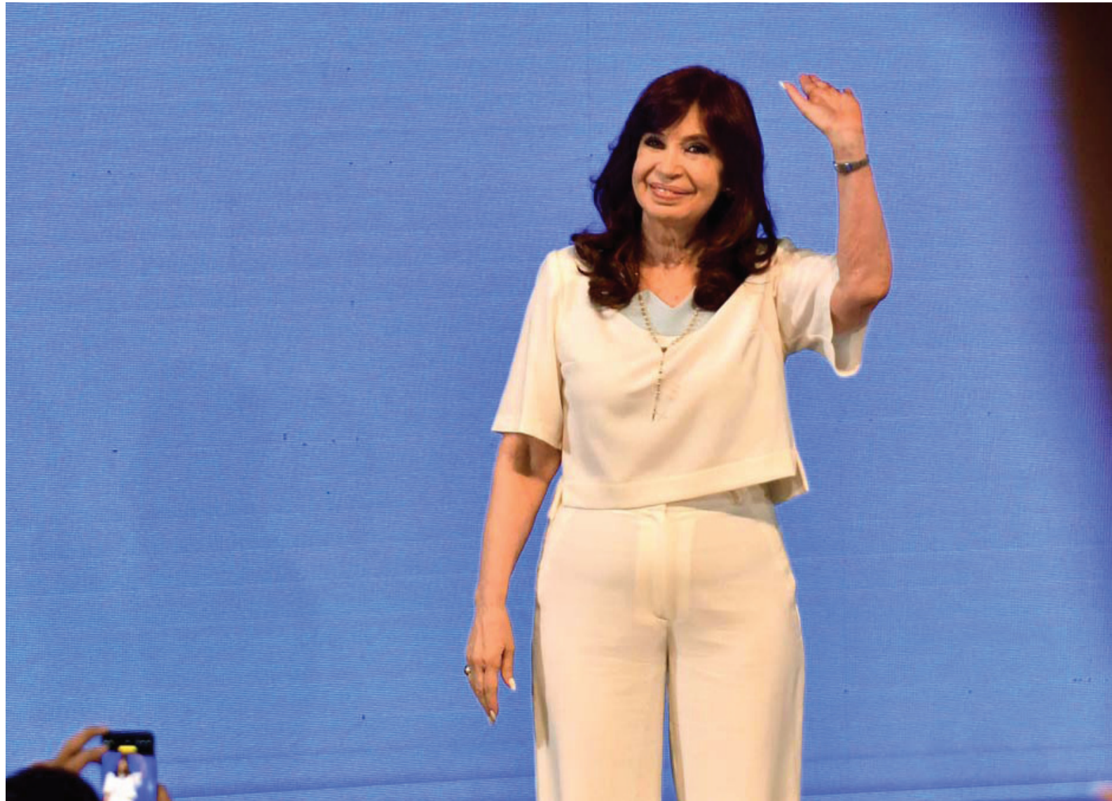
¿Una foto para empezar a despedirse? Cristina en La Plata: desalentó una candidatura.