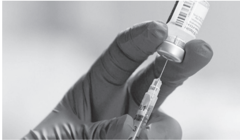
Aprobada. La vacuna contra el dengue fue desarrollada por el laboratorio japonés Takeda.

La Anmat autorizó el miércoles el uso de la vacuna contra el den-