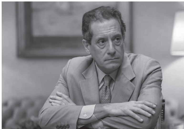
Otra vez. Pesce ordenó otra vez encarecer las tasas.

Y añadió: “El BCRA continuará monitoreando la evolución del nivel general de precios, la dinámica del mercado financiero y de cambios y de los agregados