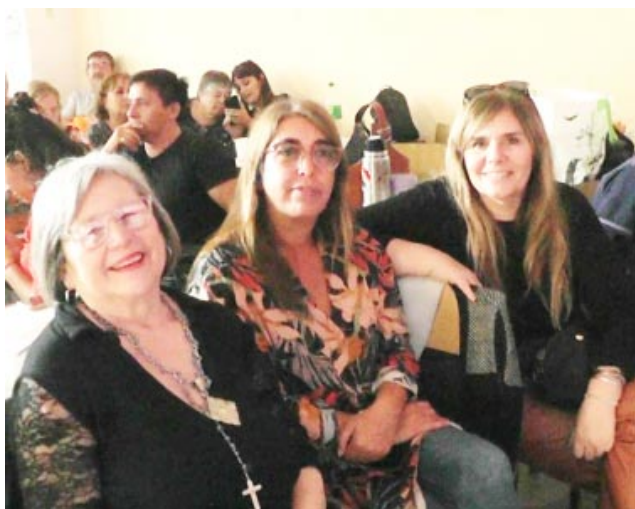
El espectáculo dio inicio a las 11 de la mañana, con la actuación de la peña anfitriona,

Participaron varias agrupaciones venidas de ciudades vecinas como 25 de Mayo, Salto, Rojas, etc.