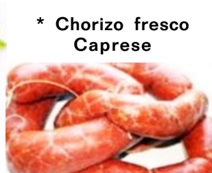
* Chorizo fresco Caprese