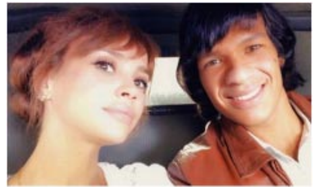
foto. En este pasaje de la película aparece con Celeste Cid a quien le tocó interpretar a Susana Giménez quien de algún modo cambió la vida del boxeador.