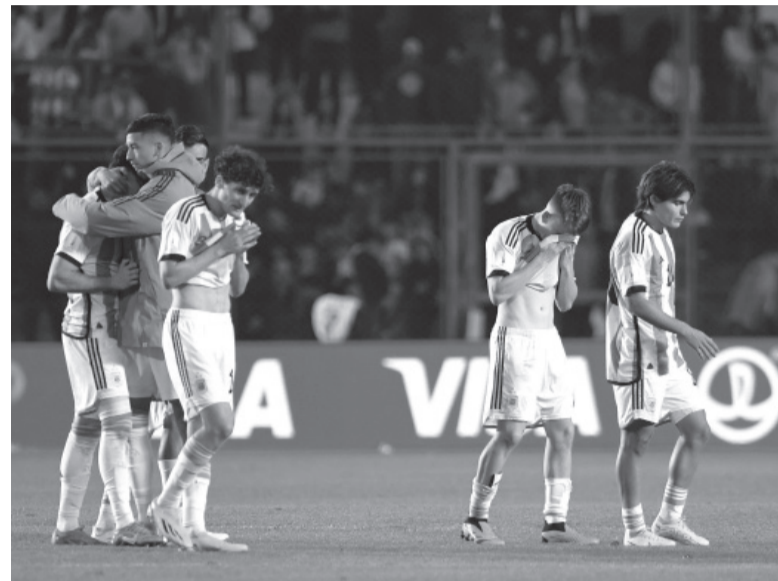
Tristeza. El sueño en casa se terminó muy rápido.

Inglaterra (2-1) en el duelo de potencias europeas.