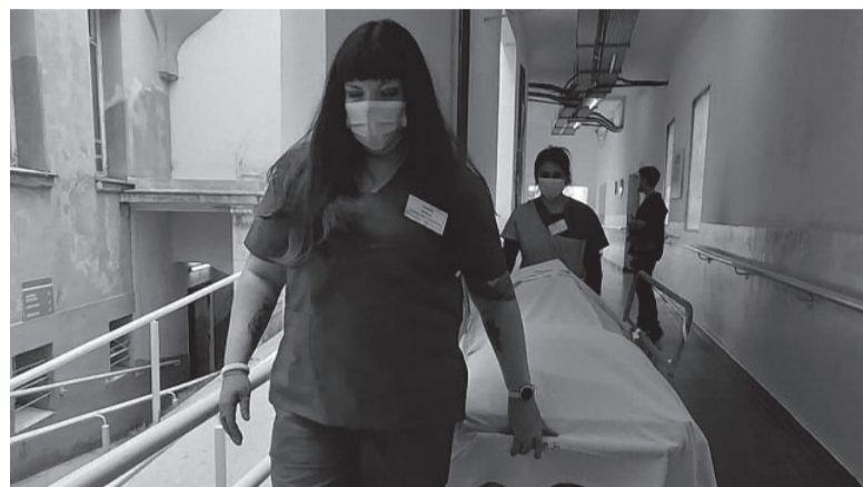
Designadas. Son nueve camilleras que se ocupan del traslado, el acompañamiento de pacientes y de sus familiares.