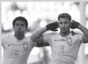
"La Canarinha" no tuvo piedad de Túnez.

Colombia cumplió con los pronósticos previos y vapuleó por 5-1 a Eslovaquia, que había ingresado a la fase de octavos con apenas tres puntos producto de un triunfo sobre la "amateur" Fiyi. Ahora el seleccionado sudamericano irá contra Italia, que eliminó a