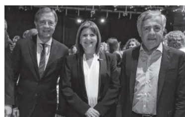
Bullrich con Cornejo. - JPC -

licencia se habría inclinado por el mendocino, delfín del senador y aspirante a la Gobernación mendocina, Alfredo Cornejo. La primera señal en esta línea que mandado Bullrich fue en marzo, durante la Vendimia.