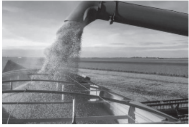
La soja no alcanza.