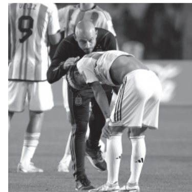
Mascherano seguirá en el cargo "hasta que Tapia lo disponga". - Télam -

Con respecto al encuentro, el DT comentó: "Sabíamos que, si cometíamos errores y descuidos, lo podíamos pagar". Más allá de eso, sostuvo que el equipo "hizo el partido que tenía que hacer". - DIB -