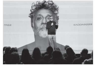
Presentación en CABA. - Archivo -