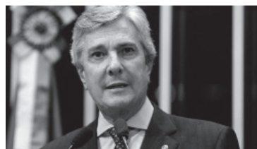
Fernando Collor de Mello.

El máximo tribunal -por 8 votos contra 2- lo halló culpable el jueves por los delitos de corrupción y lavado de