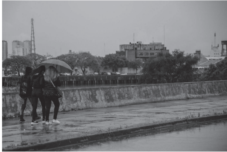
Informe. El "Pronóstico climático trimestral" fue elaborado durante mayo. - DIB -

En el desglose, de acuerdo con el informe, la previsión de precipitaciones es superior a los normal