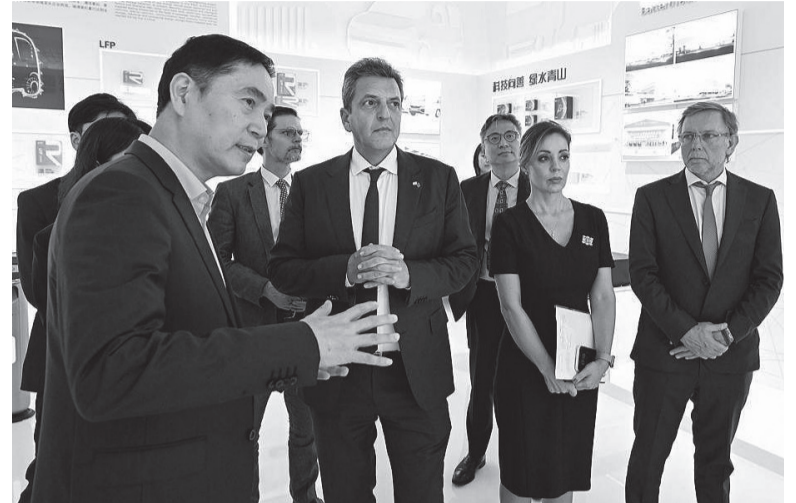
Agenda cargada. Massa durante una de sus actividades en China.

Siendo así mayo es el sexto mes consecutivo de aceleración en la suba de precios mensual. En noviembre de 2022 había tocado un piso de 4,9%, y desde allí rebotó hasta la actualidad. Respecto de los principales rubros que empujaron la suba, "Alimentos y bebidas no alcohólicas" mostró una suba del 9,1% mensual, sosteniendo el crecimiento por encima del 9% por tercer mes consecutivo, a pesar que la última semana de mayo registró una fuerte desaceleración aumentando solo un 0,2%. - DIB -