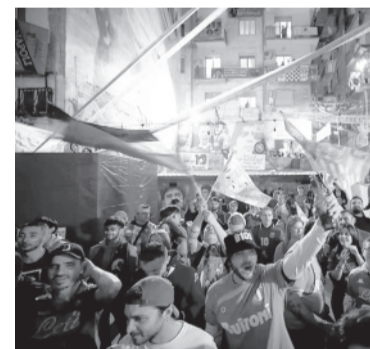
Locura en Nápoles. - Napoli -

Y los 12 mil en la cancha invadieron el terreno de juego, como en los viejos tiempos, para llevarse un trofeo para el recuerdo,