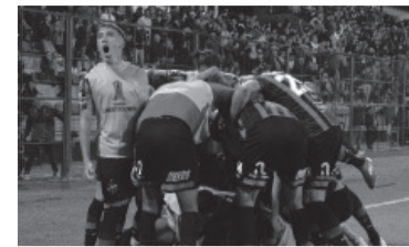
Primera victoria internacional.