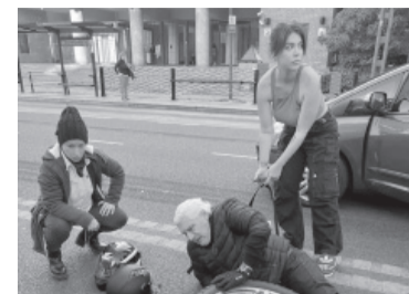
Wanda Nara solidaria.