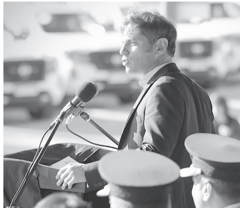
Definición. Kicillof, con Insaurralde y Sileoni. - Gobernación -

Kicillof reconoció que “la mayoría de los espacios que conforman el FdT” le piden que compita por la reelección, pero reiteró que “como todavía no hay definiciones en diferentes planos, la estrategia de la Provincia tampoco va