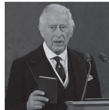
El rey Carlos III.

Carlos III, quien mañana será coronado oficialmente como rey de Inglaterra después de una carrera real no exenta de controversias, deberá enfrentar como nuevo monarca el desafío de modernizar la institución y hacerla más relevante y accesible para la sociedad actual, así como mantener la imagen pública de la monarquía en un contexto de mayor escrutinio y transparencia.