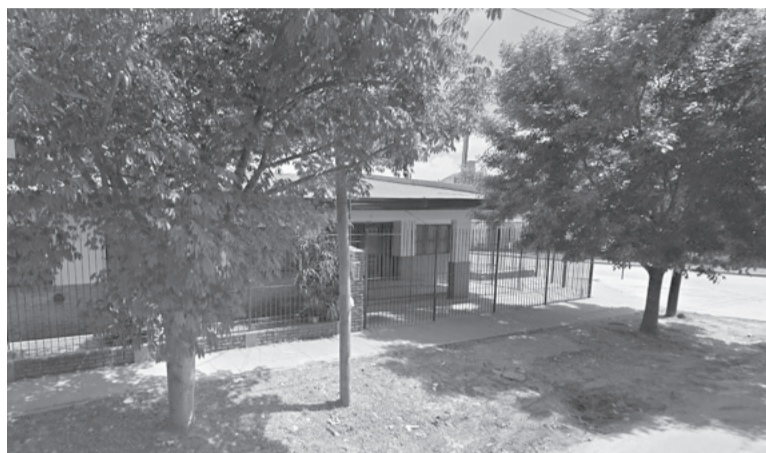
Berazategui. Trabajan en la Escuela Primaria N°47 para asistir al estudiante. - DIB -

Lo cierto es que el miércoles, el niño de 12 años, que estaba suspendido, ingresó a la institución por la puerta de la escuela secun-