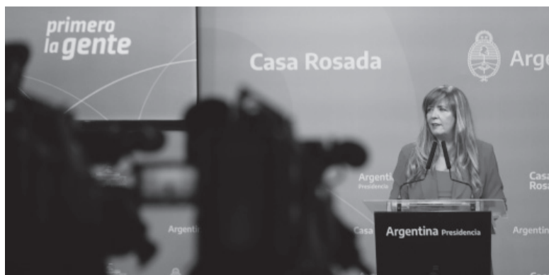
Claroscuros. Cerruti habló de avances pero admitió errores.

está accediendo al planteo de Argentina "a partir del reconocimiento de que, cuando se firmó el acuerdo, el presidente Alberto Fernández fue muy enfático en poner una cláusula que dijera que, si llegaba a haber contingencias, por ejemplo, producto del cambio climático, se podía revisar el acuerdo".