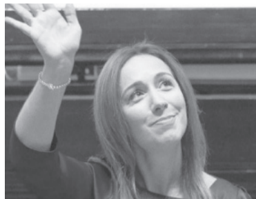
Afuera. Vidal no competirá por la presidencia.

En su mensaje, sostuvo: “Estoy convencida que es fundamental que los argentinos confíen en que Juntos por el Cambio es la salida. Es el único espacio político con el equipo y la experiencia necesaria para sacar el país adelante. Sé que las múltiples candidaturas sólo generan división e incertidumbre. Los proyectos individuales no pueden estar por encima del conjunto”.