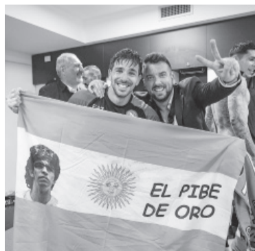
El hijo del "Cholo" aportó tres goles a la campaña.

La temporada de Simeone estuvo por debajo de las expectativas