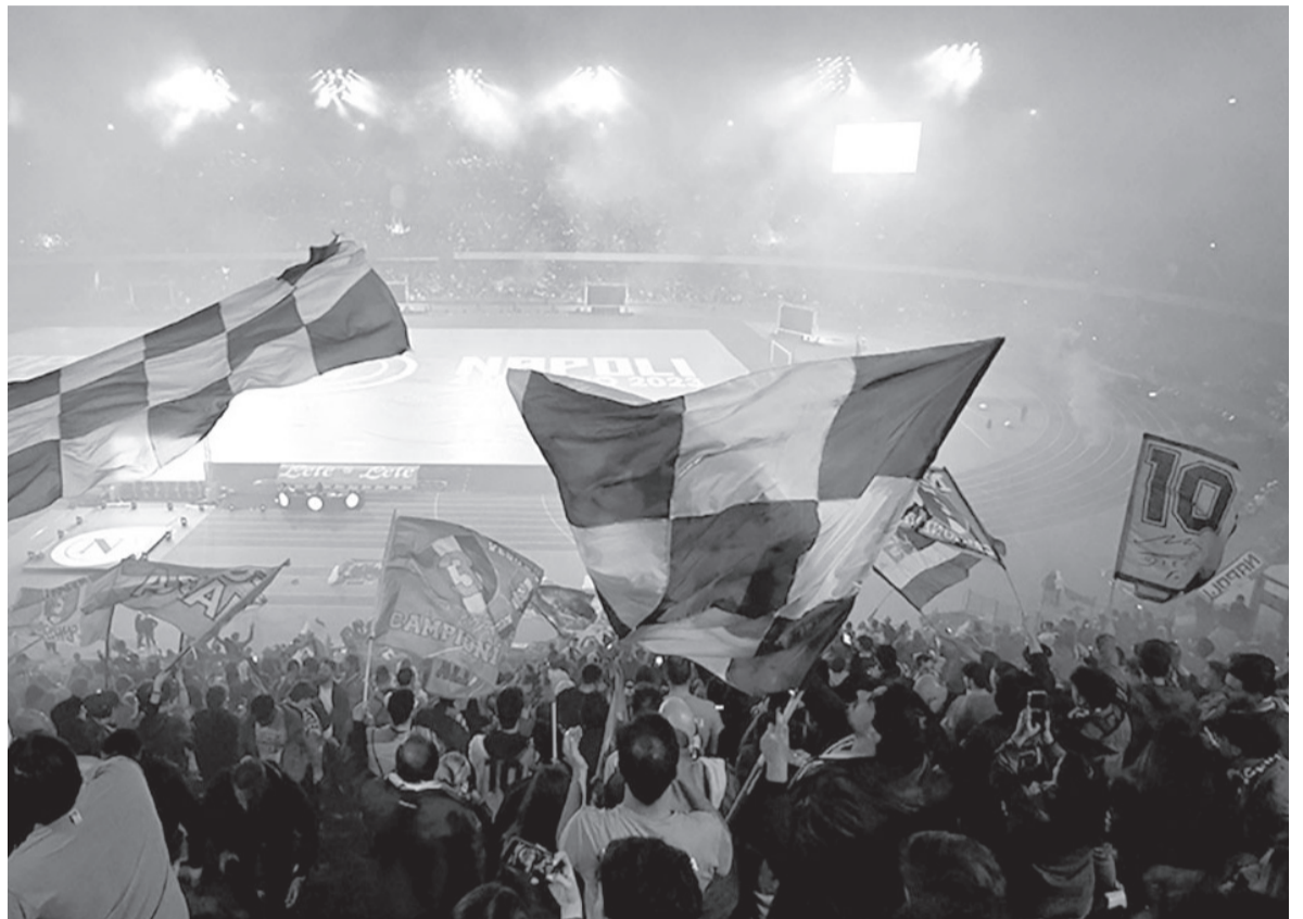
Locura. El estadio que lleva el nombre del astro argentino estuvo colmado para festejos que perdurarán semanas.

El nerviosismo para terminar con tantos años sin títulos se hicieron presentes en Napoli, que lejos