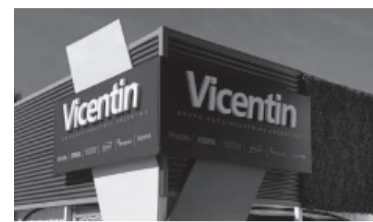
Vicentin, complicada.

Los acusan de simular una situación financiera sana que no existía para engañar a proveedores y tomar créditos.