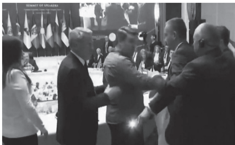
Imagen borrosa. Una captura de TV que muestra el momento de la pelea.

El primer momento se dio durante el discurso de la parlamentaria Ola Timofeeva, miembro de la Asamblea Federal de Rusia. Mientras la representante del partido Rusia Unida exponía frente a los presentes,