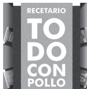
Recetario digital. - Cincap -

El recetario, creado por los alumnos de la materia "Prácticas Profesionalizantes 2" de la Carrera Técnico Superior en Gastronomía es una muestra más del aporte nutricional de esta materia prima y su gran versatilidad y practicidad.