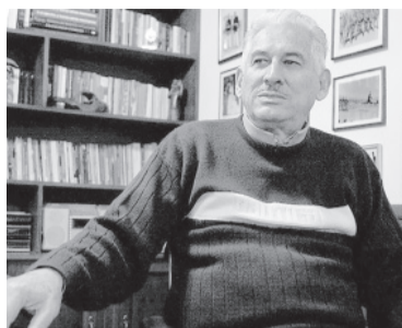
El general boliviano Gary Prado Salmón.