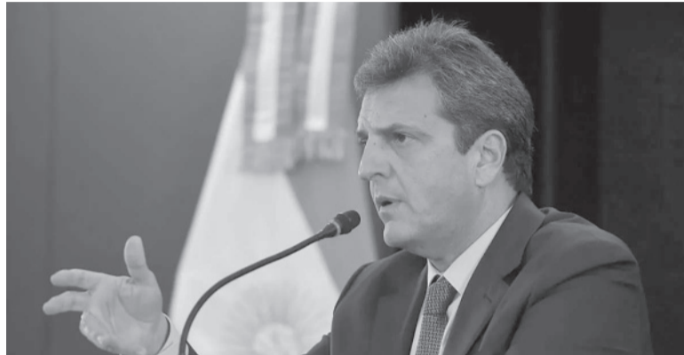
Cambio. El titular de Economía ratificó la decisión ayer en Twitter. - Archivo -

El ministro de Economía, Sergio Massa, confirmó que el nuevo mínimo no imponible del Impuesto a las Ganancias a la cuarta categoría será de $ 506.230 brutos a partir de mayo, medida que beneficiará a 250.000 empleados y empleadas que trabajan bajo relación de dependencia. "A partir de mayo hemos decidido aumentar el piso por el cual se comienza a pagar el Impuesto a las Ganancias a 506.230 pesos, llevando alivio fiscal a más de 250.000 trabajadores que dejarán de pagarlo cada mes", dijo durante la mañana el titular del Palacio de