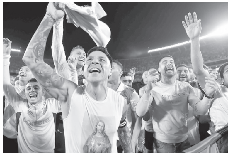
Locura. Festejo agónico del equipo de Demichelis.

A la media hora del segundo tiempo, la intensidad le pasó factura, principalmente a River. Sin tanta frescura, Martín Demichelis buscó más peso en el área con Borja,