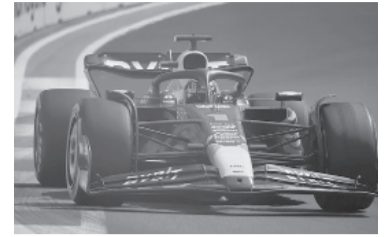
El RB19, incontenible para el resto. - Red Bull -