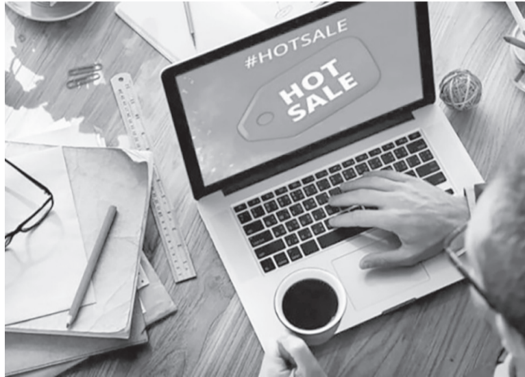
Nueva edición. "Hot Sale" es organizado por la Cámara Argentina de Comercio Electrónico (CACE).

En esta edición participan 960 marcas, de las cuales más de 200 corresponden a empresas radicadas en las provincias argentinas. El año pasado la facturación del sector superó los 2,8 billones de pesos ($ 2.846.000 millones) gastados por más de 21,8 millones de personas, de las cuales el 57% hace al menos una compra al mes, según el informe anual de la CACE, en ese caso con el trabajo de la consultora Kantar. Las categorías identificadas con "más compras" suelen ser Turismo y Pasajes, Electrodomésticos, aires acondicionados,