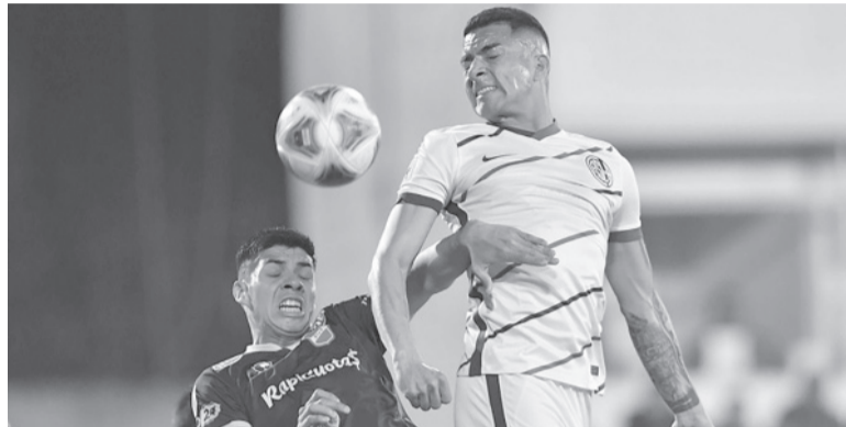
Prendidos. Ambos buscan no perderle pisada a River.