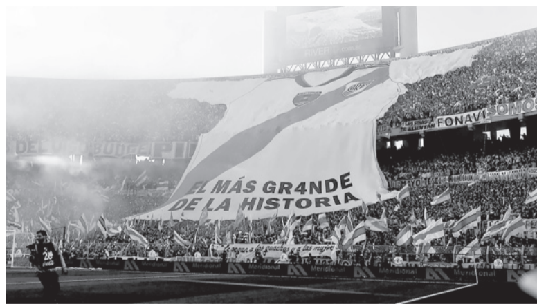
La espectacular camiseta desplegada por los hinchas.

El de ayer fue el primer Superclásico jugado tras la renovación del Monumental, lo que propició que se haya roto la cantidad de público en un River-Boca. En total, el aforo fue de 83.196 personas. Los hinchas recibieron a su equipo con una fervorosa bienvenida que incluyó un "telón",