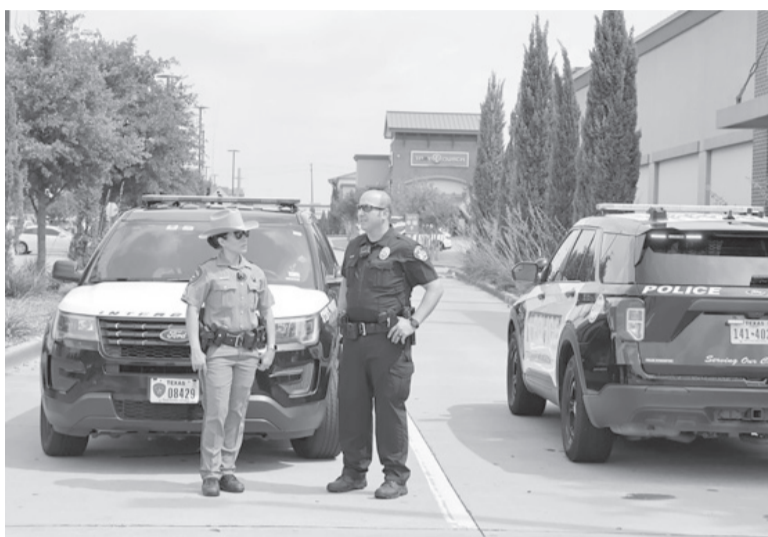
Horror. Este año los ataques se vienen sucediendo a un ritmo alarmante.

La policía seguía investigando la identidad de las víctimas en Allen Premium Outlets, un cen-