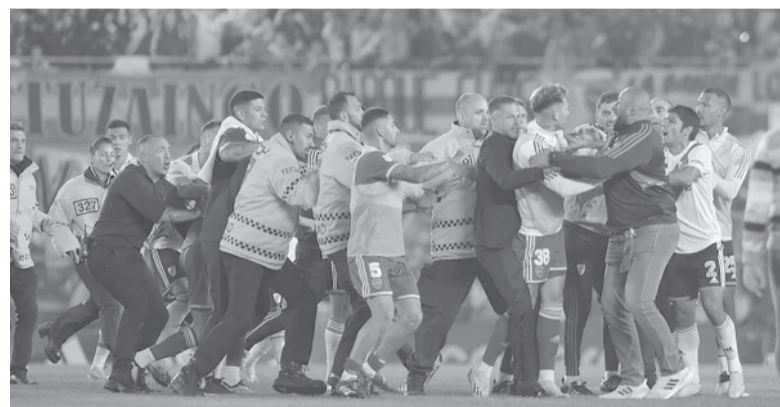
Tras el gol "millonario" se libró la gresca, con tres expulsados por lado. - Télam -

humo rojo y blanco, y cánticos alusivos a la final ganada en la Copa Libertadores 2018. Además, una enorme camiseta riverplatense se desplegó en la tribuna Sívori con el diseño 2018, la misma que utilizó el plantel campeón en el Santiago Bernabéu de Madrid. - DIB/Télam -