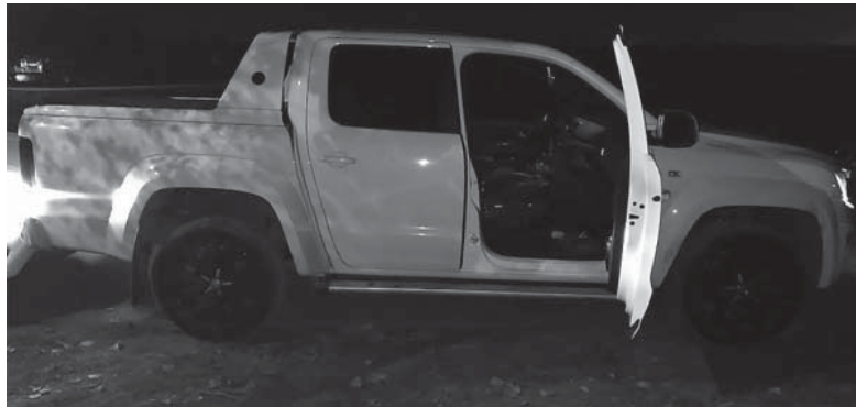
Hecho. La camioneta apareció abandonada en el partido de Moreno. Seguridad

Fue asaltado por tres delincuentes armados cuando se hallaba junto a su novia.