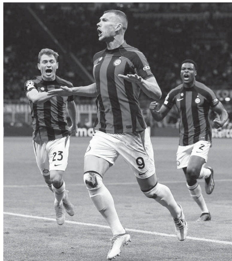
Eficaz. El nerazzurro pudo incluso aumentar el marcador con un penal que fue anulado en el VAR.

Pioli realizó cambios, mientras que los dirigidos por Simone Inzaghi seguían representando un peligro de gol latente con sus contrataques, la movilidad de Lautaro y la de Dzeko, quien además bajaba para actuar de