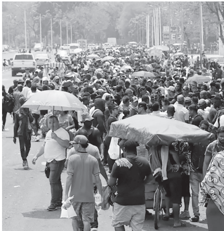
Cambios. Cae la regla impuesta en pandemia para hacer expulsiones rápidas.

“Estamos ampliando significativamente, a partir del jueves, nuestro uso de la expulsión acelerada en la frontera”, expresó el funcionario, y agregó que el año pasado se construyeron salas de entrevistas adicionales y se agregaron líneas telefónicas en las instalaciones tanto de CBP (Aduanas y Protección Fronteriza, dependiente de Seguridad Interior) como de ICE (Servicio de Control de Inmigración y Aduanas). “Estaremos listos para desplegar hasta 1.000 oficiales de