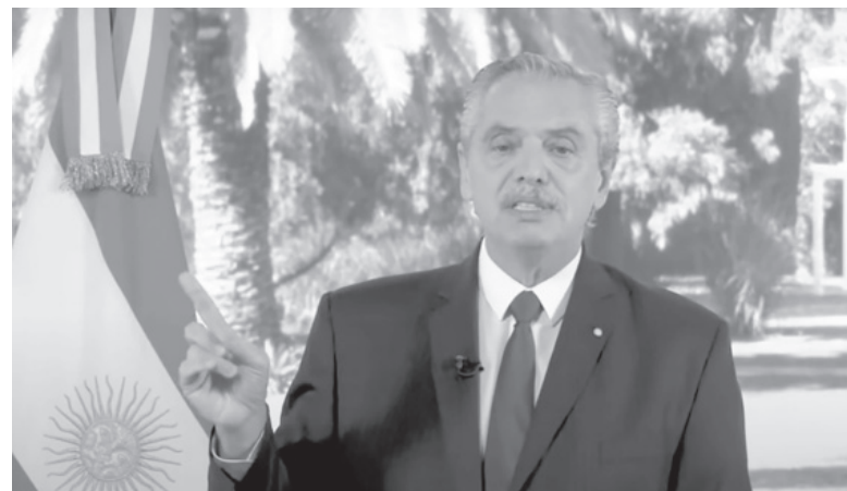
Duro. El Presidente, muy crítico con la Corte.

El Presidente, además, vinculó el fallo a una opinión previa de Mauricio Macri. "Tampoco puedo dejar de observar que el fallo deviene inmediatamente después de que Mauricio Macri tratara de