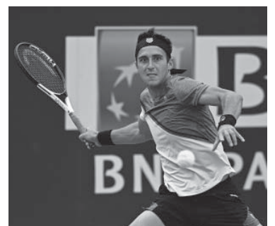
El platense ahora se medirá ante Djokovic. - ATP -

En tanto, en el cuadro de damas, la rosarina Nadia Podoroska (101) se marchó rápido del torneo