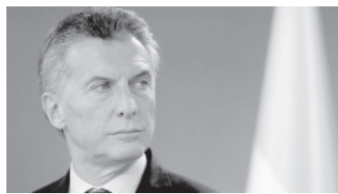
Mensaje. Macri publicó un texto en redes. - Archivo -

"La Corte Suprema es el árbitro de nuestra vida en común. Es la que aplica las reglas del partido que jugamos todos los días. Podemos estar en desacuerdo con sus fallos, como podemos dudar de si una mano fue penal o no. Pero no podemos cuestionar la legitimidad del árbitro o parar el partido para pedir que pongan a otro. Sin la autoridad del árbitro nos quedamos sin reglas en el fútbol, no se puede jugar. Sin la independencia y la legitimidad de la Corte Suprema, nos quedamos sin reglas en la política y en