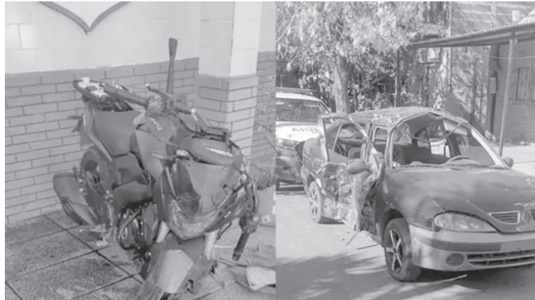
Secuestros. Los dos vehículos involucrados en el fatal choque. - Seguridad -

Por su parte, Sotelo y Colche fueron trasladados en un vehículo particular al Hospital Balestrini de Ciudad Evita, donde recibie-