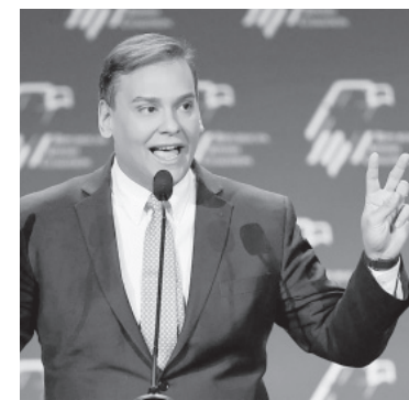
George Santos.