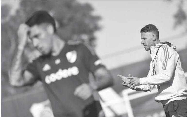
En alza. Pese a la exigencia de Demichelis, los jugadores "millonarios" trabajaron con buen ánimo.