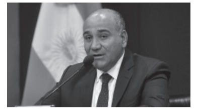
Juan Manzur.

Tras bajarse de la candidatura a vice por el fallo de la Corte Suprema.