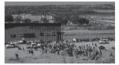
Inmigrantes esperan en la frontera. - Nueva Rioja -