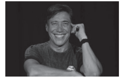
Gianola fue sobreseído.