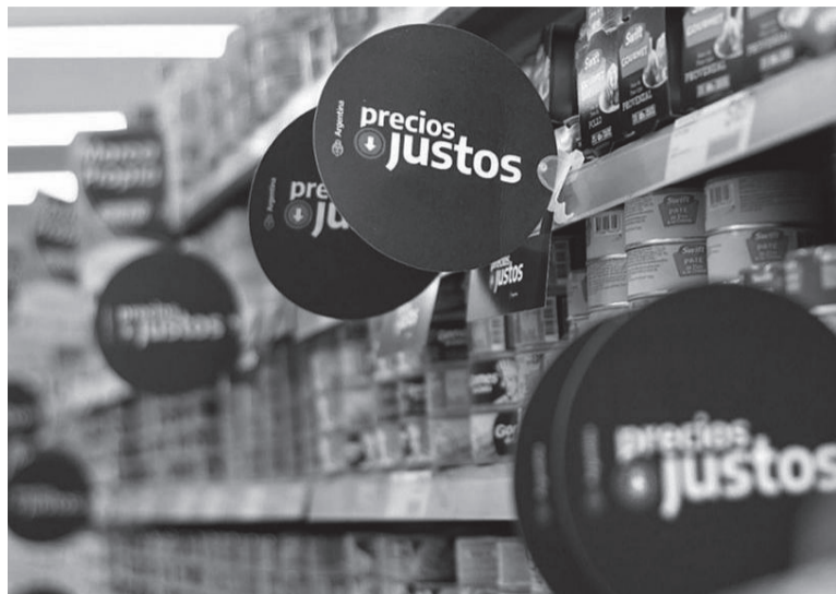
Carísimos. Los alimentos, lo que más aumentó.

El área del Gran Buenos Aires fue donde más subieron los precios en general, con un alza de 8,6% en el último mes. Luego le siguieron la región Pampeana (8,5%) y el Noreste (8,3%). El menor incremento de precios fue en la zona de Cuyo, aunque la suba