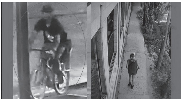
Video. Tras allanamiento secuestraron una visera rosa que la mujer llevaba puesta el día de la desaparición. - Captura de video -

En un allanamiento realizado en ese domicilio y en otro allanado en Villa Trujui en el marco de la pesquisa, los detectives de la DDI de Moreno secuestraron una visera rosa que la mujer llevaba puesta el día de la desaparición y que Sosa se habría llevado como "trofeo" después del