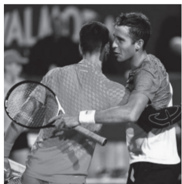
El saludo del platense con el astro serbio. - Twitter -

Herrera fue campeón con Atlético de Madrid (3 veces), Barcelona (5), Roma (1) e Inter (7), al que condujo dos veces hacia la conquista de la Copa Intercontinental. - Télam -