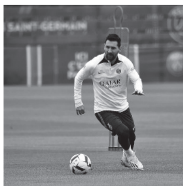
La sanción original tenía una extensión de dos semanas.

Germain es el puntero de la Ligue 1 con 78 unidades, seguido por Lens con 72 y Marsella con 70, cuando restan 12 unidades por jugarse.