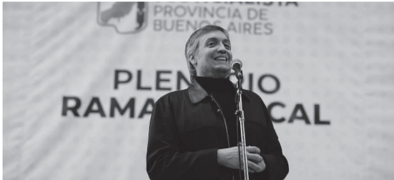
Jefe. Máximo Kirchner en una reunión previa del PJ.

Las invitaciones para los 912 congresales que participarán en el cónclave que presidirá el intendente local Fernando Espinoza se cursaron "a las apuradas", en la última semana. La Cámpora quiere quedarse con el control de los representantes