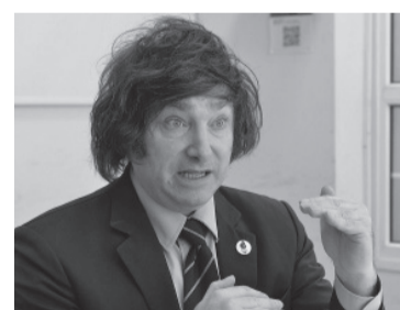
Javier Milei.

"Un 8,4% de inflación mensual 'IMAGINARIA' 108,8% de inflación interanual 'IMAGINARIA'. Más de tres años gobernando sin plan eco-