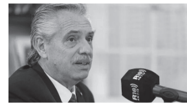
El Presidente dio una nota a Radio 10.