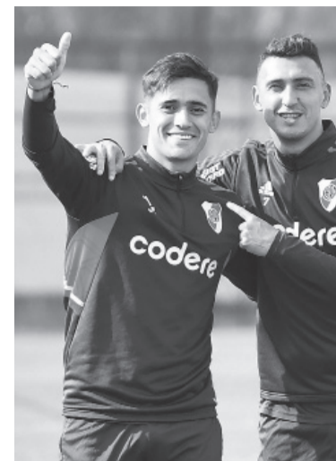
Solari y Suárez serán suplentes. - CARP -