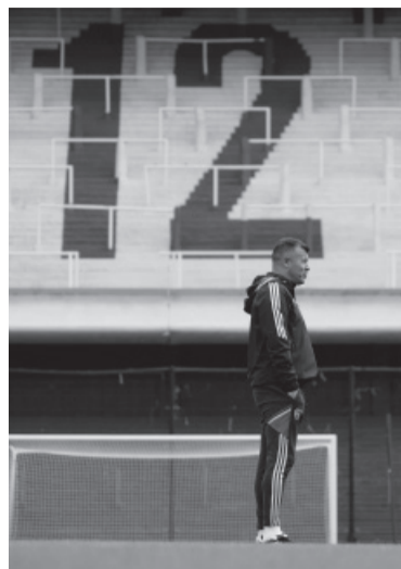
Entrenamiento en La Bombonera. - CABI -