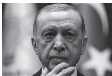
Nicolas Sarkozy. - Archivo -

Una de las principales razones de la pérdida de popularidad