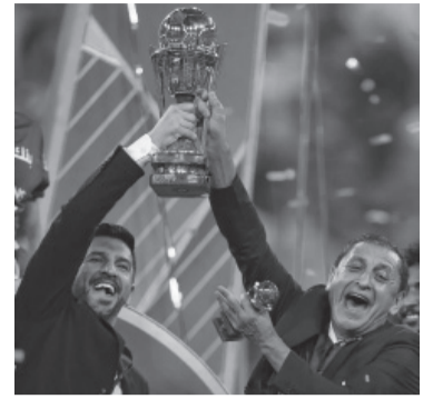
El riojano igualó a Helenio Herrera.

Ramón Díaz, el DT argentino más ganador de todos