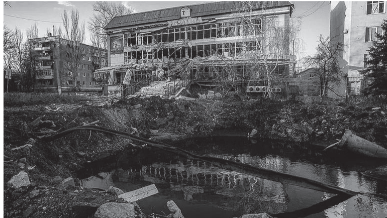
Eje. Bakhmut, la ciudad en torno de la cual se libra la ofensiva.

Videos difundidos por el Ejército ucraniano mostraban a soldados saliendo de vehículos blindados y asaltando una trinchera rusa. "¡Adelante, adelante!", gritaba un soldado en el video grabado con una cámara de casco. Los soldados se pusieron a cubierto cuando los combatientes rusos lanzaron una granada de