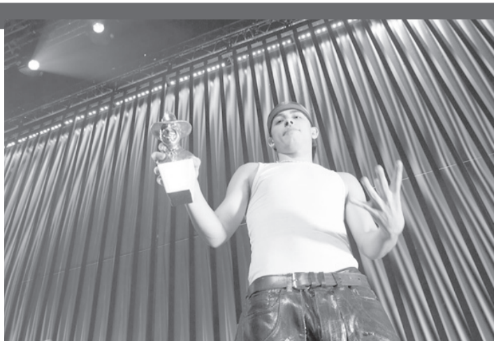
Trueno consolidó el dominio de los llamados “ritmos urbanos” al alzarse con el Gardel de Oro por su disco “Bien o Mal”, en la 25ª edición de los Premios Gardel que se entregaron en una ceremonia realizada en el Movistar Arena, del barrio porteño de Villa Crespo. - DIB -