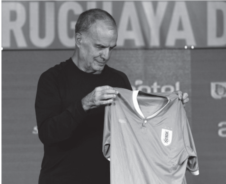
Nuevo ciclo. El "Loco" recibió una camiseta del seleccionado y un óleo del estadio Centenario; luego, dio cátedra.

Bielsa asumió después de la salida de Diego Alonso con el que habló, según explicó, y cuando le preguntaron sobre el potencial fracaso de no ser campeón en la Copa América 2024 de los Estados