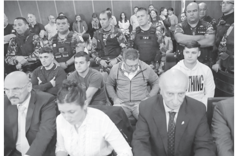
Veredicto. El jurado popular deliberó durante más de ocho horas.

El jurado que intervino en el juicio que se les siguió a los cuatro policías acusados de provocar la muerte de cuatro jóvenes que chocaron con un auto cuando eran perseguidos a los tiros en mayo de 2019 deliberó durante más de ocho horas. Los doce miembros del jurado se retiraron a deliberar