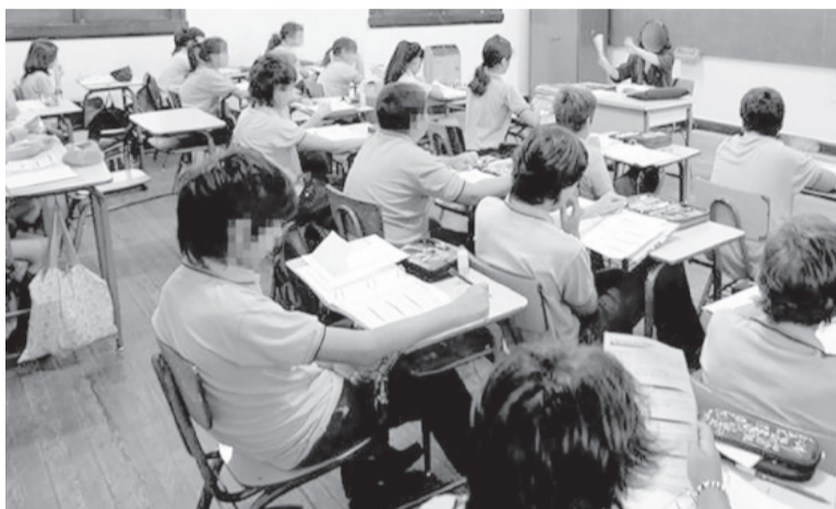
Inflación. Si prospera el pedido de Aiebpa, las cuotas subirán un 18,2%. - DIB -

La entidad, que agrupa a más de 2.300 establecimientos educativos de gestión privada en Buenos Aires, solicitó un aumento adicional de 11,5% con relación al mes de abril, que se debe sumar al au-