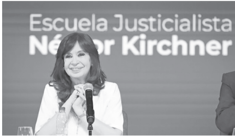
Sin clamor. Cristina Fernández, ya fuera de la carrera presidencial.

El evento fue originalmente planteado como parte de un "operativo clamor" para que Fernández se presente como candidata a presidenta en los comicios de este año y se iba a realizar en la avenida 9 de Julio. Luego de la reunión de ayer, el ministro de Desarrollo de la Comunidad bonaerense y