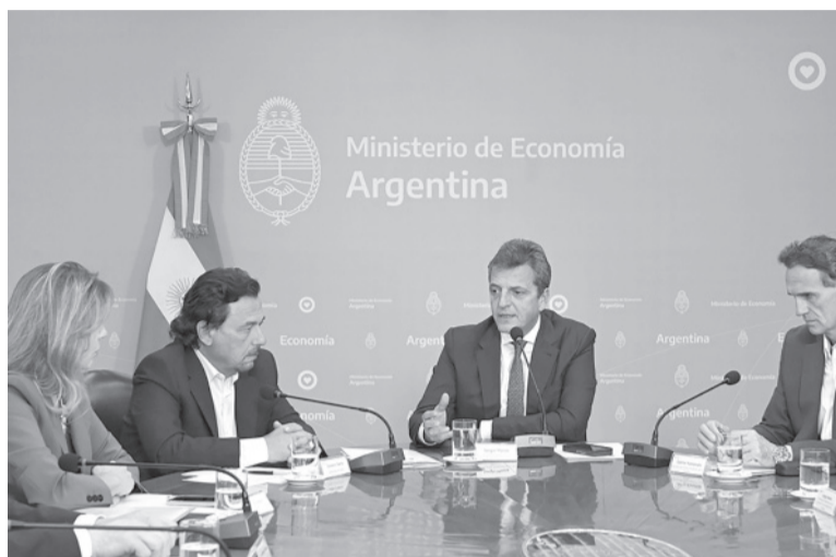
El ministro. Massa, ayer, reunido con el gobernador Sáenz.

El período para declarar serán 360 días de corrido desde la entrada en vigencia de la normativa. La iniciativa habilita a que una persona pueda declarar bienes que se encuentren a nombre de otras cuando se trate de "su cónyuge, conviviente o de sus descendientes o ascendientes en primer o segun-