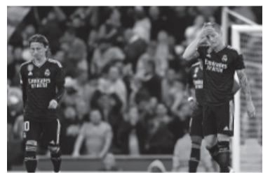
Los "Merengues", de luto deportivo. - SPORT -

El portugués Bernardo Silva por duplicado, el brasileño Eder Militao (en contra) y el atacante campeón del mundo con Argentina en 2022 convirtieron para el City en un Etihad Stadium de Manchester colmado y exultante de alegría