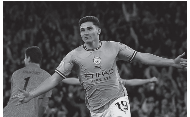
Implacable. El "Araña" de Calchín ingresó a los 42 minutos y tocó una sola pelota: terminó dentro del arco.

de la Champions con 14 títulos, modificó su actitud en el segundo tiempo y tuvo un poco más la pelota. Un tiro libre ejecutado por el austriaco David Alaba inquietó al arquero brasileño Ederson, quien sacó el balón con esfuerzo por encima del travesaño.