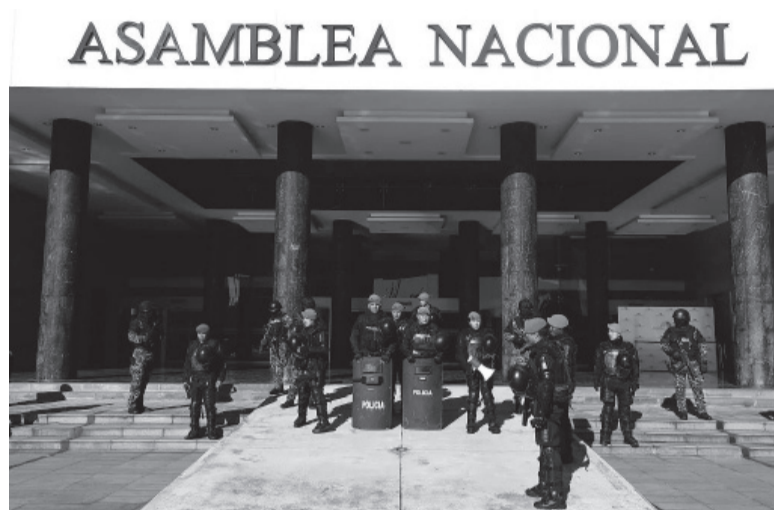
Tensión. Policías antimotines tomaron ayer el control del edificio de la Asamblea Nacional.

En medio del alza de la violencia ligada al narcotráfico y del descontento por el aumento del costo de vida, la decisión puede implicar el fin del gobierno de derecha y dar una oportunidad a la izquierda, que domina el Congreso, para recuperar fuerzas. La Constitución establece que en un plazo máximo de siete días, tras la publicación del decreto de disolución, se convocará a elecciones legislativas y presidenciales para completar el actual mandato de cuatro años, que comenzó en 2021 y