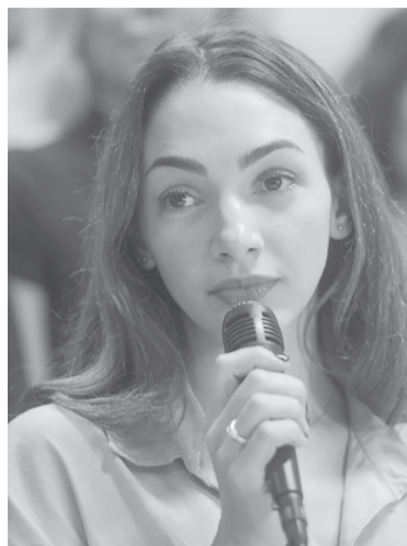
La actriz durante la conferencia de prensa brindada el pasado sábado.