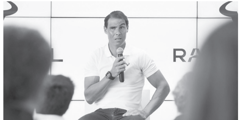
El anuncio no fue sorprendente, pero sí impactante.

El español brindó una conferencia en su propia academia en la que adelantó que su cuerpo lo obliga a tomar esa decisión.