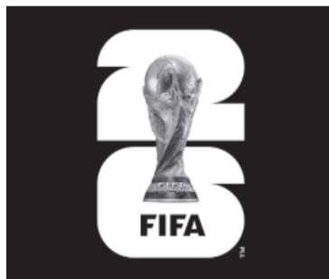
La marca destaca el "26". - FIFA -

La próxima edición mundialista se jugará entre junio y julio de