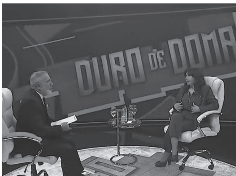
Entrevistada. Cristina, en un estudio de TV después de 6 años.

Acerca de qué va a hacer fuera de los cargos públicos, Fernández expresó que “va a seguir siendo una militante”, para que, “lo que considero que es lo mejor que les puede pasar a los argentinos, les pase”. En esa línea, la exmandataria manifestó su deseo de que “los hijos de la generación diezmada”, en la que se ubicó como dirigente,