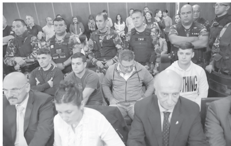
En el banquillo. Los cuatro policías bonaerenses fueron culpados.