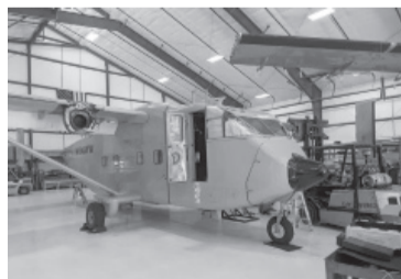
El avión Skyvan PA-51.

La aeronave, propiedad de un empresario estadounidense que tuvo “el recaudo de guardar las piezas originales” se encuentra actualmente en un hangar de la ciudad estadounidense de Dekalb -cerca a Chicago- en “pleno proceso de deconstrucción” y “puesta a punto” para emprender el regreso a Buenos Aires, dijeron los portavoces.