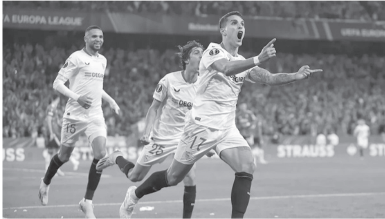
Heroico. El tanto del ex River llegó sobre el suplementario, cuando todo se encaminaba a los penales. - Sevilla -