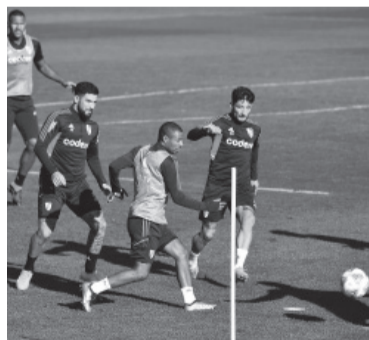
No está claro el once "millonario". - CARP -

Al tiempo que para el fin de semana va a recuperar la posibilidad de convocar a los jugadores