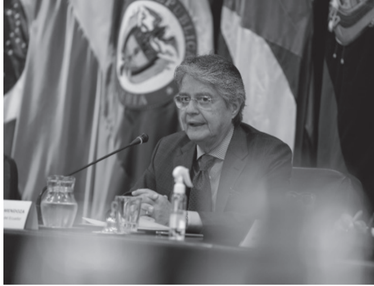
De salida. El presidente ecuatoriano Guillermo Lasso.

testas y la calma y la normalidad reinaban en Quito y las principales ciudades, aunque el edificio de la Asamblea Nacional permanecía bajo fuerte control de efectivos antimotines de la Policía Nacional. La Policía permitió ayer el acceso de personal administrativo del legislativo para retirar sus pertenencias, mientras que se prevé que lo propio podrán hacer los exlegisladores desde el lunes, informaron medios locales, que dijeron que no había problemas con el transporte ni en aeropuertos u hospitales.