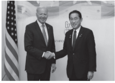
Kishida junto a Biden.