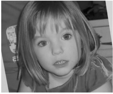
Madeleine McCann.