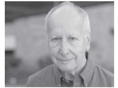
Luis Caffarelli será premiado.