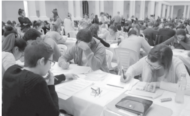
Plazo. Profesionales de la salud tienen tiempo hasta mañana para elegir el hospital donde van a concursar para hacer la especialidad. - DIB -

"Convertimos en política de Estado al fortalecimiento de la residencia en determinadas especialidades, con incentivos a mediano y largo plazo para que los jóvenes decidan elegirlos. Queremos que se inscriban sabiendo que el sistema los está priorizando y que va a sostenerlos ahora en su formación como residentes y luego con un proyecto de vida que sea agradable, digno y que cumpla con todas sus expectativas", destacó