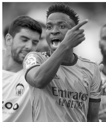
El brasileño, otra vez discriminado. - La Liga -