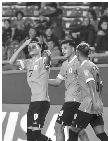
Goleada uruguaya en La Plata.