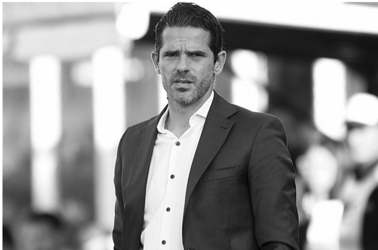
En la mira. Pese a la banca dirigenial, un mal resultado catapultaría a "Pintita" lejos del club.

Árbitro: Gery Vargas (Bolivia). Cancha: Cooprogreso G. Pozo Ripalda (Quito). Hora: 21 [Fox Sports].