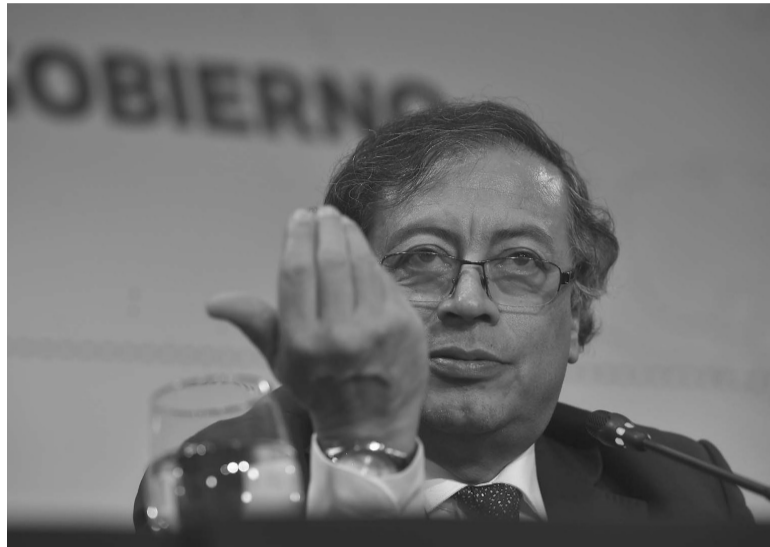
Oficial. La decisión la confirmó el presidente Gustavo Petro.

La suspensión en estas cuatro de las regiones más conflictivas del país, bastión de los guerrilleros en el sur del país y donde se presume que viven sus cabecillas, fue decidida tras el asesinato de cuatro menores indígenas por parte de los rebeldes. Los menores de la comunidad murui habían sido reclutados forzosamente por los rebeldes que se apartaron del pacto de paz que desarmó en 2016 a las Fuerzas Armadas Revolucionarias de Colombia (FARC), la otrora guerrilla más