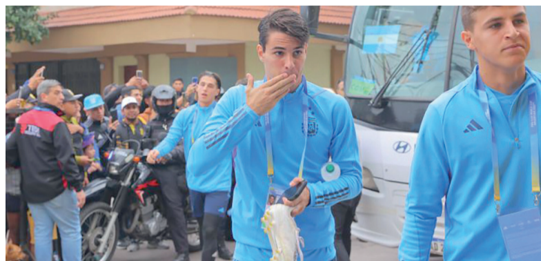
- AFA -