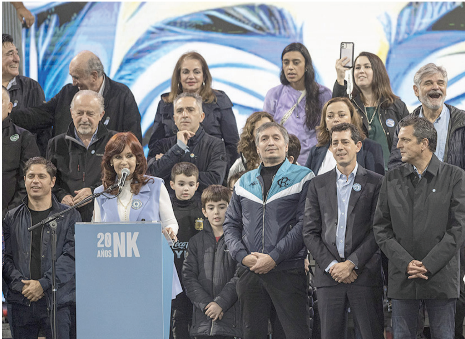
Protagonistas. Cristina Fernández, junto a Kicillof, su hijo Máximo, Wado de Pedro y Massa.

La Vicepresidenta repasó los logros de sus gobiernos y el de Néstor Kirchner ante una multitud que volvió a pedirle que se presente. Ella no dio pistas sobre candidaturas, pero pidió acordar un programa de Gobierno que incluya una reforma del Poder Judicial y un nuevo acuerdo con el FMI. - Pág. 3 -