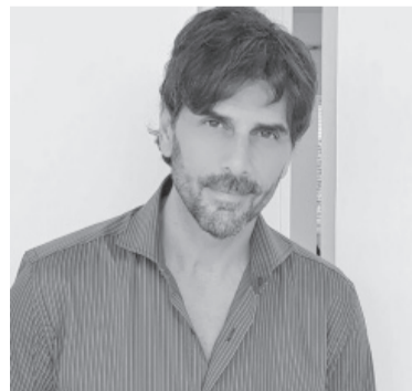
Juicio a Juan Darthés.