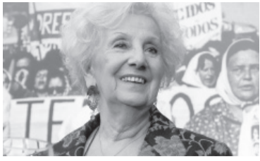
Estela de Carlotto.