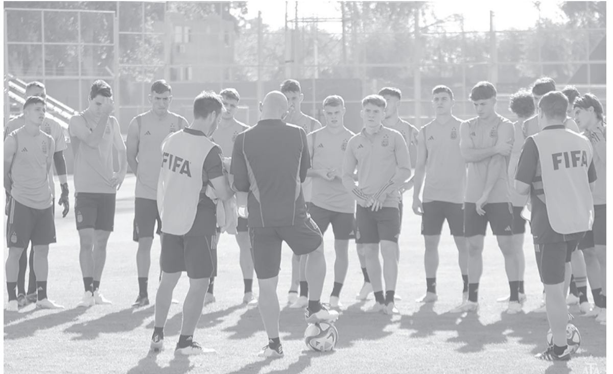
En Cuyo. Después de dos victorias en Santiago, hoy toca San Juan.