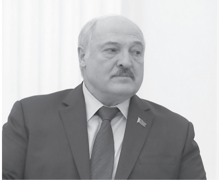
Pro Moscú. El presidente bielorruso Alexander Lukashenko.

La opositora bielorrusa en el exilio Svetlana Tihanóvskaya de-