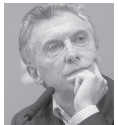
Mauricio Macri.

El diputado nacional Florencio Randazzo, por su parte, también