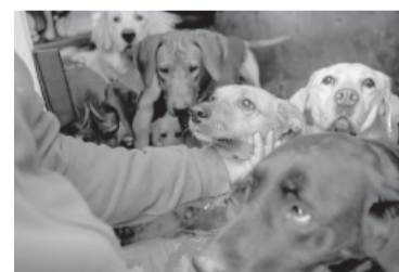
Fueron envenenados 17 perros en la zona.