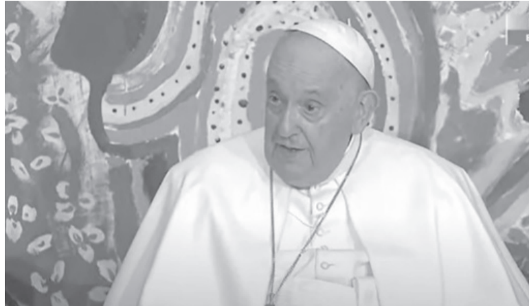
Confirmado. El Sumo Pontífice fue consultado durante una actividad por el décimo aniversario de Scholas Occurrentes. - Captura de video -

La Santa Sede comenzó recientemente a preparar el viaje del Papa