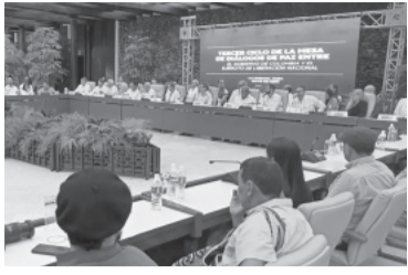
Cara a cara en La Habana.