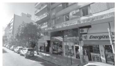
El edificio donde cayó la mujer.