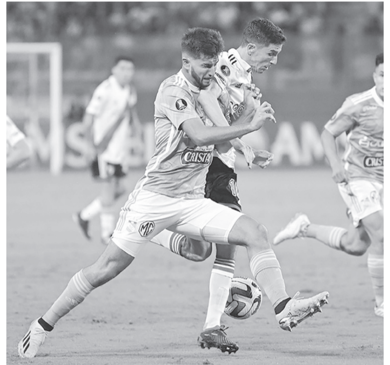
No hubo caso. River sigue último en la zona y debe sumar 6 de 6. - Conmebol -

Árbitro: J. Argote Vega (Venezuela). Estadio: Defensores del Chaco.