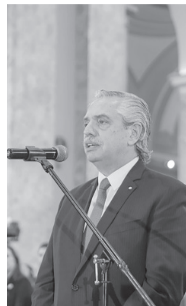
Alberto Fernández.

tió que recurrió en este tiempo “muchas veces” al Sumo Pontífice “porque Argentina lo necesitaba”. “El querido papa siempre estuvo ayudando. Hoy lo hago público porque siempre lo hizo en silencio. Nunca dejó de ayudar”, cerró.