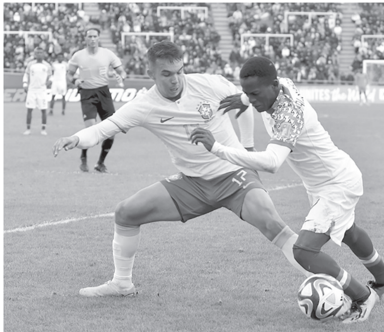
El que sigue. Nigeria, tercero del Grupo D.

El plantel llegó al país el 8 de este mes a Buenos Aires y durante la preparación jugó un amistoso contra los suplentes de Almirante Brown, que terminó en empate 2-2. Nigeria cayó en el "grupo de la muerte" junto a Brasil e Italia más el debutante República Dominicana. Pese a la dificultad de la