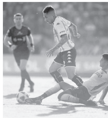
Defensa y Justicia está quinto, Racing, 19º.

El equipo de Avellaneda igualó 1-1 en su visita a Defensa y Justicia y apenas entra en el Top 20 de la Liga.