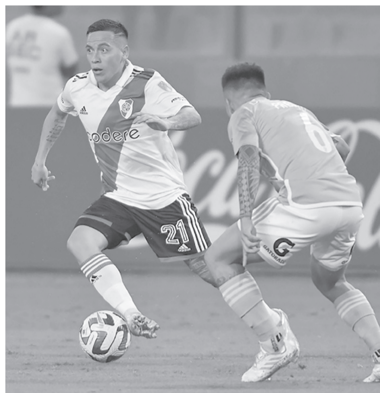
A dos frentes. River, puntero en la Liga, comprometido en la Copa.

Árbitro: L. Rey Hilfer. Hora: 19 [ESPN Premium]. Estadio: T. A. Ducó.