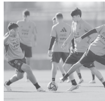
Entrenamiento dominical. - Prensa AFA -

El DT todavía no dio indicios del probable equipo y recién hoy en la práctica, a puertas cerradas, comenzará a trabajar con la mente puesta en Nigeria. El ganador disputará los cuartos de final el domingo 4 de junio a las 18 en el estadio Madre de Ciudades de Santiago del Estero. - Télam -