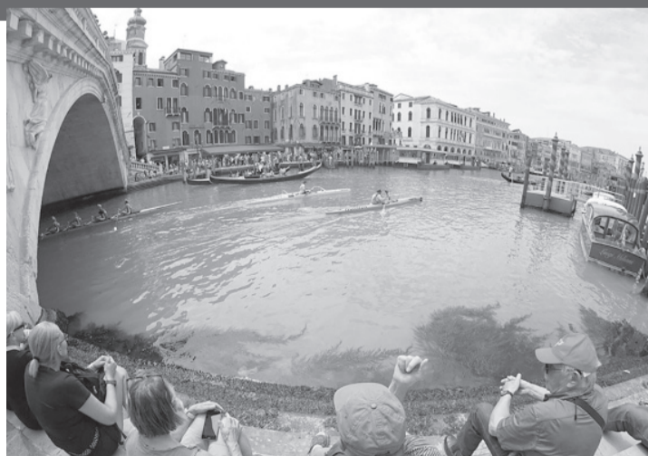
Una mancha de líquido verde fosforescente apareció ayer en el Gran Canal de Venecia, cerca del Puente de Rialto. Lo denunciaron unos ciudadanos, sobre las 9:30 (hora local), que avisaron a la Policía local, según un cable de ANSA. - DIB -