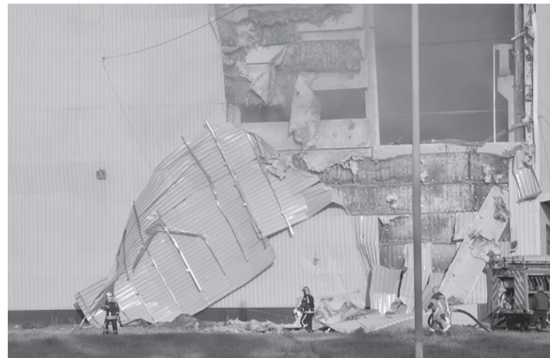
Guerra. El ataque de drones dejó al menos dos muertos y tres heridos.

un hombre de 41 años murió y una mujer de 35 fue hospitalizada, según el alcalde de Kiev, Vitali Klitschko.