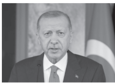
El presidente de Turquía, Recep Tayyip Erdogan.