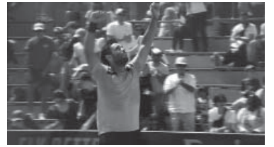
El entrenador se descompensó en la charla técnica. - Vélez -