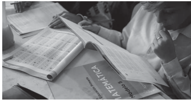
Resultados. El muestreo abarcó a más de 21.000 estudiantes.

Si bien no tuvo tanta diferencia con respecto a la prueba anterior, en Matemática la mejora también fue significativa. En esta asignatura, los estudiantes con desempeño