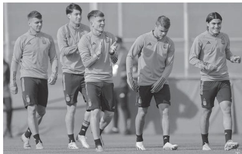
Buen clima. Los tres triunfos dejaron a los juveniles albicelestes trabajando con el ánimo en alza. - AFA -

Árbitro: Glenn Nyberg (Suecia) Cancha: San Juan del Bicentenario. Hora: 18 (TV Pública, TyC Sports y Directv Sports).