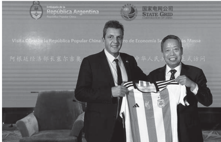
Reunión. Massa consiguió compromiso de inversión por parte de la compañía eléctrica State Grid. - Economía -

El ministro de Economía, Sergio Massa, anunció ayer en China la llegada de más de US$ 1.000 millones para el financiamiento de represas del Río Santa Cruz y advirtió que se trata de "desembolsos que a corto plazo nos alivian las reservas". "Estamos peleando cosas que tienen que ver con el día a día de Argentina pero que también ayudarán al próximo Gobierno y a las próximas generaciones", destacó Massa ayer en China, según detalló la agencia de noticias Télam. El anuncio del financiamiento fue hecho por el ministro en su primera jornada en el país asiático. Se trata de una cifra resultante de