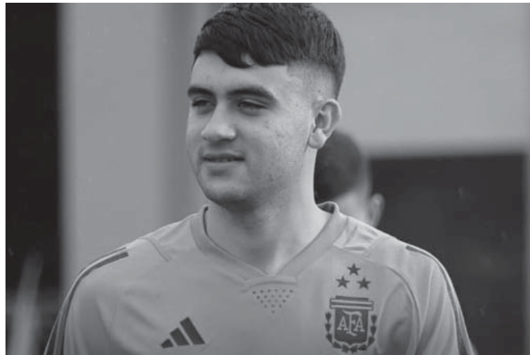
Nueva oportunidad. El club inglés no había cedido al rosarino para que dispute el Mundial juvenil.

"Tenía muchas ganas de jugar el Mundial Sub-20, no se pudo llegar a un acuerdo y eso me molestó mucho, me quedo tranquilo porque dejé todo para venir. Realmente