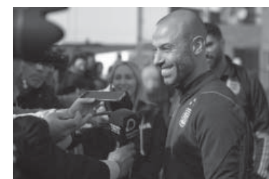
Así se lo notó al DT en la previa de un partido difícil. - Télam -

gente ayuda, tira para adelante y eso el equipo lo siente. Estamos muy entusiasmados y con ganas de jugar", dijo Gomes Gerth. Mientras que, para Avilés, jugar en el país "es lo más lindo que hay" porque el aliento del público "ayuda un montón". - DIB -