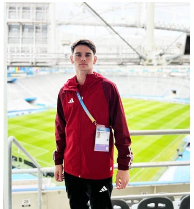
Además agregó que hoy comenzará a trabajar para una radio de La Plata,

Y añadió, "en mi caso particular tuve la posibilidad de vivir los partidos en pleno campo de juego, detrás de los carteles de publicidad junto a fotógrafos y periodistas. Cuando el partido finalizaba mi trabajo era estar en zona mixta, que es donde se realizan las entrevistas a jugadores y entrenadores durante toda la competencia que se realizó en el estadio Único Diego Armando Maradona. Fue algo inolvidable".