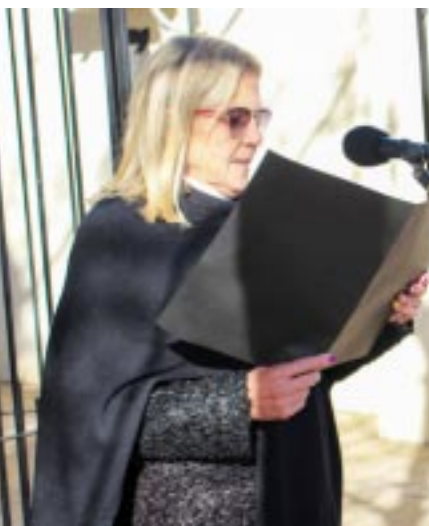
inspectoras de educación y vecinos/as.