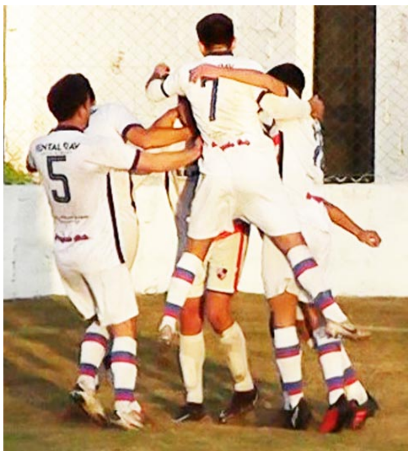
Bragado Club, festejando uno de sus goles