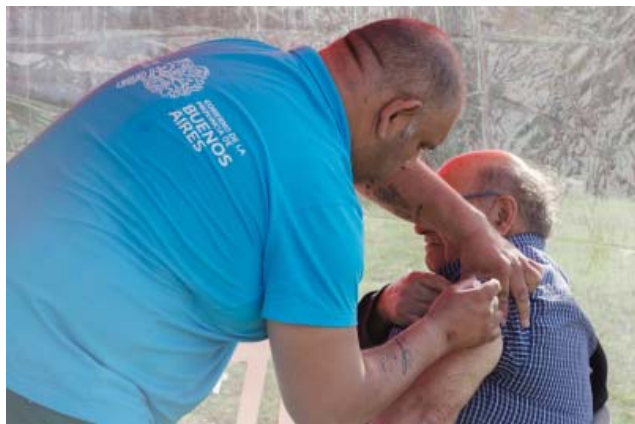
los domicilios del barrio Michel de 9 a 14 horas con una óptima respuesta de los vecinos.

Un equipo de vacunación del Hospital Municipal San Luis, instaló un stand de salud en la Plazoleta Bomberos Voluntarios y a su vez recorrió