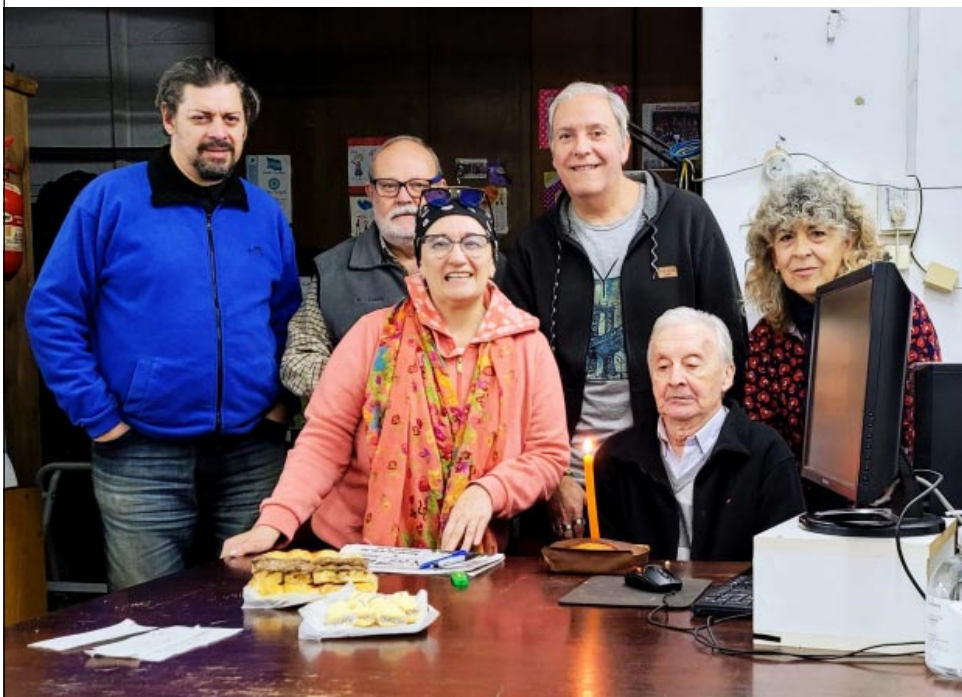
Feliz día al decano, que como todos los días dijo presente en la redacción... Gracias por el ejemplo y por muchos años más compartiendo momentos!!!