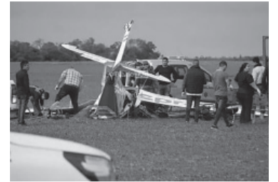
Avioneta desplomada. - Captura de video -