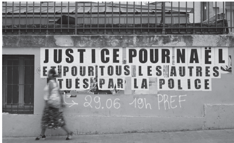
Pánico. Lo disturbios dejaron como saldo casi 500 edificios vandalizados. - Télam -

El balance de los enfrentamientos en la última noche fue elevado. El Gobierno informó de la detención