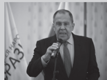
Serguei Lavrov, canciller ruso.

El canciller ruso, Serguei Lavrov (foto), aseguró ayer que el país quedó "más fuerte" tras la fallida rebelión del grupo paramilitar Wagner, que hizo tambalearse al Kremlin la semana pasada. "Rusia siempre ha salido más consolidada, más fuerte, de todas las dificultades (...) Así volverá a ser esta vez. Este proceso ya empezó", dijo Lavrov en una rueda de prensa en Moscú, según reportaron AFP y Sputnik. Las autoridades rusas intentan dar una imagen de normalidad e insisten en que el país ha salido "reforza-