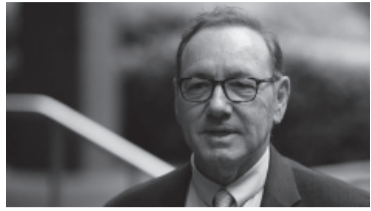
El actor afronta 12 cargos de abuso.