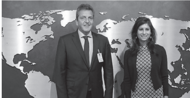
Sin acuerdo técnico. Massa, en su rol de ministro de Economía y Gita Gopinath, vice del Fondo Monetario.

El Fondo dijo que ayer el Directorio Ejecutivo mantuvo una reunión "informal" en Washington sobre la Argentina, un encuentro en el cual el staff suele informar sobre el avance de las discusiones y medir la temperatura del board. Se trata de un preludio de que las negociaciones están en la recta final. Luego de esa