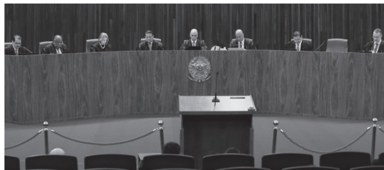
El Tribunal, en contra del ultraderechista: 5 votos contra 2.

El expresidente brasileño fue condenado por abuso de poder y difusión de fake news generando dudas en el sistema electoral.