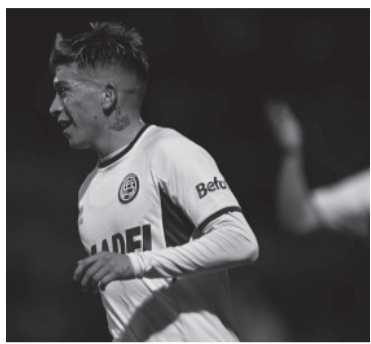
El autor del gol "granate". - Lanús -