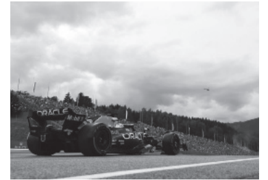
El campeón sigue al frente. - Red Bull -