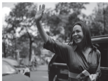
El gobierno de Maduro asegura que está inhabilitada desde 2015.

En el documento revelado por Brito, el ente venezolano ratificó la medida contra la coordinadora nacional del partido Vente Venezuela. "Cumpló con informarle que (a)