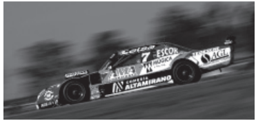
Castellano, el líder del torneo. - ACTC -