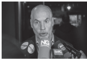
El intendente había criticado al modelo de Macri.

El gobernador de Jujuy y precandidato a vicepresidente por Jun-