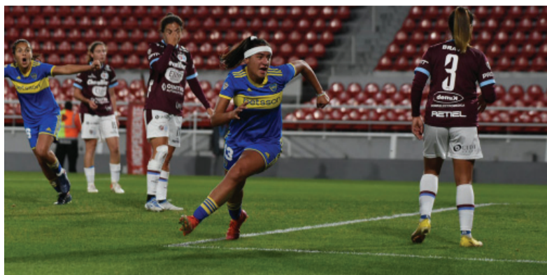
- Boca -