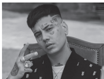
Duki se volvió interplanetario. - DIB -

Además el trapero, referente más convocante de la escena urba-