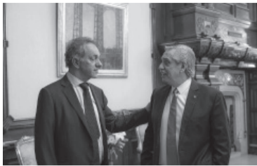
El embajador se mostró con CFK y con Massa.

Alberto con Scioli.- El presidente Alberto Fernández recibió al embajador argentino en Brasil, Daniel Scioli, tras las tensiones que se generaron en el cierre de listas y con el corrimiento de la precandidatura del exgobernador bonaerense. El Presidente que compartió una foto del encuentro: "Hablamos con Daniel Scioli sobre la necesidad de construir unidos el futuro", escribió en su cuenta de Twitter. Y agregó: "Su compromiso institucional es muy claro, debemos aprovechar todo su conocimiento y su capital político". Además, Fernández sostuvo que lo une a Scioli "una amistad de más de 20 años y la búsqueda de una sociedad más justa y democrática". El embajador venía de reunirse el pasado miércoles con la vicepresidenta Cristina Fernández y el jueves con el ministro de Economía y precandidato a presidente Sergio Massa, con quien ayer también compartió un acto. - DIB -