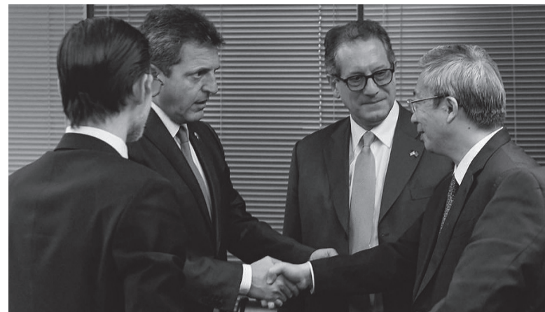
Acuerdo. Massa, con Pesce y Yi Gang, del Banco Popular de China.

El primer acuerdo entre ambos bancos centrales fue establecido en 2009 y en 2014 fue firmado un segundo acuerdo, renovado en 2017