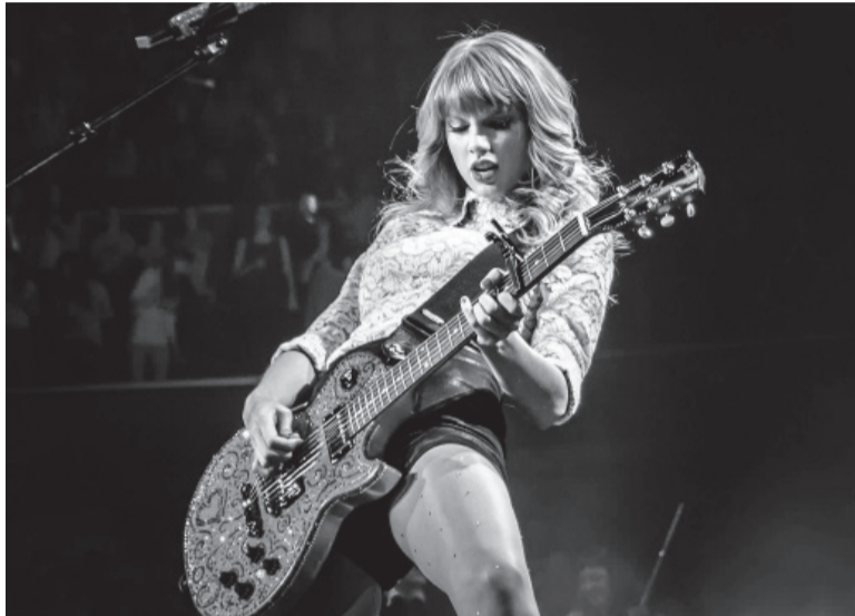
Impactante. El nuevo show de Taylor Swift se verá en Buenos Aires.

shows que la artista dará en América Latina contarán con Sabrina Carpenter como telonera e invitada especial quien entonará sus hits antes de la llegada de Taylor. Sabrina tiene 24 años y es cantante, compositora y actriz. Sus últimos singles superan los 3 millones de reproducciones en todo el mundo y lanzamientos de álbumes aclamados como "Fast Times", "Vicious" y "Nonsense".