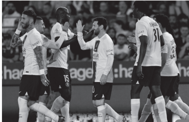
Despedida. Messi cierra su ciclo en su segundo club. - PSG -

El equipo parisino sumó su undécima estrella y pasó a ser el máximo ganador de la competición local, por encima de Olympique de Marsella y Saint Etienne, ambos con diez. El campeón del mundo aportó 16 goles y 16 asistencias en la campaña, que lo tuvo como protagonista en 32 partidos. Messi transitó sus últimos días con la camiseta de París Saint Germain en un contexto diferente en relación con lo que fue su arribo