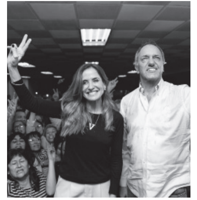
Scioli con Tolosa Paz.

ra y estoy analizando alternativas para vice, aún no lo definí. No quiero manosear ningún nombre hasta que hable con todas las personas que deba hacerlo”, señaló Scioli en declaraciones radiales.