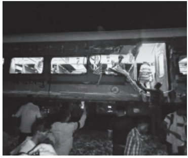
Imagen del horror.