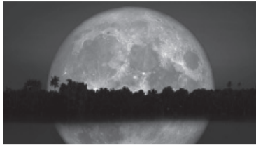
La luna, en todo su esplendor.