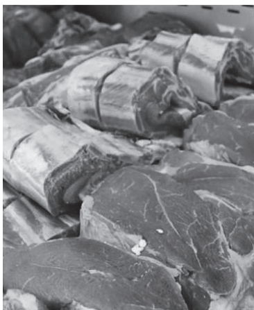
La carne subió mucho.