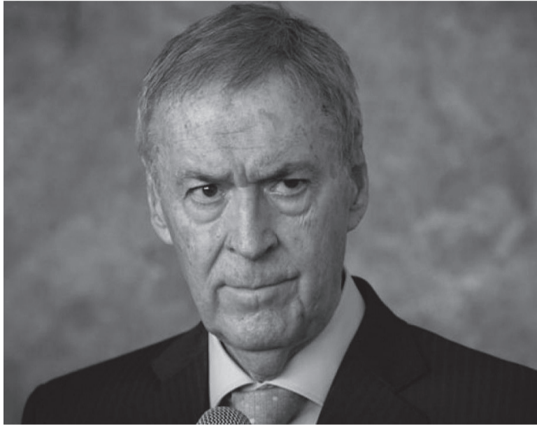
Tentado. Schiaretti podría recibir una oferta para sumarse a Juntos.

El encuentro virtual que mantuvieron los dirigentes se trató de una reunión que no estaba en