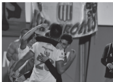
El "Pincha", animador de la Liga.