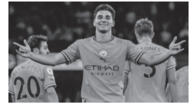
Julián Alvarez.