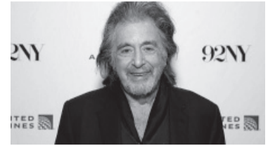
Al Pacino desconfió.