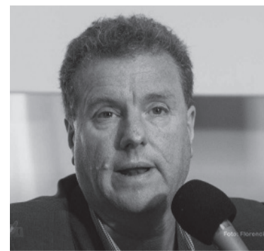
El diputado Millman.

Capuchetti se había negado a disponer esta medida pedida por la querrela de la vicepresidenta Cristina Fernández de Kirchner porque Milman no está imputado en la causa. La jueza sostuvo además que el ex número dos de Patricia Bullrich en el Ministerio de Seguridad tiene fueros parlamentarios, como diputado nacional por el PRO, por lo que habría que iniciar un proceso en la Cámara de Diputados.