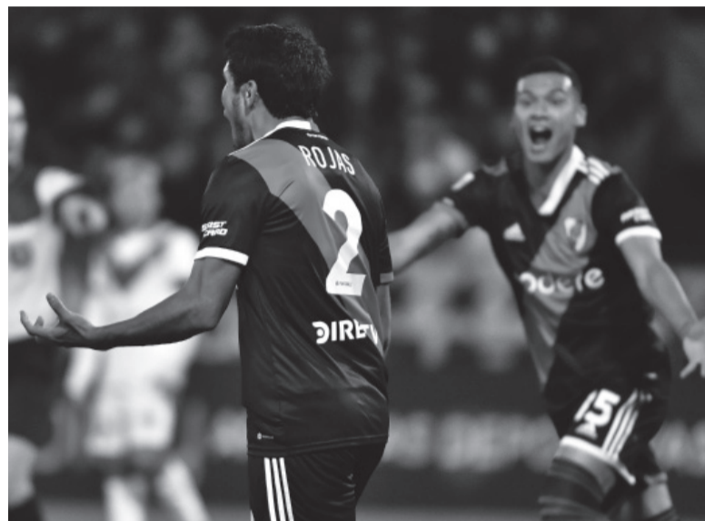
Frente interno. Por el torneo, River viene de igualar con Vélez.

Árbitro: F. Rapallini. Hora: 16.30 (ESPN Premium). Estadio: A. V. Libertri.