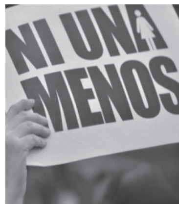
Un grito que no se apaga. - Archivo -

izquierda lo harán a las 13.30 en Avenida de Mayo y 9 de julio, desde donde marcharán hacia la Plaza de Mayo. - Telam -