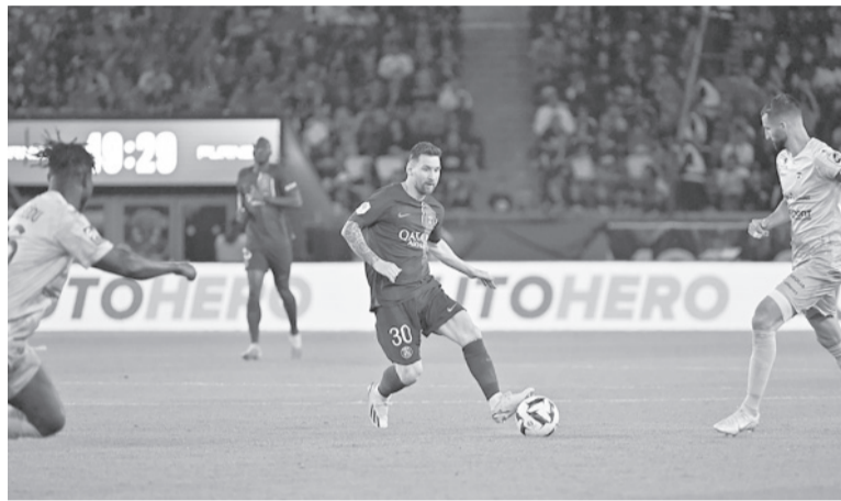
Cambio. El argentino ya cerró su ciclo en el PSG. - PSG -

El rosarino dispone sobre la mesa de una oferta de menor cuantía del Inter Miami de Estados Unidos, aunque su prioridad es retornar a