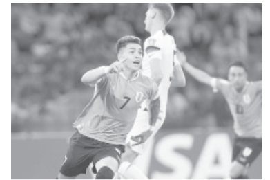
"La Celeste" derrotó 2-0 a Estados Unidos.