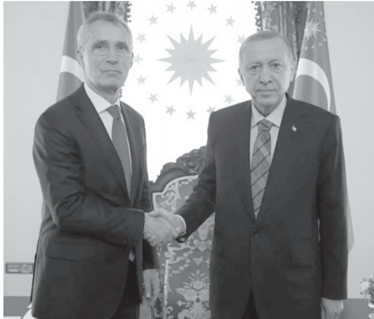
Cara a cara. Stoltenberg, secretario general de la OTAN, junto al presidente turco, Erdogan.

el palacio de Dolmabahçe en Estambul, fue "productiva", según Stoltenberg. A la reunión también asistió el nuevo ministro de Relaciones Exteriores y exjefe de los servicios secretos turcos, Hakan Fidan, según las fotos difundidas por la presidencia turca, informó la agencia de noticias AFP.