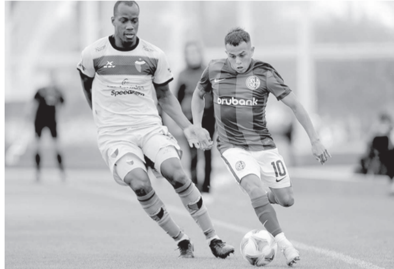
Desabrido. El equipo de Insúa no pudo sumar de a tres.

Árbitro: Darío Herrera. Cancha: Pedro Bidegain.