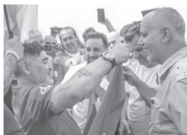
El club de La Paternal decretó tres días de duelo.