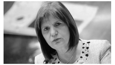
Patricia Bullrich.

La precandidata lleva al límite la pelea. Larreta insiste en su intención de sumar a Schiaretti.