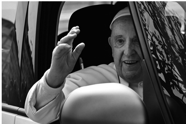
Salud. El Papa fue intervenido durante tres horas.

Según Bruni, “la operación, dispuesta en los últimos días por el