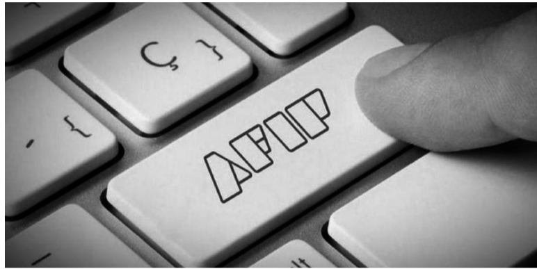
Beneficio. La AFIP formalizaría hoy el anuncio.

Si hubo cambios en los ingresos, alquileres y demás variables, hay que ingresar con clave fiscal para recategorizarse; si no se hace, se