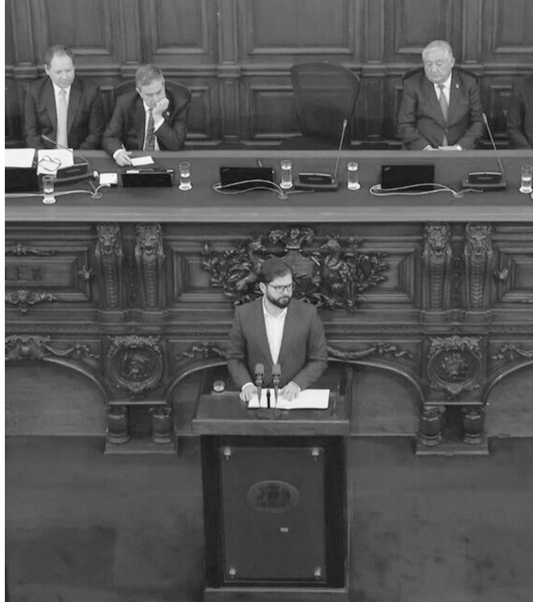
Al frente. La ceremonia estuvo marcada por la presencia del presidente Gabriel Boric, nombramientos, ausencias y protestas. - Efe -

Luego del discurso del mandatario se dio paso al nombramiento oficial de los consejeros, donde se ausentó el electo por la región del Bío Bío, Aldo Sanhueza, exmiembro del ultraderechista Partido Republicano, quien renunció al Consejo Constitucional y su partido debido a denuncias en su contra de abuso sexual. De esta forma, finalmente fueron 50 y no 51, como estaba previsto originalmente, los consejeros constitucionales que asumieron su cargo de forma oficial esta jornada. - Télam -