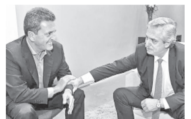
Massa y Fernández.

Hoy también circularon intensos rumores. Una de las versiones