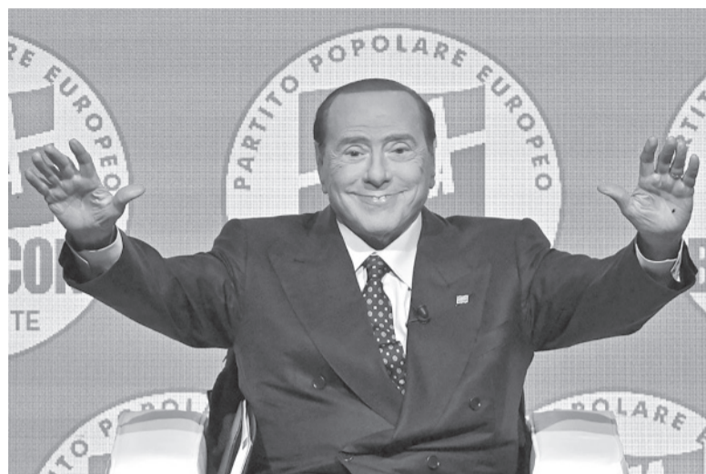
Líder. Silvio Berlusconi se convirtió en un símbolo de la política, el deporte y los medios. - Télam -

La Iglesia de Milán anunció ayer que Berlusconi tendrá "funeral de Estado" en el Duomo de la ciudad norteña, mientras que el Gobierno dispuso luto nacional desde ayer, con las banderas italiana y europea a media asta en edificios públicos. - Télam -