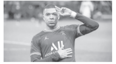
Kylian Mbappé.