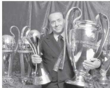
en 2017 por más de 700 millones de dólares.

Pionero entre los políticos populistas de todo el mundo que dieron el salto del fútbol a la política, Berlusconi comandó el club Milan de su ciudad natal desde 1986 y durante 31 años, en los que cosechó 29 títulos y una popularidad que fue uno de los dos pilares para el inicio de su carrera en cargos electivos antes de vender el 99.93% de la sociedad a un grupo chino