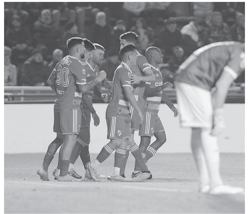
Eficaz. River no falló en la definición y goleó en Banfield.

La pelota detenida, un recurso clásico de los equipos de Falcioni, generó peligro para Banfield a tra-