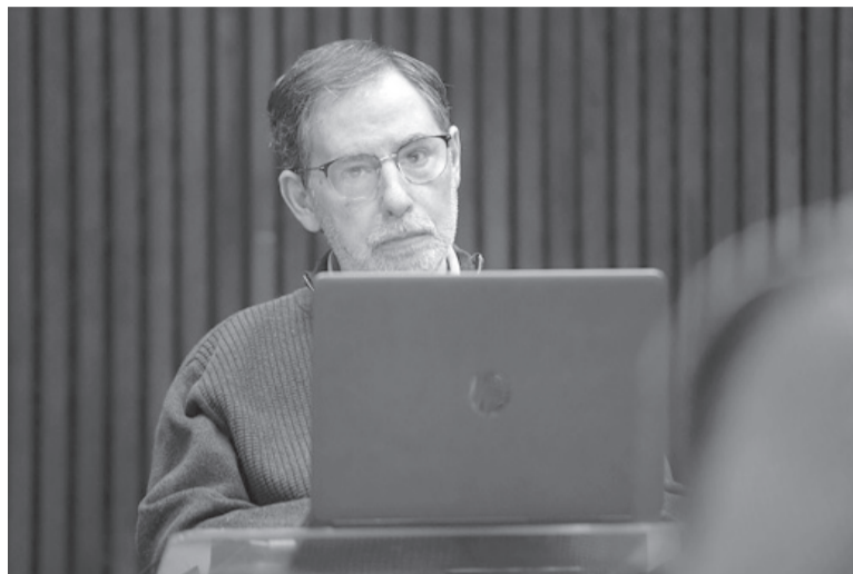
En 2007. Jorge Rivas luego de un asalto quedó privado del habla.

En noviembre de 2007, mientras Rivas se desempeñaba como vicejefe de Gabinete de la Nación, recibió un golpe en la cara durante un asalto que lo dejó cuadripléjico y privado del habla, a raíz de lesiones en gran parte