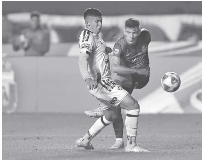
Relegado. San Lorenzo, con un partido más, quedó a siete de River.

Los últimos minutos del encuentro fueron un monólogo de San Lorenzo, que se encontró con una defensa muy cerrada de Central Córdoba -aunque el local fue impreciso- y no le permitió marcar. Para este partido el entrenador Rubén Darío Insúa -con el encuentro de ayer celebró su