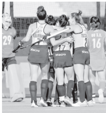
Victoria sobre China.