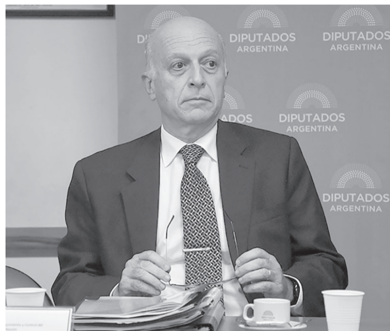
Consultado. El procurador General de la Nación, Eduardo Casal.

El pedido del Partido Política Abierta para la Integridad Social (PAIS)-Distrito Buenos Aires ante