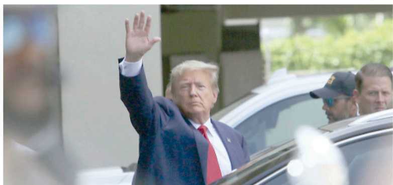
- CNN -