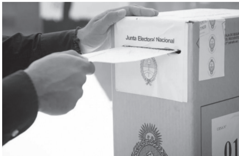
Escenario. Las definiciones podrían llegar recién sobre la última hora de hoy.

■ A las 24 de hoy cierra el plazo para la inscripción de alianzas, el primer momento de definiciones fuertes en el tramo final de las definiciones electorales que culminará el 24 de este mes con la inscripción de candidatos. Juntos por el Cambio llega con una definición de última hora de Juan Schiaretti, el gobernador cordobés, quien presentará su propio frente, aunque eso no despeja del todo la posibilidad del acuerdo político que impulsa Horacio Rodríguez Larreta y rechaza Patricia Bullrich. En el Frente de Todos -que puede cambiar de nombre- el trámite se cumple en medio de la incógnita sobre la presentación de una lista o de más de una, por lo que los ojos están puestos en las reglas que