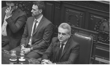
Tercer informe del jefe de Gabinete. - Télam -