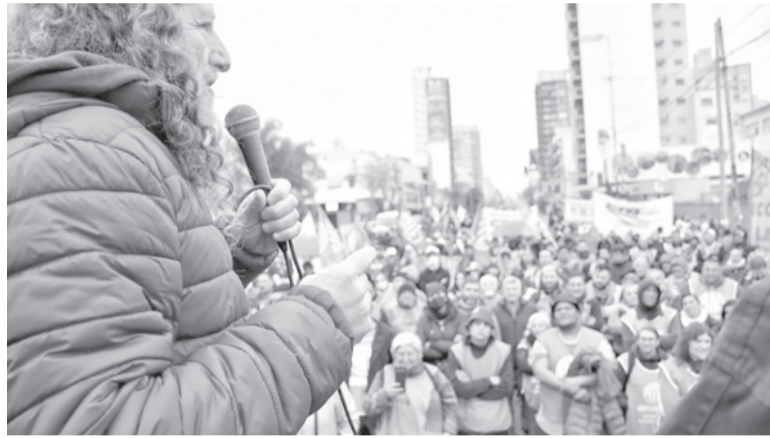
Medida. ATE bonaerense se acopló al paro nacional convocado para el próximo 16 de junio.

La medida de fuerza de ATE incluirá "movilizaciones y asambleas en distintos puntos del territorio bonaerense y una gran marcha central a la Plaza de Mayo en ho-