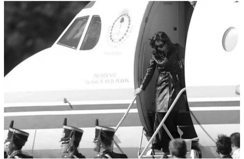
Origen. La llamada "causa de los cuadernos" marcó el inicio de la investigación contra la vicepresidenta. - Archivo -

La causa por los vuelos irregulares es uno de los procesos por los cuales Bonadio había convocado a la expresidenta a una seguidilla de ocho declaraciones indagatorias en un día, el 25 de febrero de 2019: tuvo origen en la causa de los "cuadernos", desde donde el magistrado denunció la formación del proceso y se quedó con el expediente. - Télam -