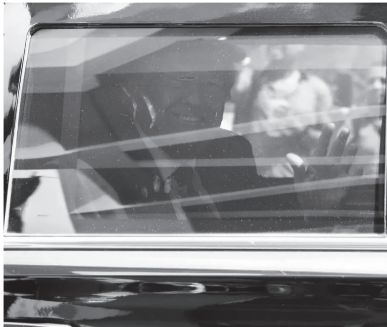
Ante la Justicia. El expresidente estadounidense Donald Trump.

“Creo que transcurre bien”, declaró a sus simpatizantes, que se adelantaron un día para cantarle el tradicional “cumpleaños feliz”.