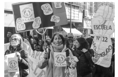
Noveno día de paro.

Ayer, las actividades de protesta incluyeron mateadas y ollas popula-