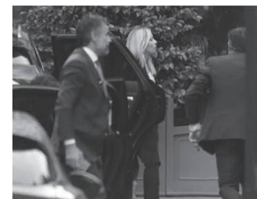
La primera ministra italiana, Giorgia Meloni.