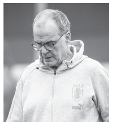
Marcelo Bielsa.

Uruguay, a nivel de seleccionado mayor, se destacó en el Mundial de Sudáfrica 2010, donde clasificó cuarto. Después ganó la Copa América de Argentina 2011 y en la pasada Copa del Mundo de Qatar 2022, con Diego Alonso como DT, no pasó la fase de grupos. Ahora apuesta fuerte a la Copa América de Estados Unidos 2024 y al