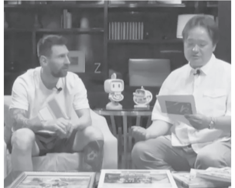
Entrevistado. Messi, en una charla para una plataforma china.

Durante la entrevista con el único periodista chino que par-