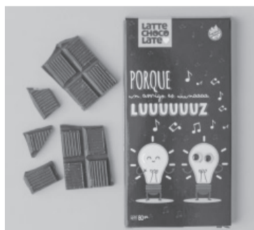
"Latte Chocolate" en la mira.

Al analizar los rótulos de los productos, la Dirección de Industrias y Productos Alimenticios de la provincia de Buenos Aires (DIPA) determinó que tanto el Certificado