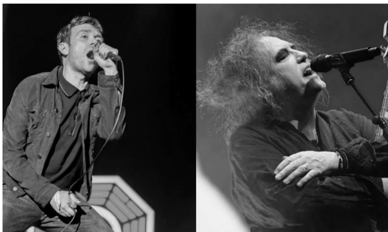
Confirmados. Blur y The Cure dos bandas que vuelven al país.

En el caso de Blur, significará su vuelta luego del concierto ofrecido en 2015 en Tecnópolis, aunque su líder Damon Albarn estuvo de visita el año pasado con Gorillaz, uno de sus tantos proyectos, en ese mismo escenario, en el marco del