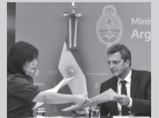
Crédito para Argentina. - Télam -

Por su parte, la Canasta Básica Alimentaria (CBA), determinó que un adulto necesitó al menos $32.056 en marzo para no ser indigente. En el caso de una familia tipo (cuatro integrantes) la cifra fue de $99.053. En el caso de tres miembros ($74.953) y cinco, $104.182. - DIB -