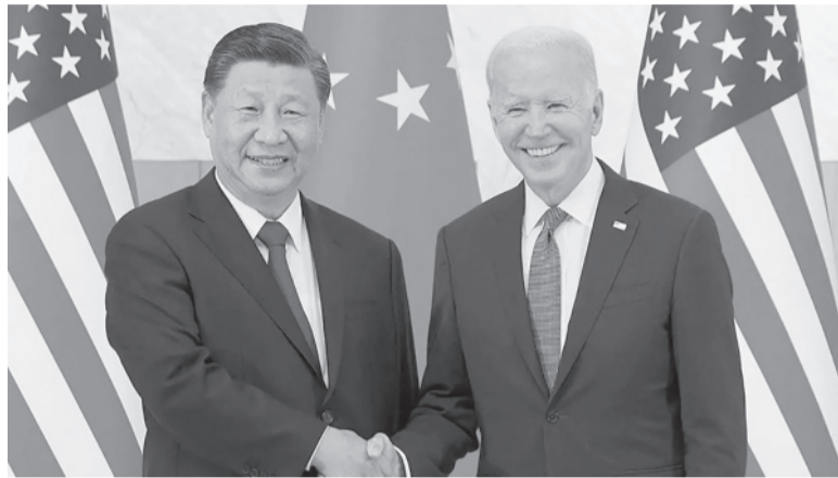
Diplomacia en crisis. A las profundas diferencias ideológicas, el derribo de un supuesto globo espía molestó a Biden.

La vocera denunció que "las declaraciones de Estados Unidos son extremadamente absurdas e irresponsables, contradicen los hechos, violan gravemente el protocolo diplomático, atentan gravemente contra la dignidad política de China y constituyen una abierta provocación política", según reco-