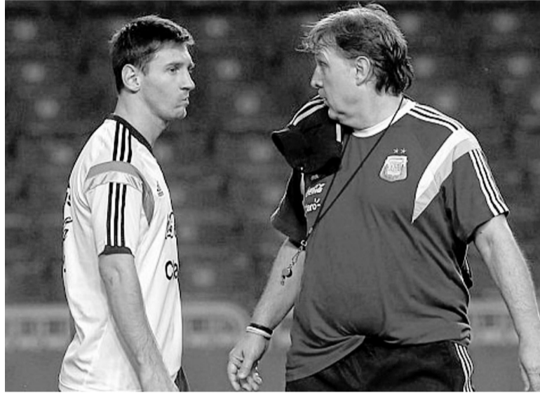
Viejos conocidos. Coincidieron en Barcelona y en la Selección.