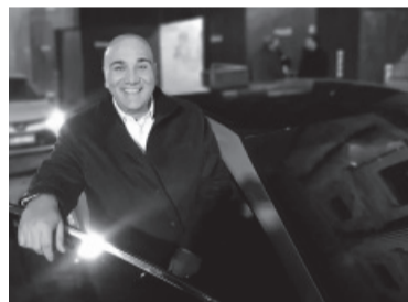
Juan Manzur, posible vice oficialista.

en su despacho del Senado al gobernador de Tucumán, Juan Manzur. El ex jefe de Gabinete había dejado trascender sus intenciones de competir por la presidencia aunque con el correr de las semanas los rumores lo ubicaban como posible candidato a vicepresidente. El contenido de la reunión no trascendió.