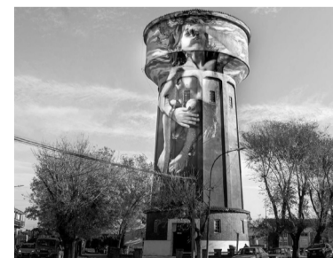
El mural fue elegido entre más de 300 obras.