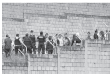
La matanza se desató por la pelea de dos facciones antagónicas.

La jefa de Estado dijo en Twitter estar "conmocionada por el monstruoso asesinato de mujeres