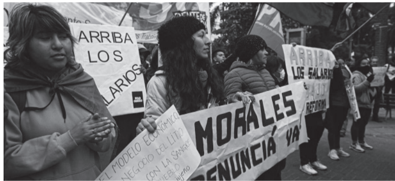
El gobernador jujeño, eje de los reclamos.

El gobernador de la provincia de Jujuy, Gerardo Morales, volvió a apuntar ayer contra el presidente Alberto Fernández y la vicepresidenta Cristina Kirchner, a quienes acusó de “financiar” a los manifestantes que protestaron el martes en la provincia contra la reforma de la constitución de su distrito y fueron reprimidos por las fuerzas de seguridad locales. “Aquí hay una intervención del gobierno nacional, de Alberto (Fernández) y Cristina (Fernández de Kirchner), sus ministros y legisladores nacionales, que están financiando” a los manifestantes en la provincia de Jujuy, señaló Morales en declaraciones a radio La Red.