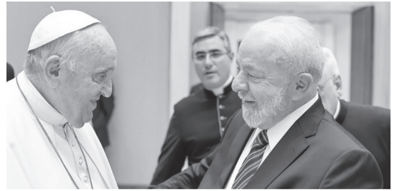
Encuentro en la "Auletta".

Recién recuperado, el Sumo Pontífice se reunió durante 45 minutos con el mandatario brasileño.