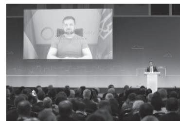
Zelenski pidió más "acción" que "compromisos". - Télam -

Políticos de Europa y Estados Unidos prometieron que algún día Rusia pagaría por la destrucción, aunque los funcionarios reconocieron que ese día está lejos. Asimismo, le prometieron a Zelenski varios miles de millones de dólares en ayuda no militar para reconstruir su infraestructura devastada por la guerra, luchar contra la corrupción y ayudar a allanar el camino del país hacia la membresía en la Unión Europea. El jefe del Gobierno alemán, Olaf