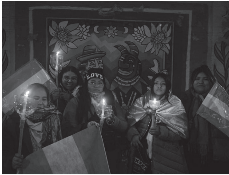
Emotivo. En la movilización participaron docentes y comunidades indígenas. - Télam -

“Hay una extrema violencia, de la cual el kirchnerismo, La Cámpora y la izquierda hicieron una forma de vida. Quieren reinstalar esto en Jujuy, pero no lo vamos a permitir”, expresó. - Télam -