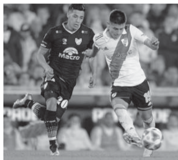
Debutó Echeverri y recibió la primera ovación.

En un primer tiempo entretenido, Instituto pegó primero y rápido con el gol de Rodríguez. El delantero acomodó la pelota en el bíceps derecho, tras el pase de Franco Watson, y sacó un remate