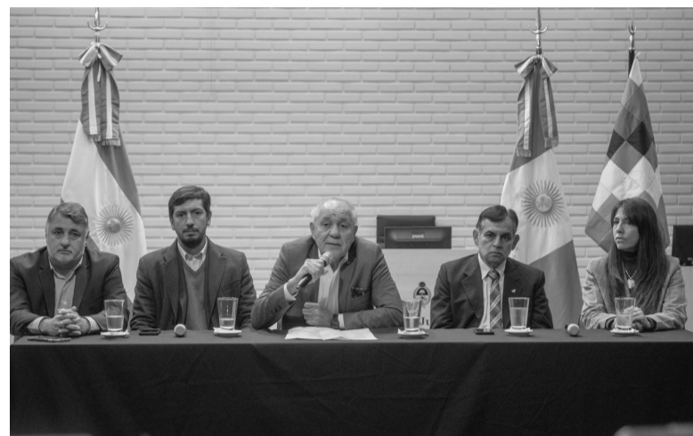
Conferencia. El procurador General de Chaco y los tres fiscales calificaron al hecho como "macabro y atroz".