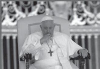
“Mi respiración no es buena”, dijo el argentino. - Vaticano -

El papa Francisco se saltó la lectura de un discurso planeado en una conferencia este jueves, diciendo que todavía tenía problemas respiratorios luego de una operación de hernia este mes.