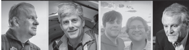
Submarino perdido. Dos "pedazos" del sumergible fueron hallados a 500 metros del Titanic.

La Guardia Costera estadounidense había informado ayer el hallazgo de "un campo de restos" aún sin identificar cerca del Titanic por los equipos que buscaban al sumergible Titán, desaparecido el domingo pasado en el Atlántico Norte tras haber iniciado la inmersión con cinco personas a bordo.