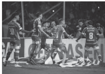
Paliza del "Bodeguero" ante su gente.