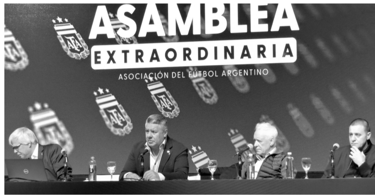
Desprolijo. Cambio importante con la competencia iniciada.

Este cambio ocurrió, según trascendió, a favor de las presiones ejercidas especialmente por tres clubes grandes como Independiente, Vélez y Huracán, que hoy en día están comprometidos por tabla anual y