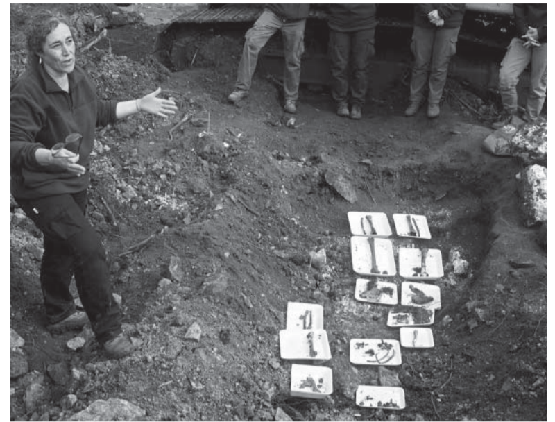
A la Argentina. El material genético recuperado será enviado a Córdoba para ser identificado.

Sin embargo, agregó que en el caso del militante comunista Eduar-