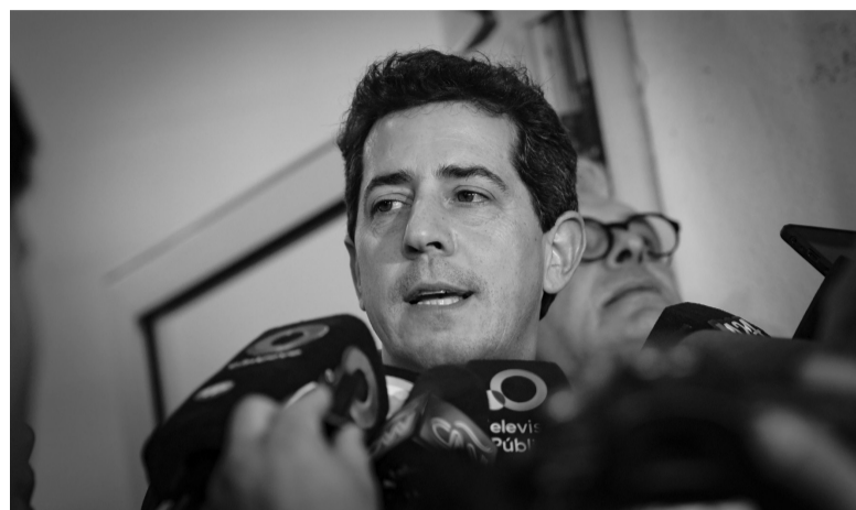
Oficial. Minutos antes del lanzamiento de su spot, De Pedro había admitido que “faltaba poco” para su anuncio.

El anuncio se filtró antes del mediodía, pero la confirmación se retrasó, en medio de intensas negociaciones que buscan que en el oficialismo haya una lista de unidad, lo que requeriría que Daniel Scioli deponga su postulación, algo