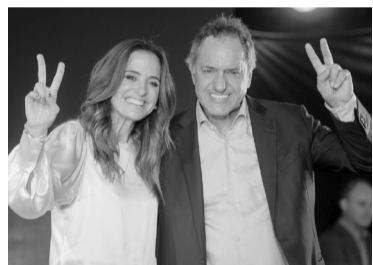
Tolosa Paz, precandidata.

Scioli también formalizó su intención: “Aunque no quieran, van a encontrar nuestra boleta”