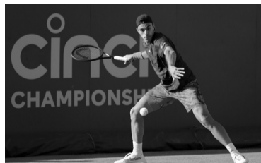
Cerúndolo perdió con Dimitrov.

Por su parte, Schwartzman (107) fue superado previamente por el australiano Álex de Miñaur (18) por 6-2 y 6-2, luego de 1 hora y 6 minutos de enfrentamiento.