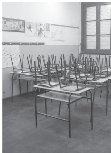
Aulas vacías. - DIB -