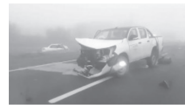
Choque fatal en Ruta 5. - El Diario de La Pampa -