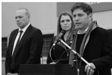
El Gobernador, en una visita a Melchor Romero.