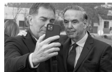
Pichetto ayer junto a Santilli, hombre larretista en provincia.

apresta a nombrar a Gerardo Morales como su acompañante en el binomio. “El cambio que queremos proponerle al país es muy profundo, va a hacer falta mucha fuerza, coraje, valentía y decisión. Por eso entendí que Luis es la persona ideal para acompañarme. Gracias por sumar tu fuerza”, expresó Bullrich en un video publicado en sus redes sociales. - DIB -