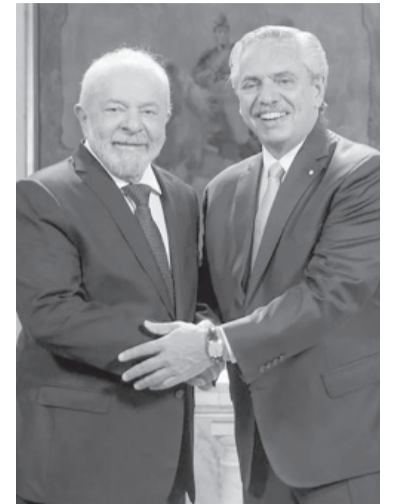
Encuentro de presidentes.