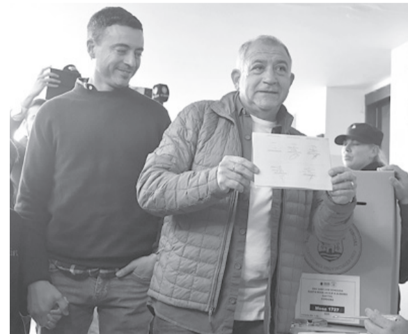
Voto a voto. Martín Llaryora (Hacemos Unidos por Córdoba) y Luis Juez (Juntos por el Cambio).