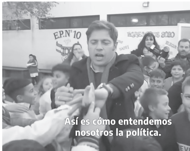
Elegidos. El Gobernador destacó los hitos de su gestión. - Captura de video -

La primera política destacada en el lanzamiento es la implementación del Plan Qunita Bonaerense, que entrega un moisés y elementos de cuidado a familias