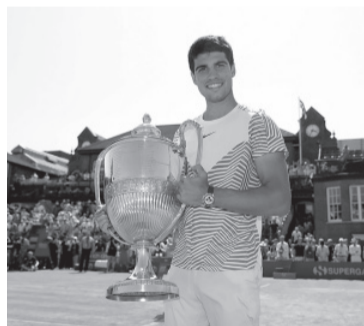
Alcaraz y su primer título en césped.

mí. Demostrar que soy capaz de mantener un buen nivel sobre césped me hace sentir muy feliz", dijo el español, que demoró una hora y 39 minutos para cerrar el compromiso ante el australiano.