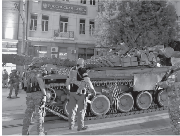
De salida. Los militares de Wagner dejan el centro de Rostov del Don.

Prigozhin dijo el sábado que ponía fin a la rebelión para evitar un "baño de sangre". El líder de