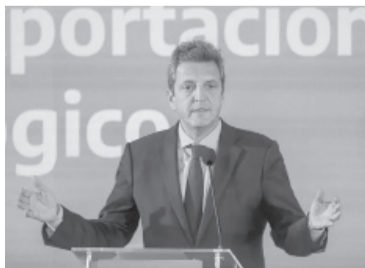
El ministro y precandidato presidencial Massa. - Archivo -

El ministro de Economía, Sergio Massa, rubricará hoy los acuerdos individuales con Francia, España y Suecia, en el marco de la negociación de la deuda con el Club de París, según consignaron fuentes del Palacio de Hacienda. La firma de los documentos se realizará a las 12 en la sede de la cartera económica para dar por finalizada la negociación por la refinanciación de la deuda con ese nucleamiento. Un portavoz ministerial consignó que "con estos países más Japón, que firmará próximamente, tenemos todos los acuerdos para tener financiamiento directo para Argentina por parte de los países que conforman el Club de París".