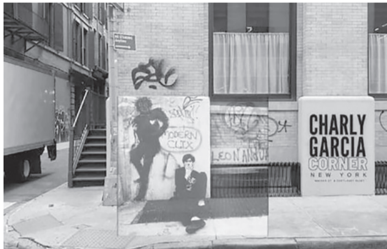
Icónica. El cruce de las calles Walker Street y Cortlandt Alley donde se tomó la fotografía que ilustra la tapa.