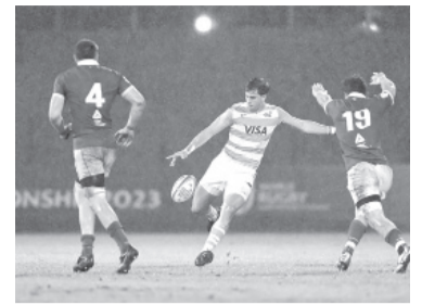
Fue 20 a 0 por el Grupo C. - @unionargentina -