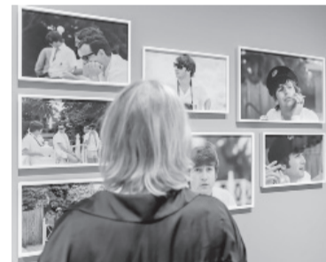
Exposición sin precedentes en Londres. - Télam -

McCartney con su propia cámara entre diciembre de 1963 y febrero de 1964, un período en el que The Beatles pasaron de ser la banda más popular en el Reino Unido a un fenómeno cultural internacional. Estas imágenes inéditas tomadas con la lente de la cámara Pentax de McCartney, ofrecen una perspectiva personal y única de cómo era ser un Beatle en el comienzo de la Beatlemania. - Télam -