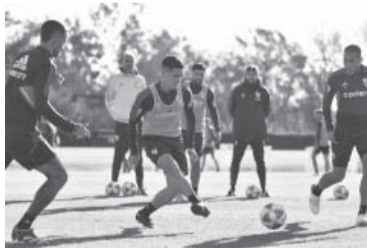
Hoy habrá un nuevo entrenamiento. - River -

De este modo, el posible 11 para jugar ante el "Guapo" el sábado a las 15 en Parque de los Patricios sería con Franco Armani, Milton Casco, Robert Rojas, Paulo Díaz