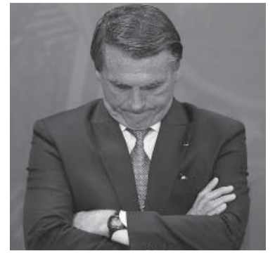
El expresidente pierde parcialmente 3-1 en la votación.