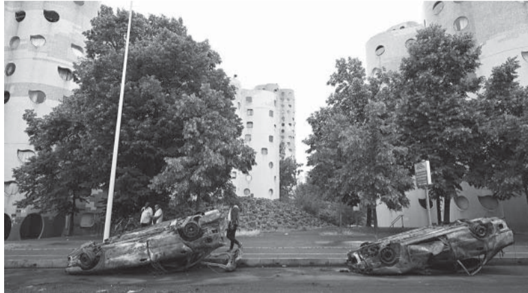
Revueltas. En las manifestaciones se incendiaron autos y atacaron diferentes edificios de instituciones.

El Gobierno cuestionó la actuación del agente, captada también por un testigo que filmó la escena, cuyo contenido ya está en poder de