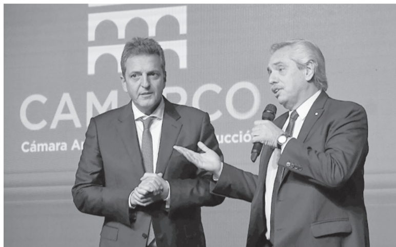
Alivio. El pago al Fondo Monetario evitará que Argentina caiga en default. - Télam -

narios del Ministerio de Economía luego de la reunión que mantuvieron el lunes por la mañana junto a Massa.