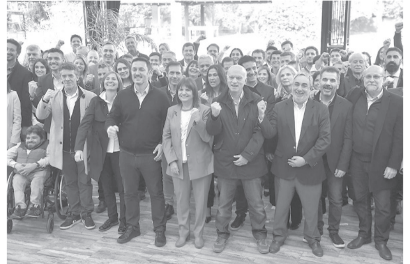
Encuentro. Las declaraciones de la exministra se dieron en un cónclave con referentes de JxC en Pilar.

"Vamos a tener una pelea contra un Goliat", dijo en referencia a Massa, de cara a las PASO, pero remarcó que sin embargo ambos tienen una posición común en cuanto al "proyecto inhumano de (Horacio Rodríguez) Larreta, (Patricia) Bullrich, etc". - DIB -