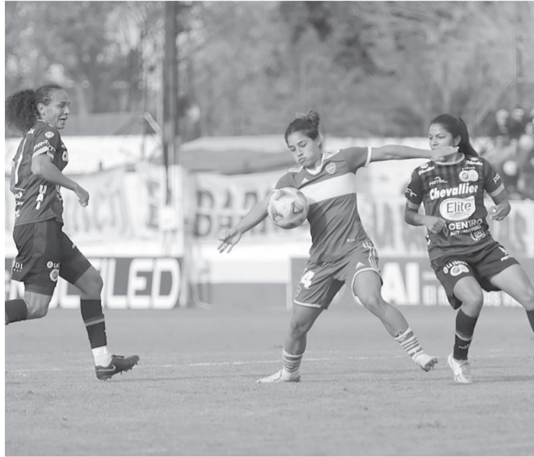
Todo o nada. Apasionante definición a partir de las 19.