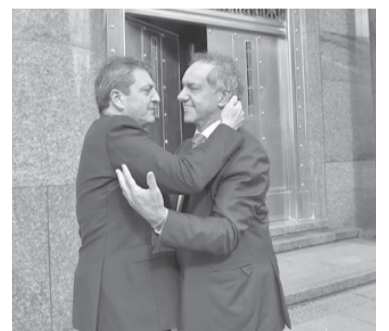
Postal de unidad. - Télam -

En tanto, el presidente de la Coalición Cívica, Maximiliano Ferraro, consideró que "no son tiempos de bravuconadas". En ese sentido, el precandidato a diputado nacional por la Ciudad de Buenos Aires cruzó a Bullrich y dijo que "no son tiempos de bravuconadas o generar shocks en el electorado". - DIB -