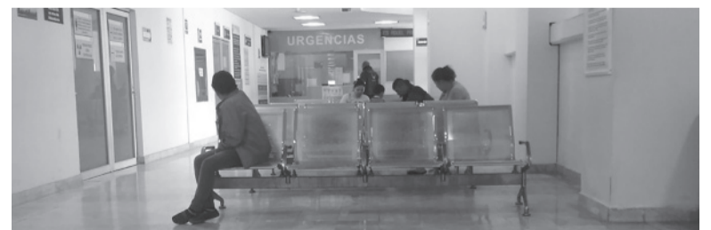
Un conflicto que pondría en peligro todo el sistema de atención.

nales advirtieron: "Toleramos débitos de supuestas prestaciones brindadas en los policlínicos del IOMA, aun cuando los mismos se realizan sin la suficiente documentación respaldatoria y en varios casos son realizadas por médicos que ejercen la medicina en forma irregular o sin la debida calificación médica, pero no aceptaremos ningún débito de ho-