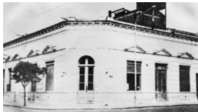
Esquina de Burgos y Belgrano. El Tiempo se instaló en el edificio en diciembre de 1942. Hoy, con la fachada remodelada y el nuevo diseño en su edición impresa.

Además, en los últimos meses, Diario El Tiempo ha alcanzado un hito significativo al establecer una alianza estratégica con Verte TV, lo que ha permitido que sus contenidos lleguen en edición impre-