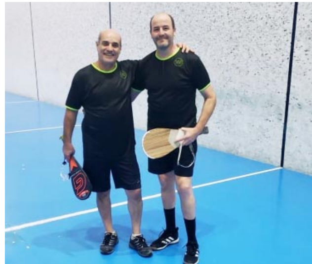
Avena y Tomaselli ganadores en Trenque Lauquen

En la final, se enfrentaron los equipos de La Madrid C y