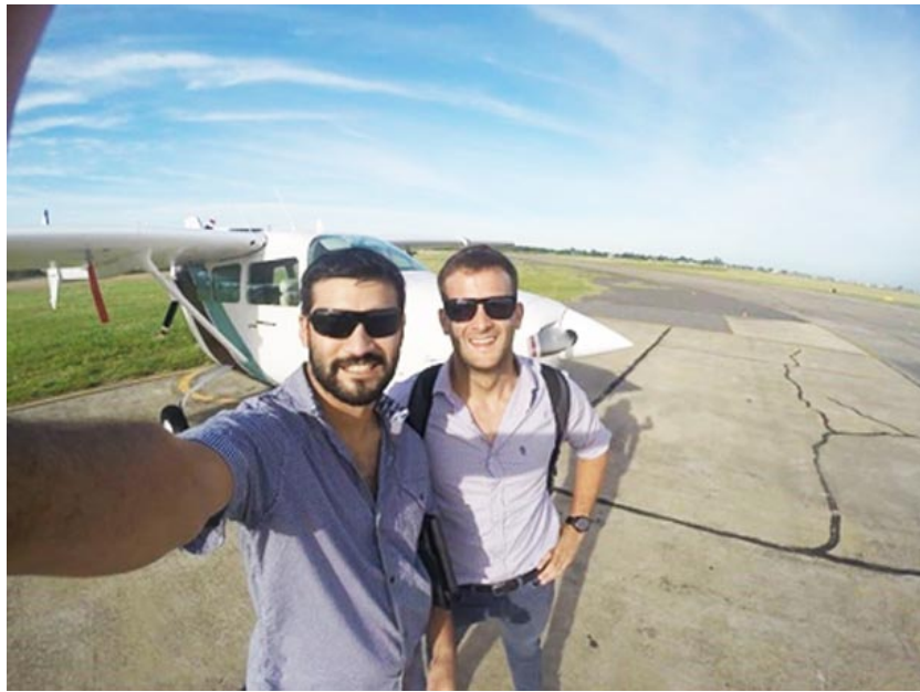
La foto muestra al piloto y copiloto del avión.

El mes de julio, en este caso el día 26 de julio 1980 ocurrió el grave accidente de Médanos, en el micro viajaba personal, alumnos y familiares que los acompañaban, de la escuela Normal de Bragado. El miércoles 26 se cumplirán 43 años de una tragedia que enlutó a Bragado.