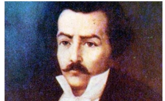
Francisco Narciso de Laprida.

La salud también exige esfuerzos y necesita de la atención de funcionarios y vecinos. En estos días, con manifestaciones del personal que queda sin trabajo, el Sanatorio del Círculo Médico es la imagen de lo que no debiera pasar. Tal vez todavía haya tiempo de agotar las opciones que puedan asegurar la atención a toda la comunidad.