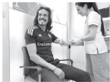
El uruguayo en la revisión médica.

La estrella uruguayo, quien se desvinculó de Valencia de España en los últimos días, reconoció el paso del tiempo, a sus 36 años, pero dijo que "las ganas son las mismas"