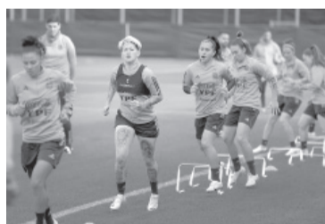
Argentina entrena en Auckland de cara al último partido de la fase de grupos.

fuera; un empate les daría buenas chances y con un triunfo de las africanas se definiría por diferencia de goles.