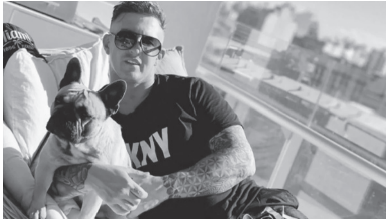
Pista caída. El microchip que tiene "Cooper" no tiene GPS.