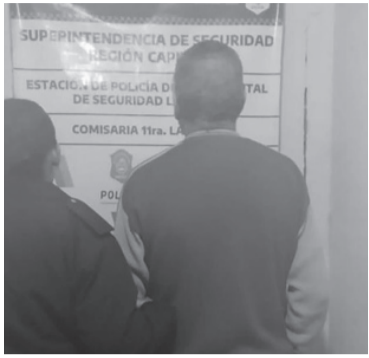
El acusado fue detenido por la policía. - Seguridad -