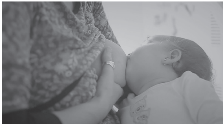
Dilema. Las mujeres no deberían tener que elegir entre amamantar a sus hijos o trabajar.

“Lactancia natural, más allá de los seis meses”, la SAP destacó que la leche humana previene infecciones respiratorias y digestivas en los lactantes, reduciendo el riesgo de hospitalización en un 57% y 76% respectivamente, mientras que, a largo plazo, disminuye el riesgo de sobrepeso en un 26% y de diabetes tipo dos en un 35%.