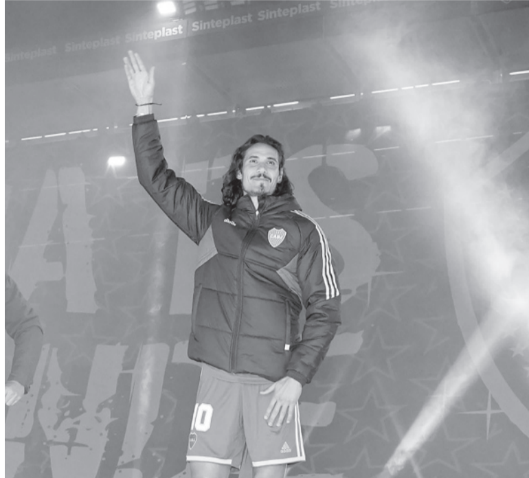
La bienvenida. El delantero saluda a los hinchas "xeneizes".

Boca jugará el próximo miércoles ante Nacional de Uruguay la ida de los octavos de final de la Copa Libertadores y Cavani expresó su idea con respecto a ese compromiso: "Estoy para estar a disposición del entrenador y si hay que jugar se jugará y se tomarán los riesgos que se