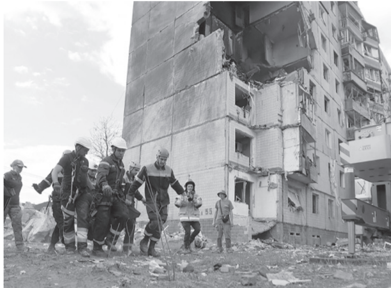
Destrucción. Muertes y heridos en la ciudad de Krivoi Rog.

En la ciudad de Jerson, capital de la provincia homónima, en el sur de Ucrania, otro ataque ruso dejó al menos cuatro muertos y 17 heridos, informó la Presidencia ucraniana. En la vecina provincia de Zaporíyia, un ataque de artillería ucraniano dio de lleno