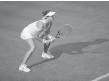
La rosarina avanza en el cuadro femenino.