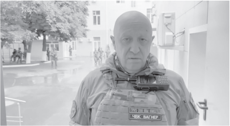
Rebelde. El jefe del Grupo Wagner, Yevgueni Prigozhin.

■ El jefe del Grupo Wagner, Yevgueni Prigozhin, pidió ayer apoyo desde Bielorrusia, donde se encuentra desde que salió de Rusia tras el levantamiento protagonizado por el grupo de mercenarios que encabeza, y aseguró que “habrá nuevas victorias en el frente” de batalla contra Ucrania. “Hoy, más que nunca, es necesario que nos apoyen”, dijo Prigozhin en su primer mensaje de audio desde que abandonó el territorio ruso después de alcanzar un acuerdo con el presidente ruso, Vladimir Putin, en pleno aumento de la tensión. En el mensaje difundido por un canal de Telegram afín al Grupo