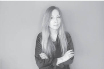
Victoria Amelina.

La escritora ucraniana Victoria Amelina, de 37 años, que fue una de las víctimas del bombardeo ruso de Kramatorsk ocurrido el 27 de junio, murió como consecuencia de las heridas sufridas en el ataque, que costó la vida a trece personas. Amelina se encontraba en una pizzería en el momento del ataque ruso en compañía del también escritor colombiano Héctor Abad y el que fuera Alto Comisionado para la Paz de la presidencia