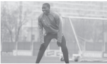
Un “refuerzo” para Boca.