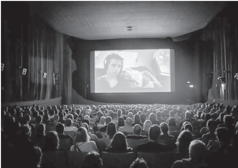
Financiación. El programa para realizar compras en hasta 24 cuotas fijas se extiende hasta el 31 de enero.

El programa “Ahora 12”, que permitirá la adquisición de bienes y servicios producidos en el país, incluye 35 categorías como electrodomésticos de línea blanca, indumentaria, calzado, marroquinería, celulares, materiales para la construcción y ahora hasta espectáculos para las vacaciones de invierno, entre muchos otros. El viernes pasado, la Secretaría de Comercio, a través de la resolución