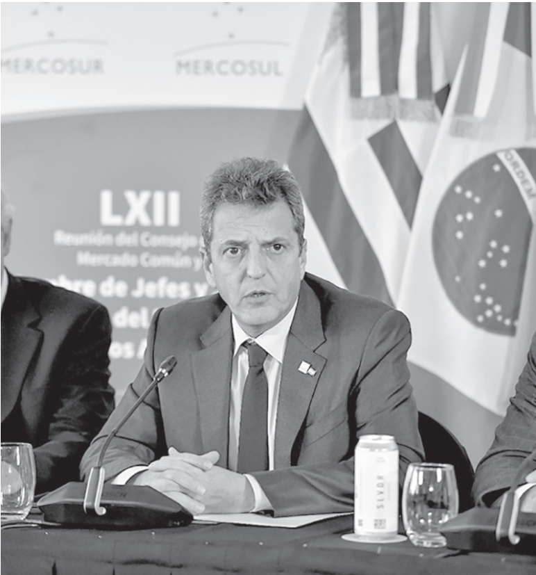
En el centro. Sergio Massa encabezó la reunión en Puerto Iguazú.

locales, en momentos de crisis como el que vive Argentina por la peor sequía de su historia, alivia la presión sobre el uso de reservas y sobre la cuestión cambiaria”, subrayó el ministro. Massa enfatizó que “el uso de monedas locales evita ser rehenes de los shocks externos y da mayor capacidad de desarrollo económico en la región, mucho más cuando entendemos que los temas de seguridad alimentaria y energética son parte de la agenda global de los próximos diez años y que esta región y este bloque tienen un papel central para jugar en la producción de proteínas y en lo que respecta al abastecimiento energético”. En la misma sintonía, la secre-