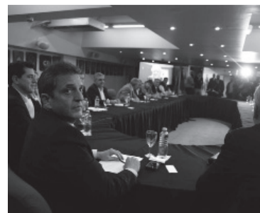
Reunión de gobernadores.

Los gobernadores oficialistas y aliados manifestaron ayer su apoyo a la fórmula de Unión por la Patria (UP) conformada por Sergio Massa y Agustín Rossi, en el marco de un encuentro en el Consejo Federal de Inversiones (en el microcentro porteño), y anunciaron al ministro del Interior, Eduardo "Wado" de Pedro, como jefe de campaña. - DIB -