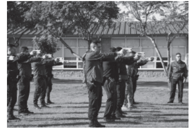
Capacitación de 250 policías.