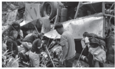
Bus en Oaxaca.