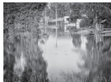
Un tramo de la Autovía 2 se anegó por el agua acumulada.

Asimismo, desde la Municipalidad detallaron que se brindó ayuda a "40 personas entre evacuados, autoevacuados y asistencia domiciliar a través de la Secretaría de Desarrollo Social, situaciones en