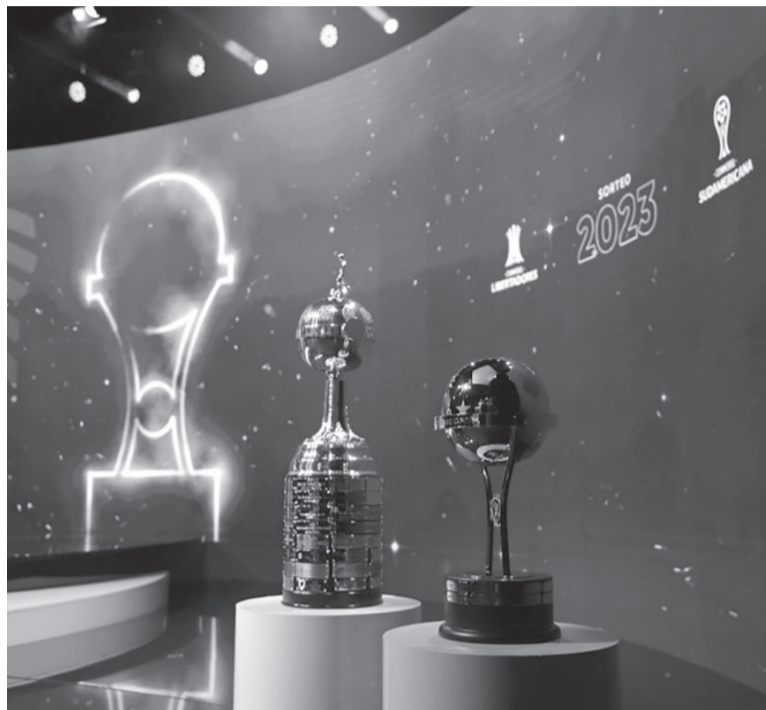
Cuadro. Racing vs. Atlético Nacional y Argentinos vs. Fluminense. - Internet -

de Estados Unidos, México y Canadá 2026, ante Bolivia y Perú en septiembre venidero. "Es un técnico cuya propuesta es parecida a la del entrenador que asumirá a partir de la Copa América, Ancelotti", dijo el presidente de la CBF, Ednaldo Rodrigues, según "Globo Esporte". La contratación de Ancelotti es una apuesta de la CBF para intentar poner fin a más de dos décadas sin ganar el máximo trofeo del fútbol, el último en Corea del Sur y Japón 2002. Con la idea de reconciliar al pueblo con el equipo nacional, el presidente de la CBF se propuso fichar a un técnico cuya figura no admitiera debate. - Télam -