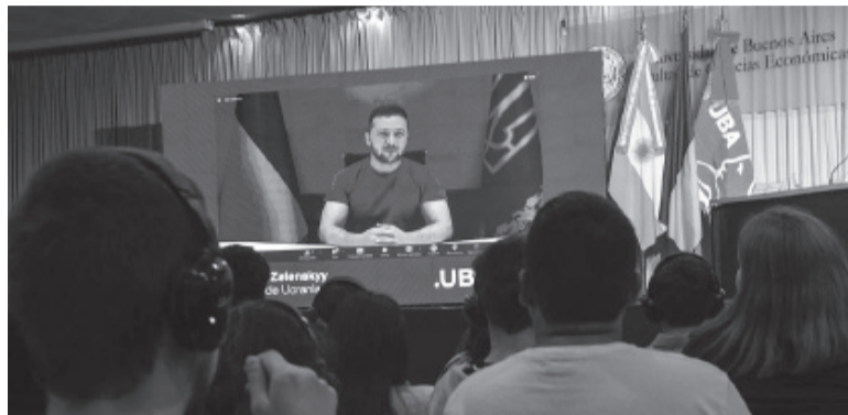
Videoconferencia. El presidente de Ucrania en charla con estudiantes de la UBA.

rra. Fue Rusia la que vino a nuestra tierra, que quema nuestras ciudades, que mata y deporta a nuestra gente. Para nosotros es la guerra por la libertad. Por eso estamos luchando y nunca cederemos nuestra libertad”, apuntó en la actividad que contó con la presencia de diplomáticos de varios países, entre ellos los embajadores de Estados Unidos y de la Unión Europea (UE), además de autoridades universitarias.