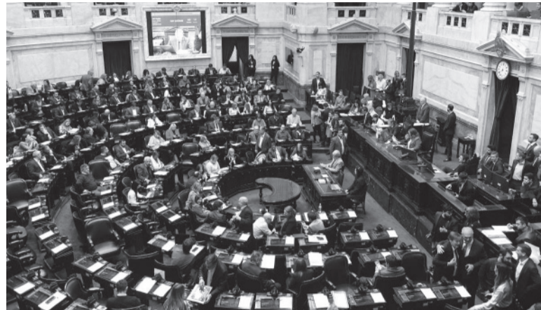
Sesión extendida. Iniciado al mediodía, el debate por la ley de Alquileres quedó fuera del orden del día muy pronto.

Seguidamente, el radical cordobés sacó de la galera una jugada que desconcertó al oficialismo, que no estaba avisado de la maniobra: mocionó que la Cámara baja convoque a una sesión especial para el 23 de agosto a las 12 con foco en la Ley de Alquileres. Asabiendas de que el Frente de Todos se iba a oponer, el objetivo era poner en evidencia la falta de interés del oficialismo en resolver una de las grandes preocupaciones de la ciudadanía vinculadas al acceso a la vivienda.