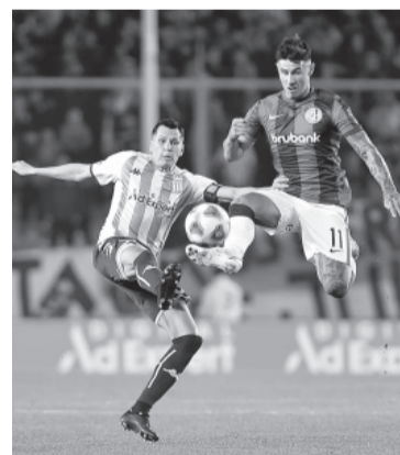
Sabor a poco para ambos.

El clásico se jugó con pierna fuerte de parte de ambos, a punto tal que hubo un expulsado por lado: