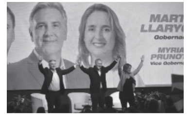
La fórmula "schiarettista".

Los gobernadores oficialistas y aliados manifestaron ayer su apoyo a la fórmula de Unión por la Patria (UP) conformada por Sergio Massa y Agustín Rossi, en el marco de un encuentro en el Consejo Federal de Inversiones (en el microcentro porteño), y anunciaron al ministro del Interior, Eduardo "Wado" de Pedro, como jefe de campaña. - DIB -