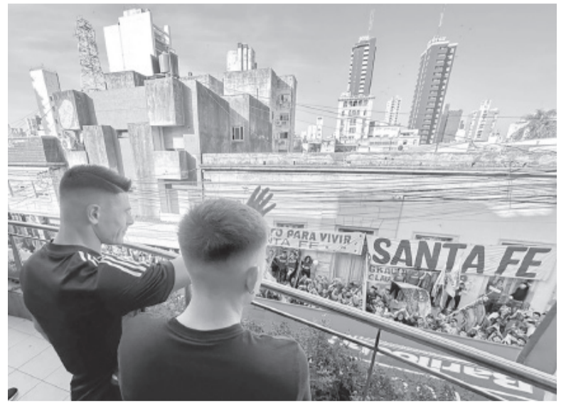
Recibimiento. Locura auriazul en Santa Fe. - Boca -

Árbitro: Sebastián Martínez. Cancha: Eva Perón. Hora: 19.00 (ESPN Premium).