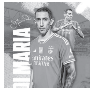
Llega desde Juventus. - Benfica -