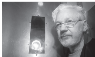
Julian Assange. - Archivo -

divulgar documentos confidenciales. Stella Assange hizo sus comentarios en una conferencia de prensa en Ginebra justo cuando el presidente Biden, que busca se reelección el año próximo, se encontraba de visita en el Reino Unido en el marco de una gira por Europa. - Télam -