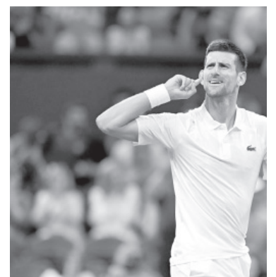
Festeja el serbio y avanza a paso firme.

final lo protagonizarán el italiano Jannik Sinner (8) y el ruso Roman Safiullin (92), sorpresa del certamen.