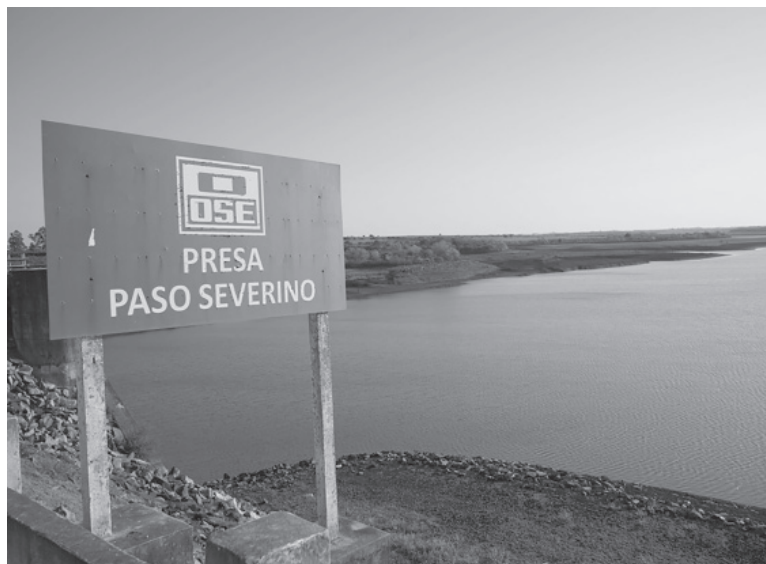
Mejora. Quinto día de aumento consecutivo en reservas de Paso Severino; cloruros superaron levemente nivel permitido, según El País. - El País -

también la resistencia del termotanque, que le salió 2.000 pesos uruguayos, unos 13.700 pesos argentinos, aproximadamente. "Es una cagada lo que está pasando, hablando mal y pronto. Se me ha roto todo, el calefón, el lavarropas y las canillas están todas oxidadas", comentó el hombre mientras metía el artefacto en el baúl de su auto. "Hace tiempo que no consumo agua de la canilla pero se le siente el gusto a sal cuando me baño", afirmó. - Télam -