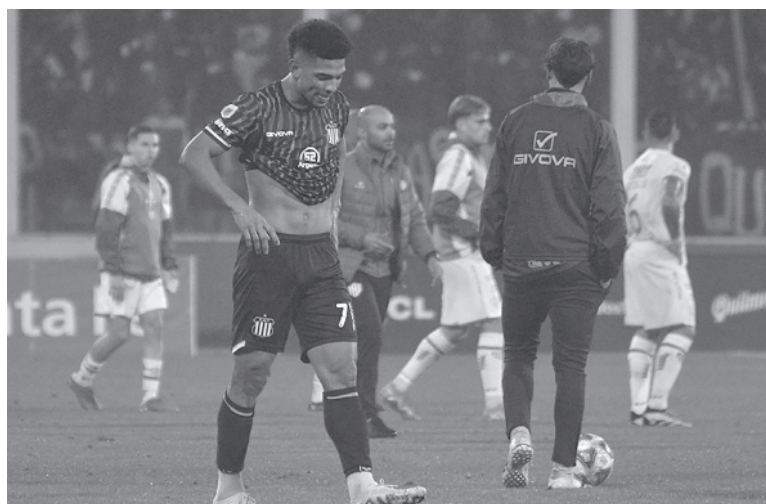
Frustración. El equipo cordobés dejó pasar otra chance.

Árbitro: Nicolás Lamolina. Cancha: Mario Alberto Kempes.