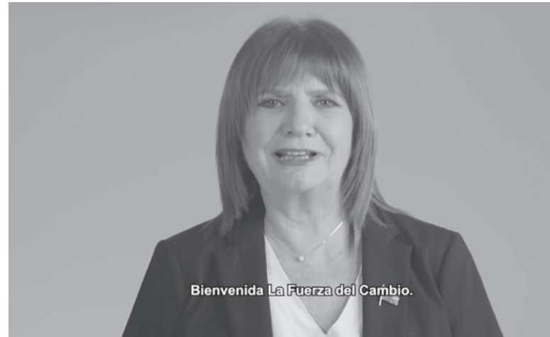
Spot. "Llegó el momento de poner en marcha la fuerza que va a ordenar el país", dice Patricia Bullrich.

Por su parte, la líder del grupo de "los halcones" del PRO defendió su propaganda y atacó a Larreta. "Nosotros nos paramos con firmeza. Si hay quienes creen que esa firmeza no es la necesaria para Argentina, que expliquen cómo van a negociar con los corruptos y con aquellos que han hecho de Argentina un país destruido", dijo Bullrich en declaraciones a la prensa durante una recorrida en la ciudad bonaerense de Caseros. En esa línea, la exministra de Seguridad de Mauricio Macri (2015-2019) aseguró que su spot "tiene una línea bien clara" que consiste en "un cambio" que "es todo o es nada". "Nosotros no queremos que se corte medio carril. Queremos que desaparezcan los piquetes para que la gente viva en orden. Somos firmes. Queremos un cambio de verdad", agregó.