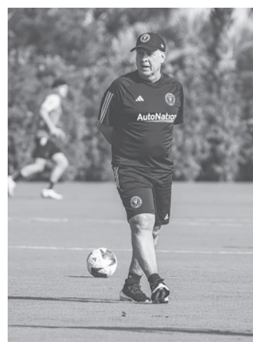
El argentino comenzó su ciclo en Miami. - Internet -

El posible estreno de Messi está programado para el 21 de julio contra Cruz Azul por la Leagues