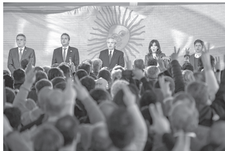
El acto. La inauguración del Gasoducto, gesto de unidad oficial.

Minutos después, el propio Macri escribió en redes sociales una respuesta para Cristina y publicó una serie de cifras para contrarrestarla. "La vicepresidenta me acusa de no haber construido gasoductos. ¿Para qué iba a hacerlo, si nos había dejado sin gas para transportar? Su gobierno